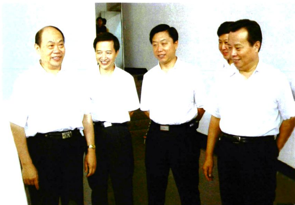
校领导与时任河南省电力公司总经理卢健(右一)在一起