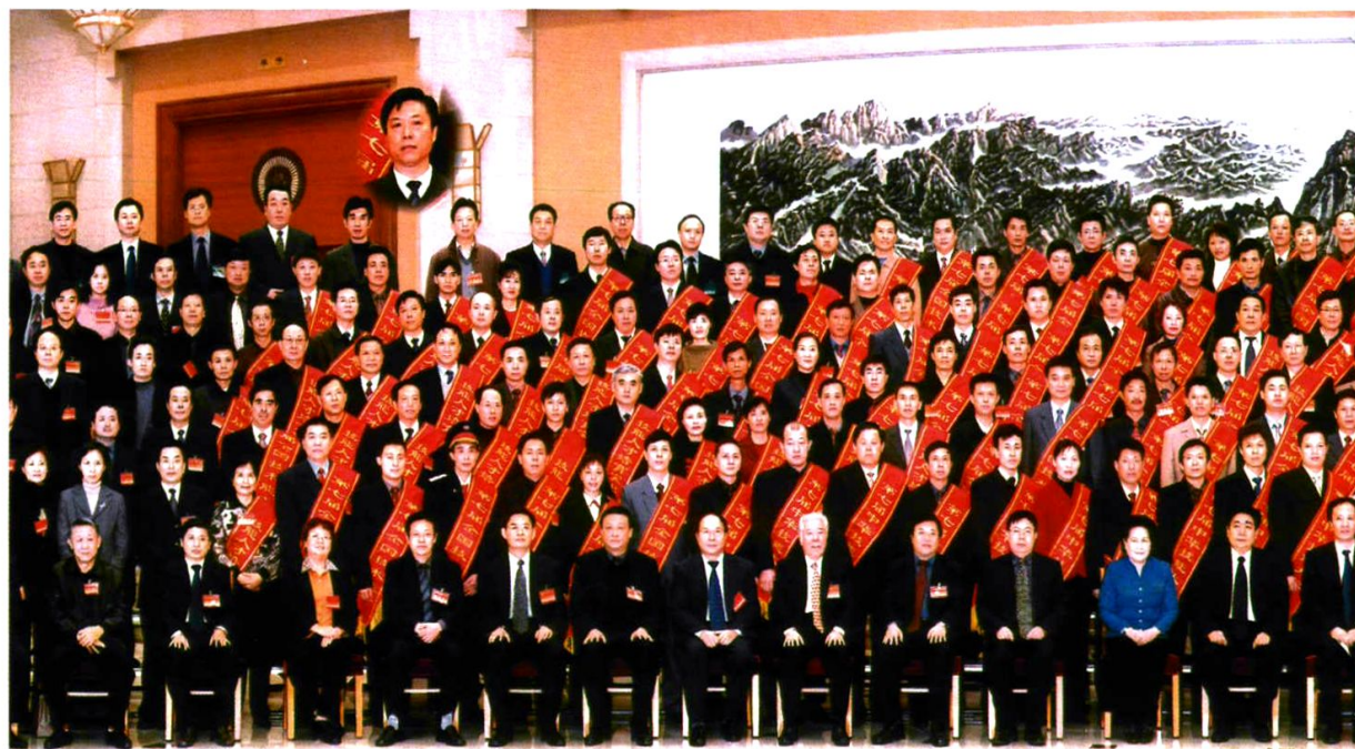
黄菊副总理与苏国政校长及其他代表合影