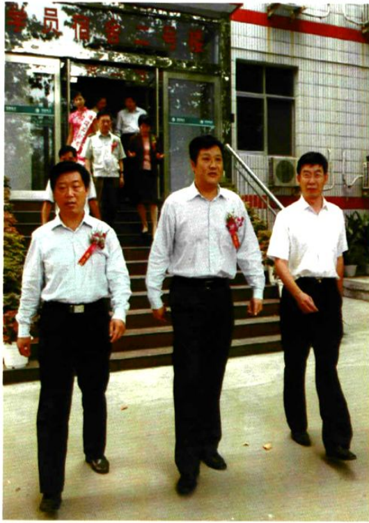
郑州市市长赵建才(中)来校视察工作