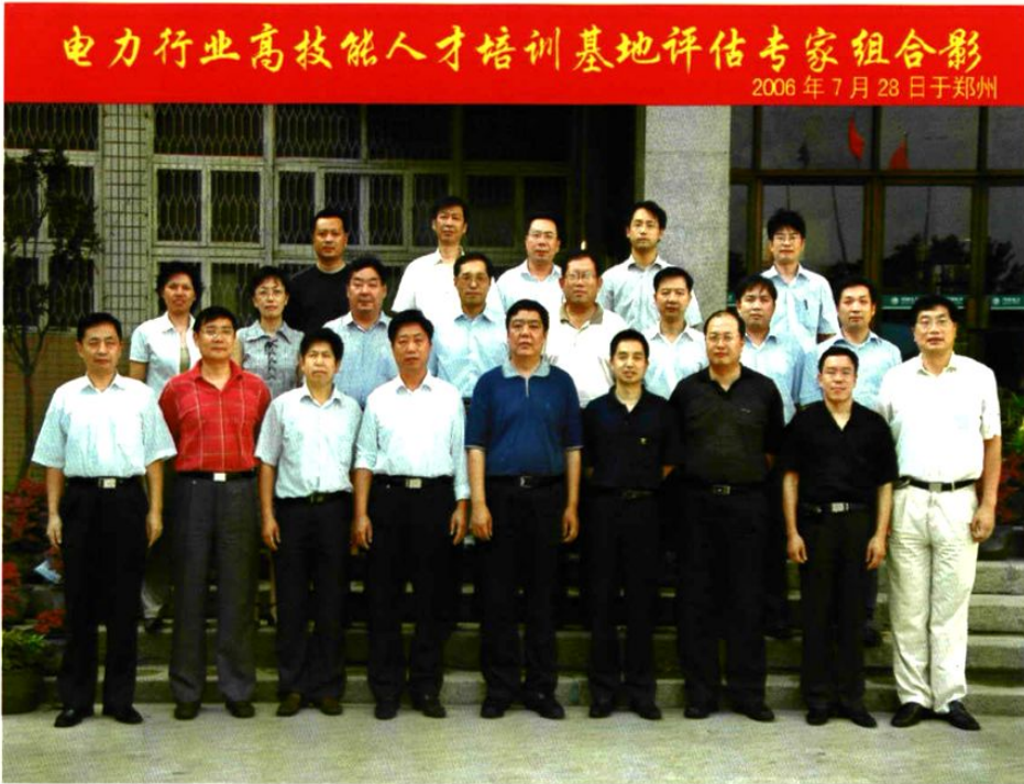
电力行业高技能人才培训基地评估专家来校指导工作