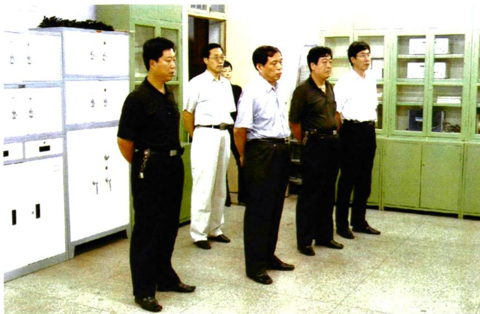
省劳动厅副厅长董胜勤(右三)来校视察培训基地