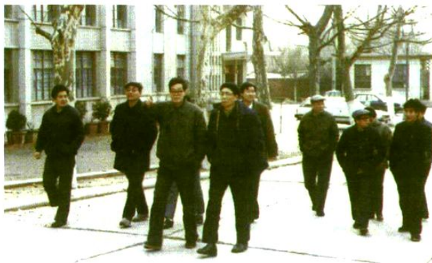
原能源部教育司司长许英才视察我校