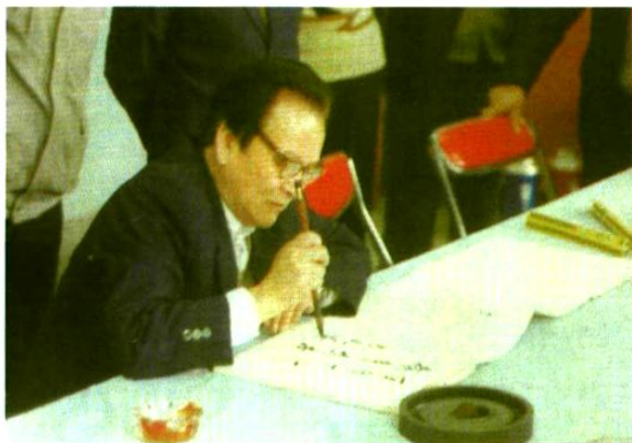
原电力部副部长,中国电力企业联合会理事长张风祥为学校 题词:“百年大计,教育为本”。