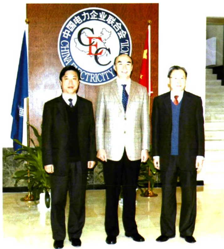
苏国政校长与中国电力企业联合会理事长赵希正(中)在一起