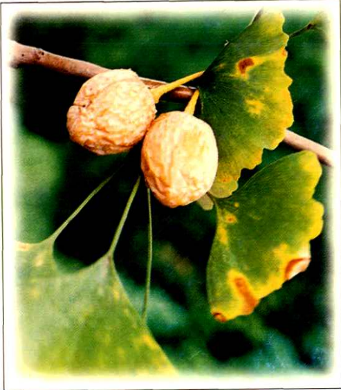
1. 银杏 Ginkgo biloba L. (p.8)