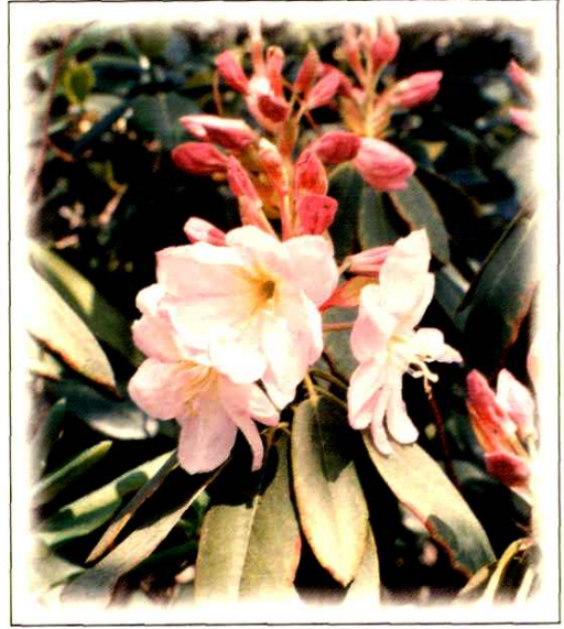
10. 云锦杜鹃 Rhododendron fortunei Lindl. (p. 120)