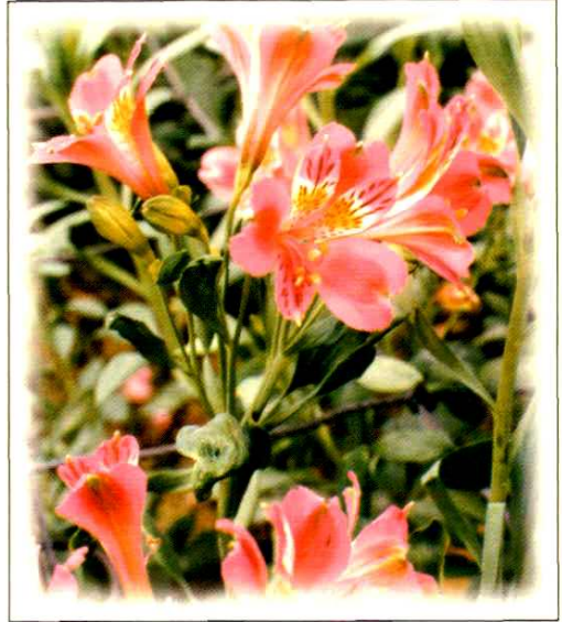
18. 六出花 Alstroemeria aurea Graham (p. 175)