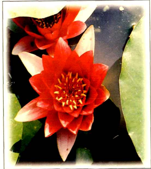
4. 红睡莲 Nymphaea alba L. var. rubra Lönnr. (p. 51)