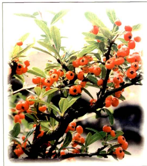
8. 火棘 Pyracantha fortuneana (Maxim.) Li (p. 71)