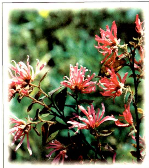
7. 红花 檵木 Loropetalum chinense (R. Br.) Oliver var. rubrum Yich (p. 60)