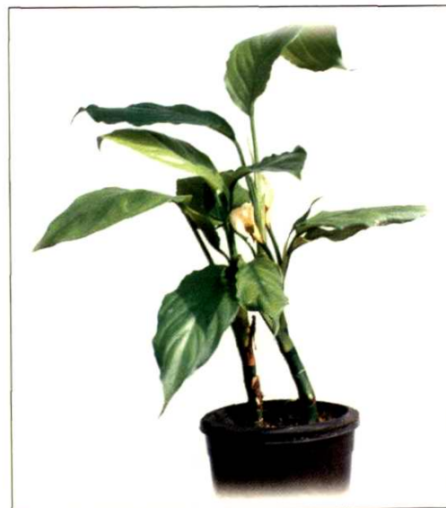
24. 广东万年青 Aglaonema modestum Schott ex Engl. (p. 192)