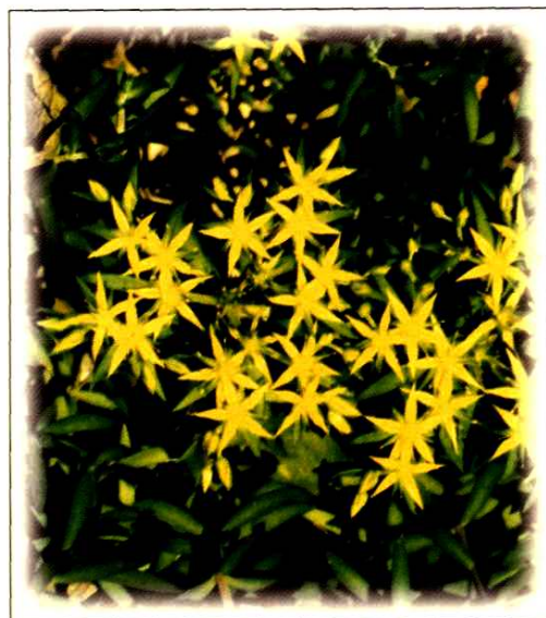
28. 狭叶垂盆草 Sedum angustifolium Z. B. Hu et X. L. Huang (p. 240)