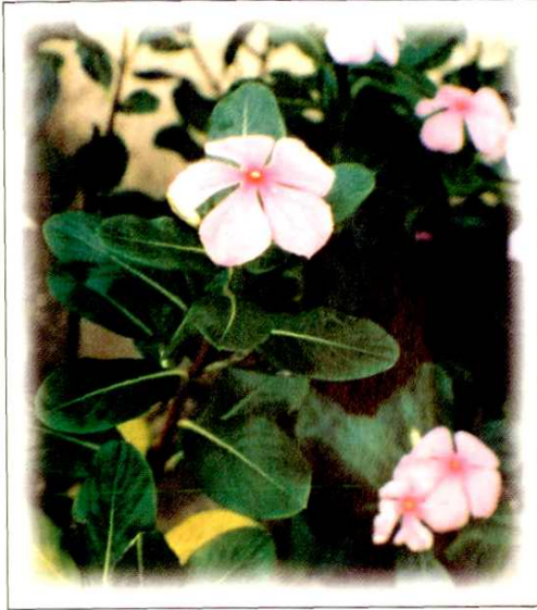
13. 长春花 Catharanthus roseus (L.) G. Don (p. 128)