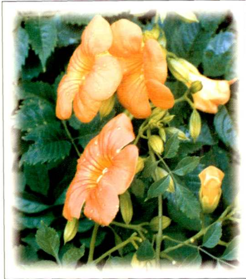
15. 凌霄 Campsis grandiflora (Thunb.) K. Schum. (p.145)