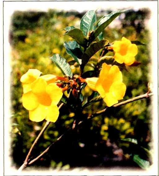
12. 黄蝉 Allamanda schottii Pohl (p. 128)