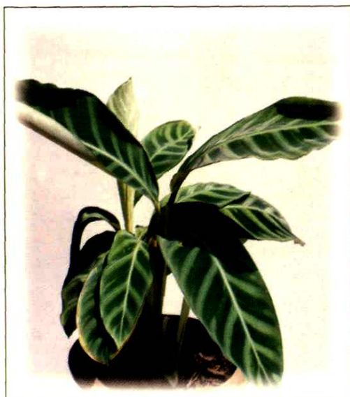
26. 绒叶肖竹芋 Calathea zebrina (Sims) Lindl. (p. 200)