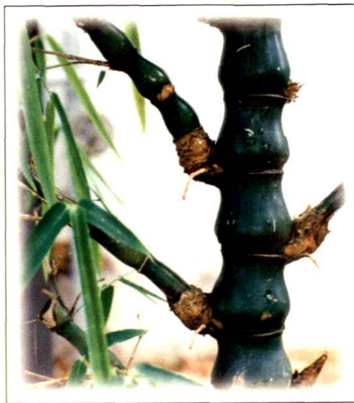
22. 佛肚竹 Bambusa ventricosa McClure (p. 184)