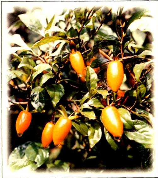
11. 老鸦柿 Diospyros rhombifolia Hemsl. (p. 123)