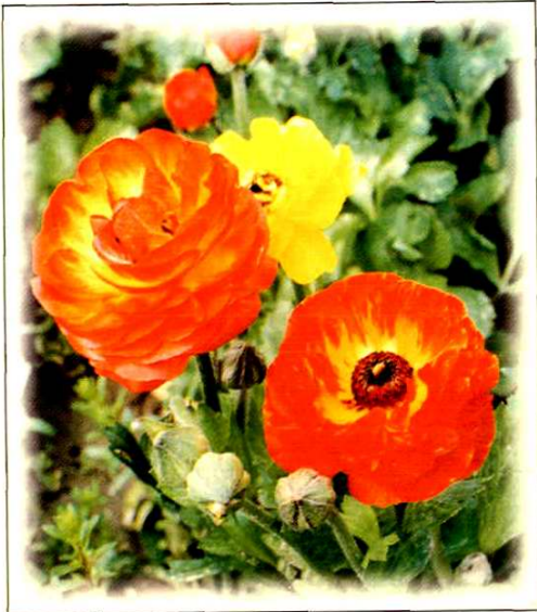
3. 花毛茛 Ranunculus asiaticus L. (p. 48)