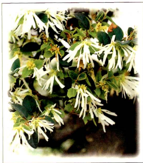
6. 檵木 Loropetalum chinense (R. Br.) Oliver (p. 60)