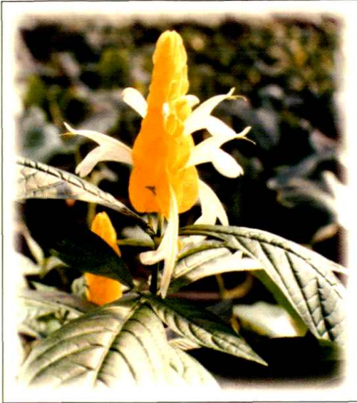
17. 金苞爵床 Pachystachys lutea Nees (p. 148)