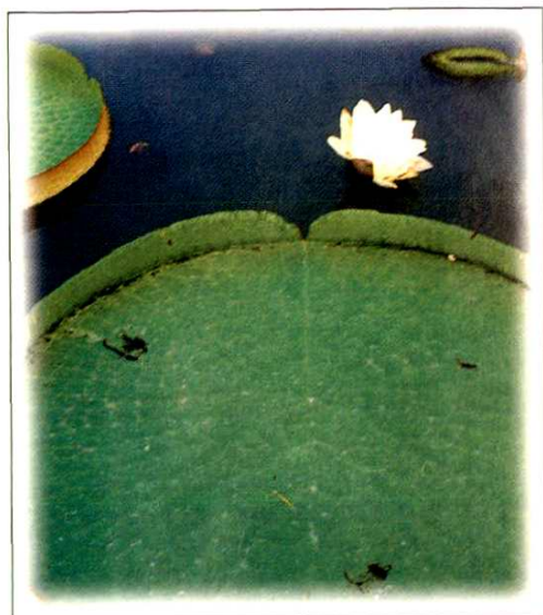
5. 王莲 Victoria amazonica Sowerby (p.51)