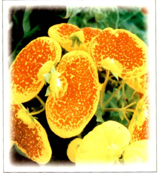
14. 荷包花 Calceolaria crenatiflora Cav. (p. 143)