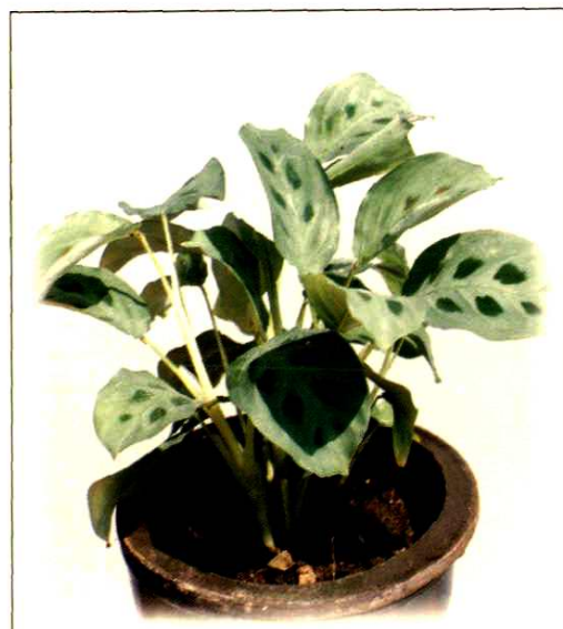
27. 豹斑竹芋 Maranta leuconeura E. Morr. cv. Kerchoviana (p.200)