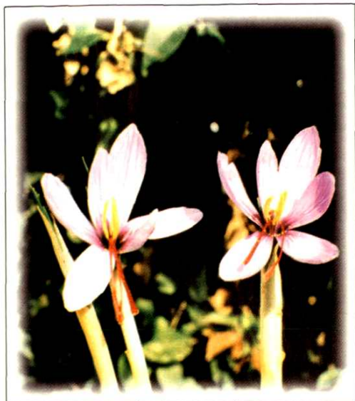
21. 番红花 Crocus sativus L. (p. 179)