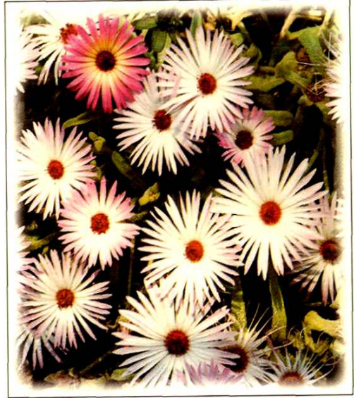
2. 冰花 Mesembryanthemum crystallinum L. (p. 32)