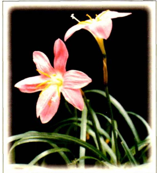
20. 韭莲 Zephyranthes grandiflora Lindl. (p. 178)