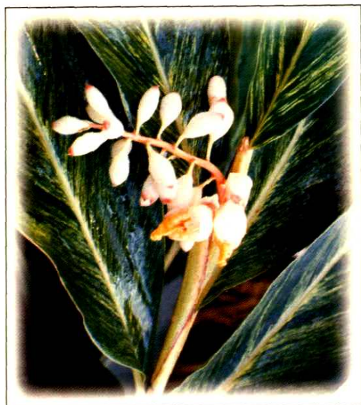
25. 花叶姜 Alpinia zerumbet (Pers.) B.L. Burtt et R. M. Sm. cv. Variegata (p. 200)