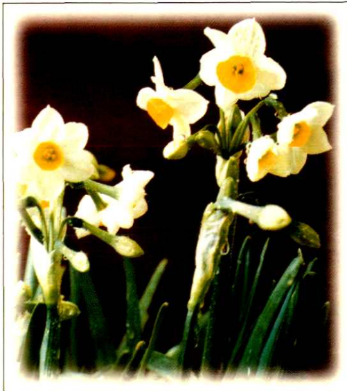
19. 东方水仙 Narcissus tazetta L. var. orientalis (L.) Hort. (p. 177)