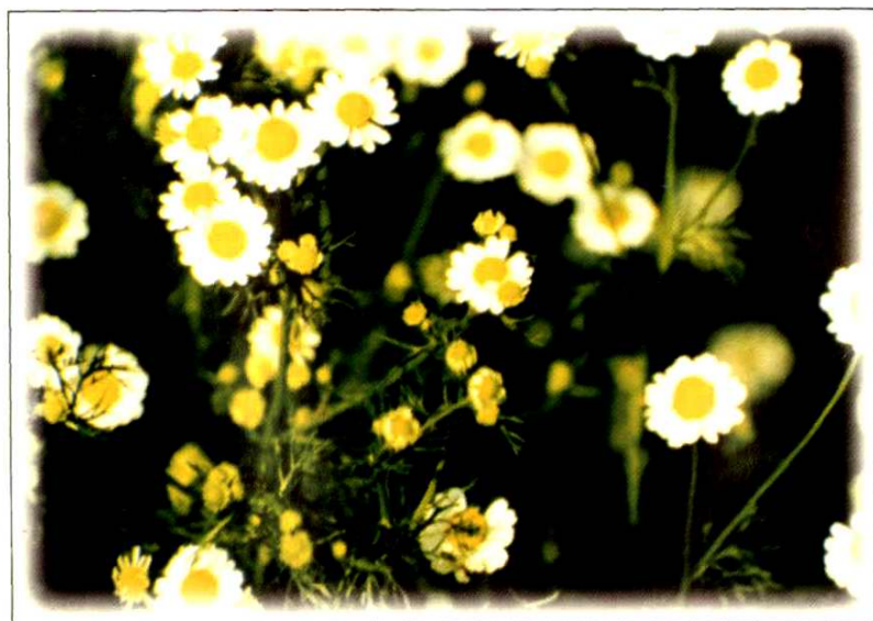
30. 母 菊 Matricaria recutita L. (p. 317)