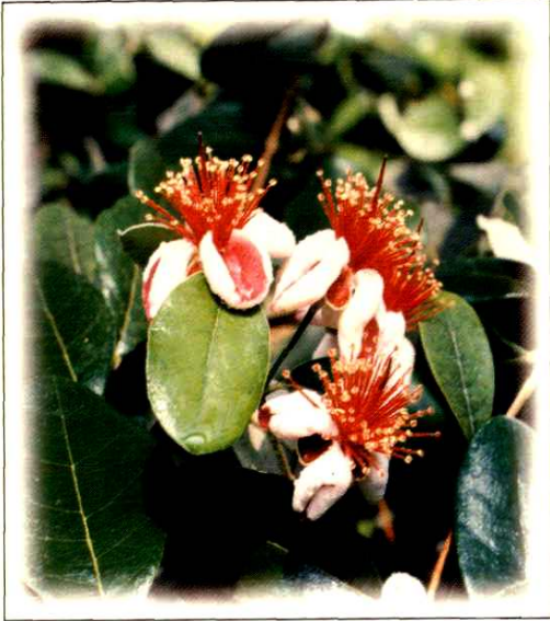
9. 南美稔 Feijoa sellowiana O. Berg. (p. 114)