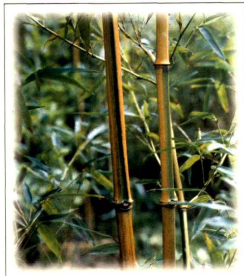
23. 金镶玉竹 Phyllostachys aureosulcata McClure f. spectabilis C. D. Chu et C. S. Chao (p. 185)