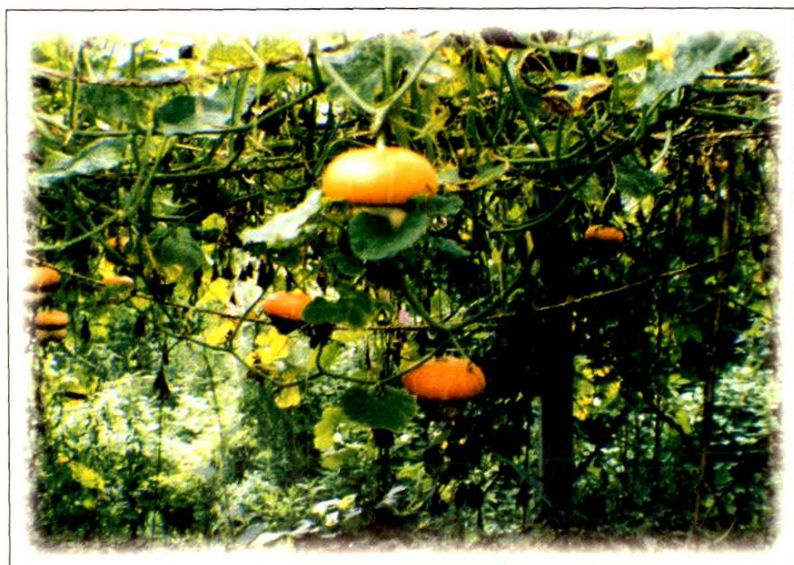
29. 北 瓜 Cucurbita maxima Duch. cv. Turbaniformis (p. 269)