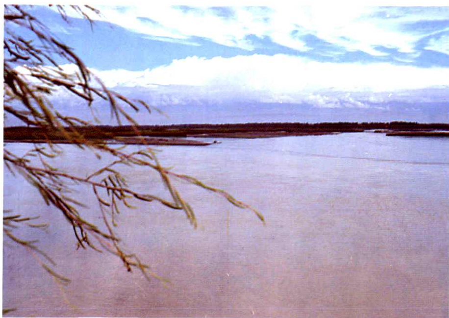
旖旎的阿克苏河风光