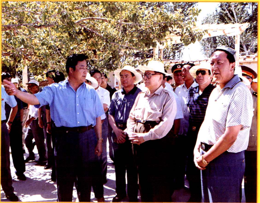
1998年7月5日中共中央总书记江泽民在自治区党委书记王乐泉陪同下视察喀拉塔勒镇，听取阿克苏市领导汇报工作。