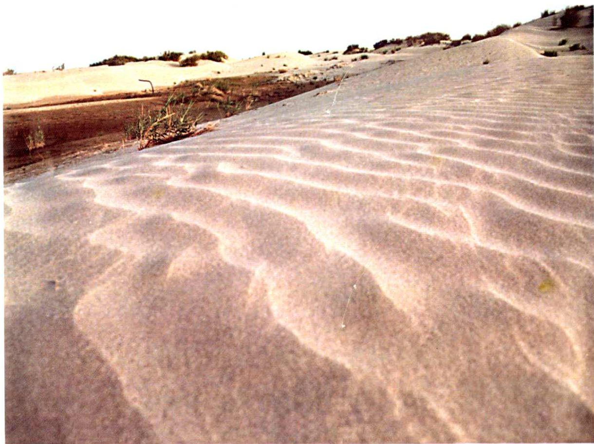
绿洲边缘上的沙丘