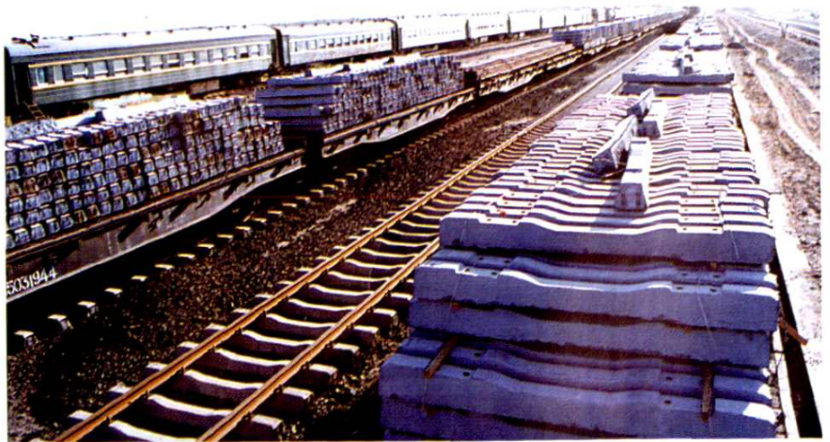
建设中的阿克苏火车站工地