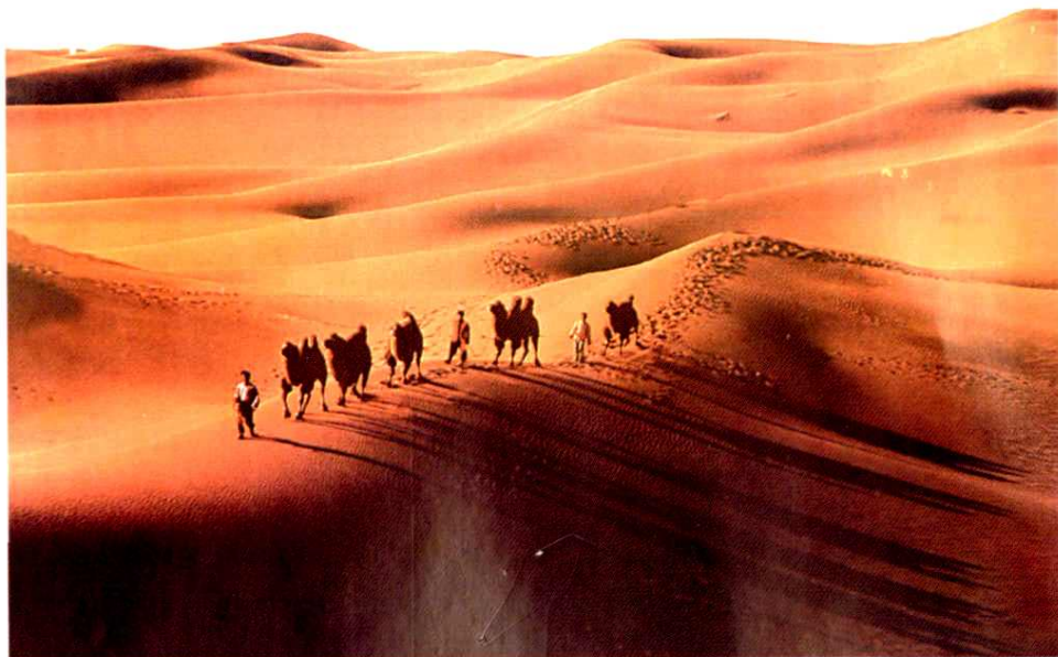
夕阳下的塔克 拉玛干大沙漠