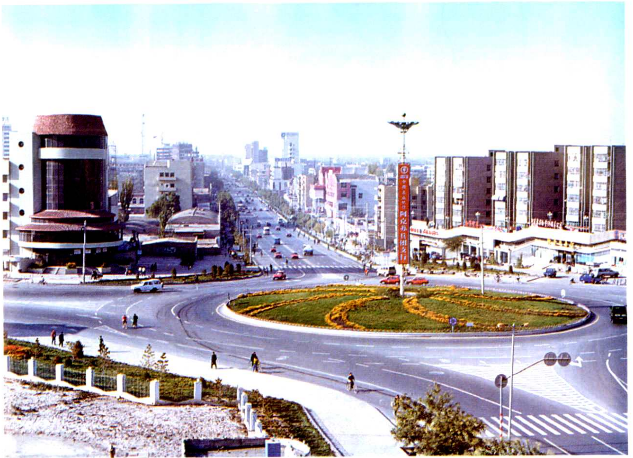
阿克苏市城区建设新貌