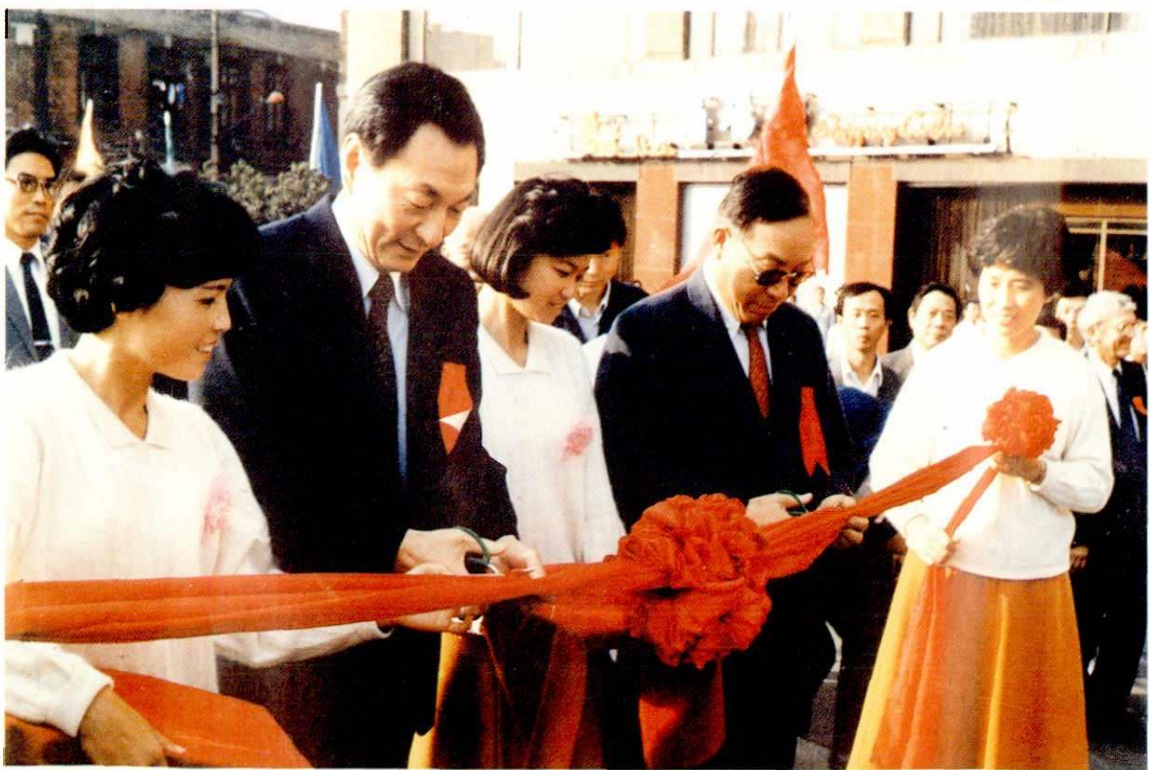
1. 1987年国务院总理李鹏视察中科院上海技术物理研究所“风云一号”气象卫星甚高分辨率扫描辐射计