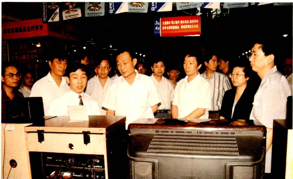
1. 1994年12月19日国务院副总理李岚清视察三角地总公司密云超市 2. 1994年6月18日中共上海市委书记吴邦国视察远东电器商厦