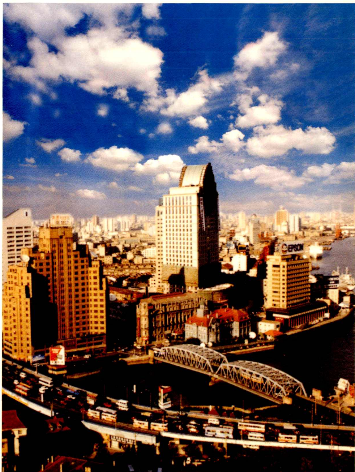
外白渡桥和吴淞路闸桥跨入虹口区境北外滩(1998年摄)