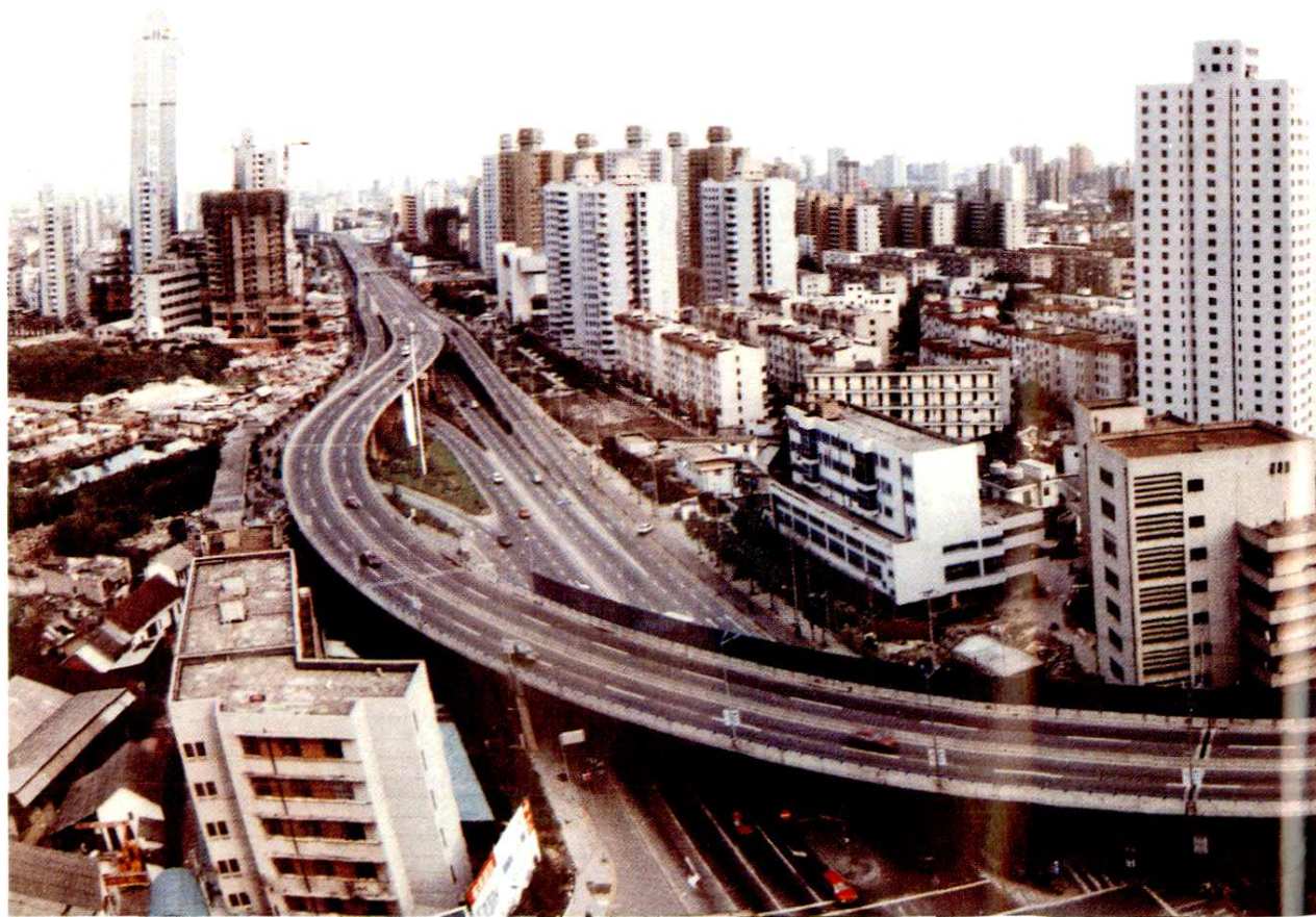
1. 俯瞰虹口区境（一）北外滩和沿苏州河建筑群（1997年摄）