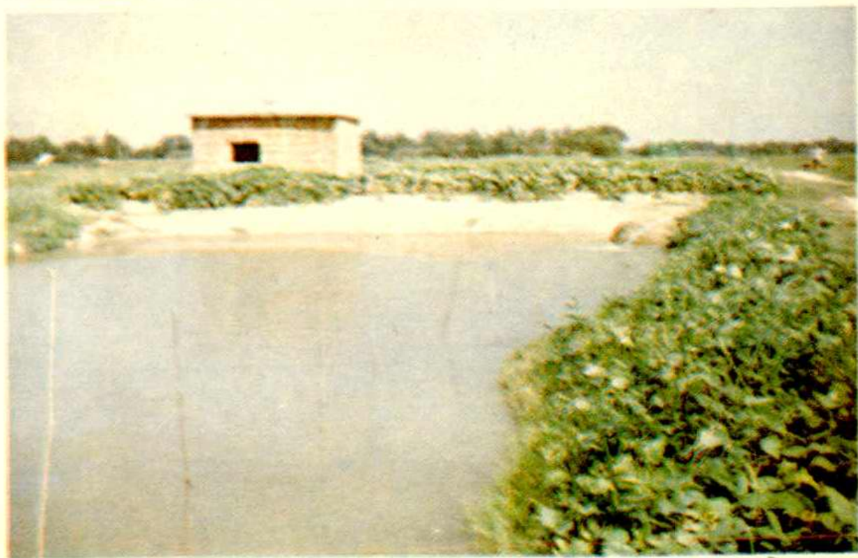
▽ 与蓄水池配套的电力机械提水井。