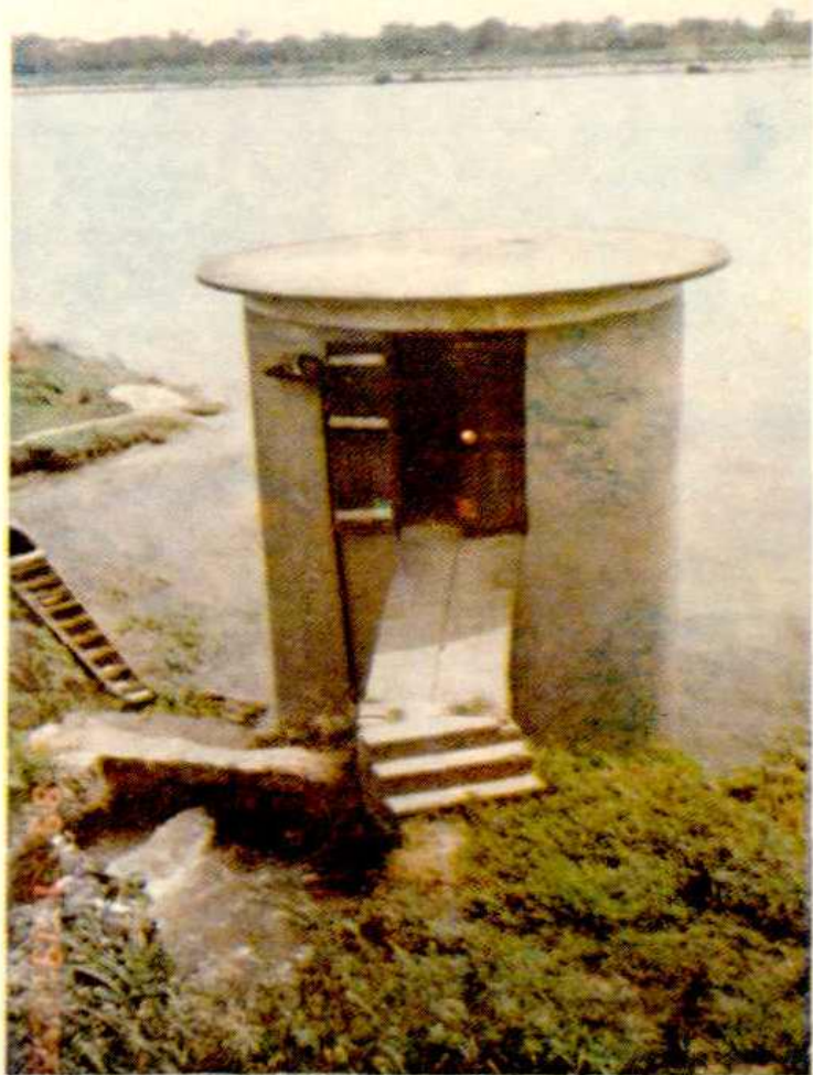
△五五旺的沙河机埠