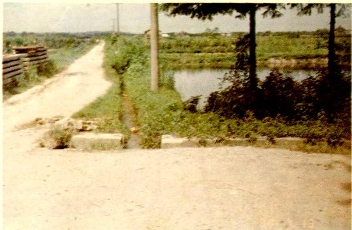
△ 黄泥湖垸简易运菜公路