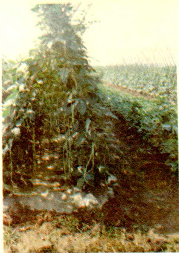
◁ 地膜覆盖栽培促进了夏菜的早熟高产