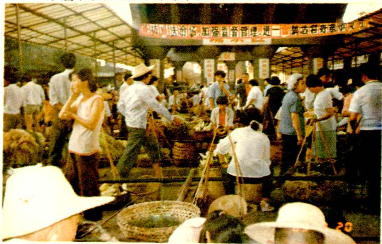
▽ 蔬菜市场放开后新建的大型蔬菜集贸市场一角