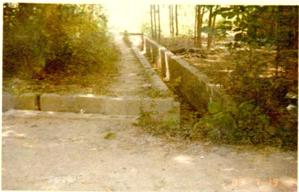
△ 蔬菜基地混凝土砌块排灌渠道