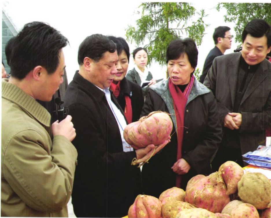
2008年3月,贵州省人大常委会副主任唐世礼(前右二)、贵州省人民政府副省长禄智明(左二)在铜仁市贵州华力农化工程有限公司听取董事长胡秋云(左一)介绍铜仁红薯生产及系列产品加工情况。