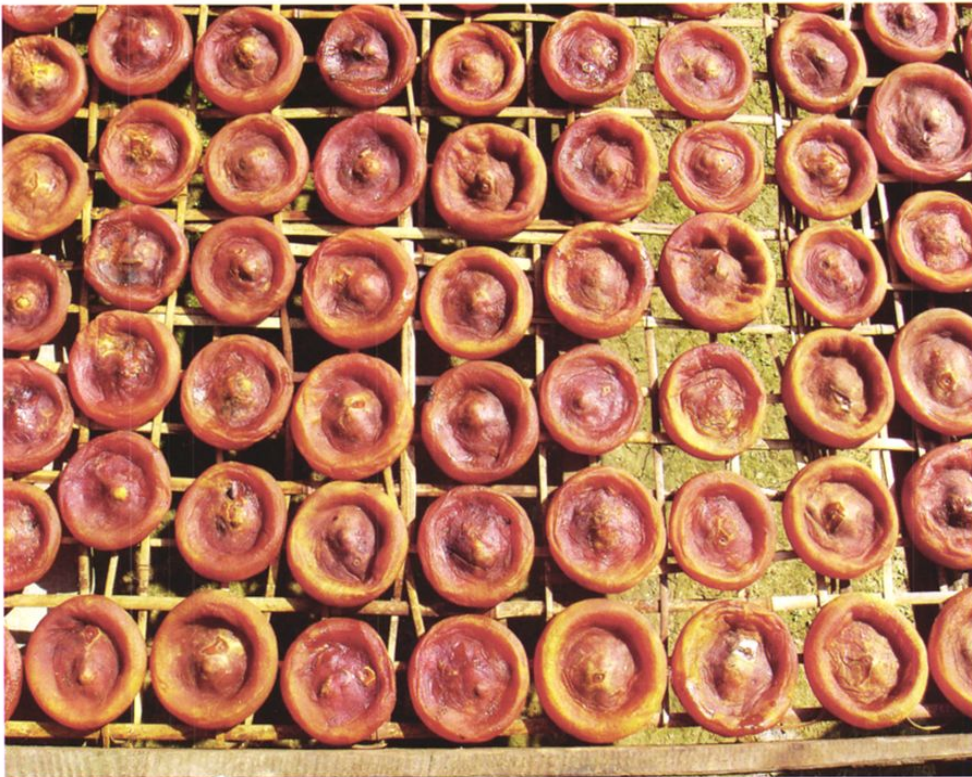
玉屏无核橘柿柿饼