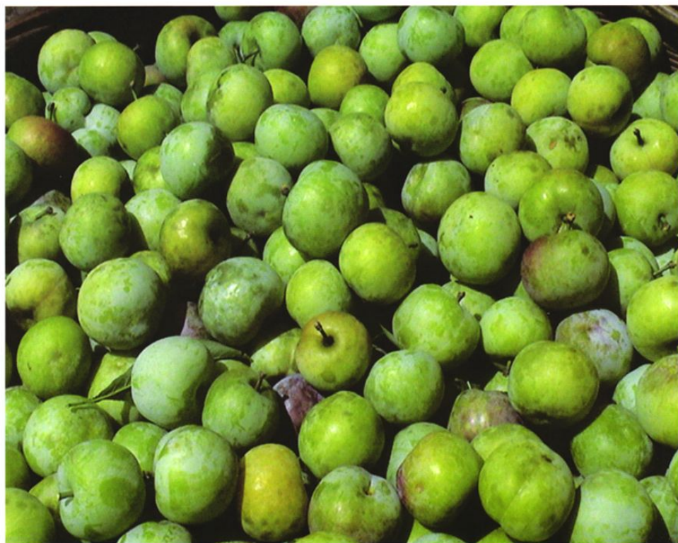
国家地理标志保护产品——沿河沙子空心李