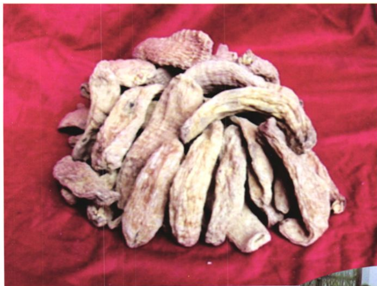
铜仁地区特色农产品——天麻