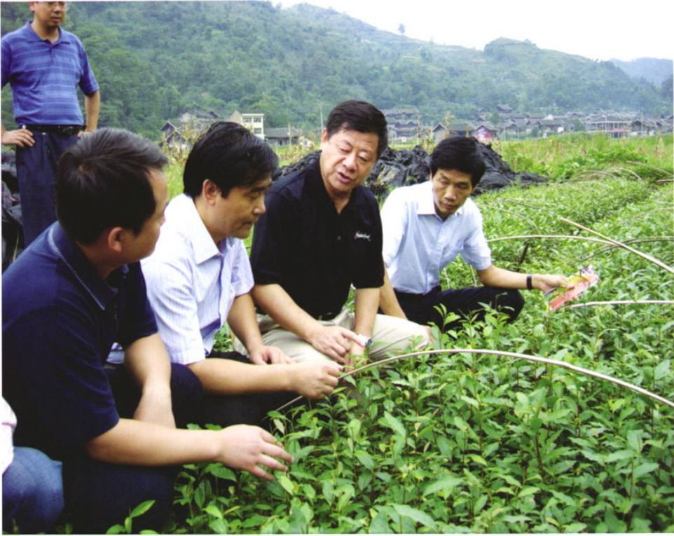
2008年9月,贵州省委书记王富玉(右二)在铜仁地委副书记、行署专员李再勇(右一)陪同下到石阡县调研生态茶产业发展情况。