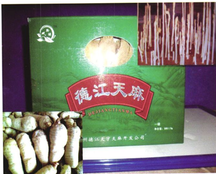
国家地理标志保护产品——德江天麻