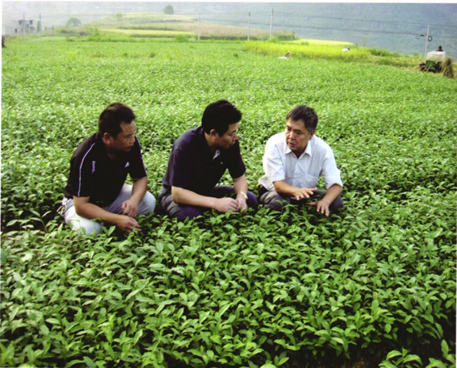
2008年9月,铜仁地委书记廖国勋(中)在铜仁地区农业局副局长、地区茶办副主任罗兴体(右一)陪同下到德江县茶树无性系良种育苗点查看茶苗生长情况。