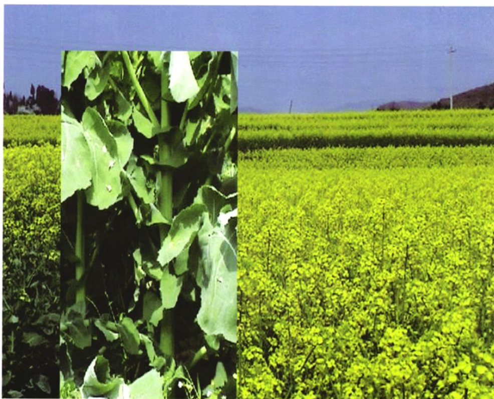
铜仁地区优势农作物——“双低”优质油菜