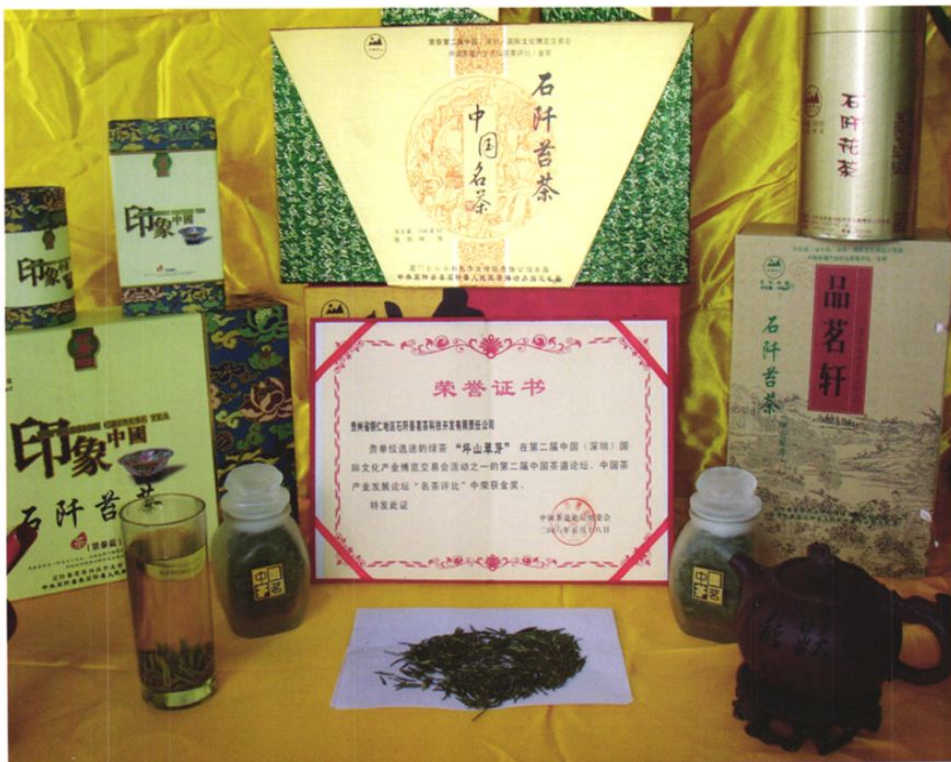
铜仁地区茶叶生产历史悠久。在历史长河中，产生了多个各具特点的地方历史名茶。图为历史上曾作为“贡茶”的中国名茶——贵州十大名茶——石阡普茶。