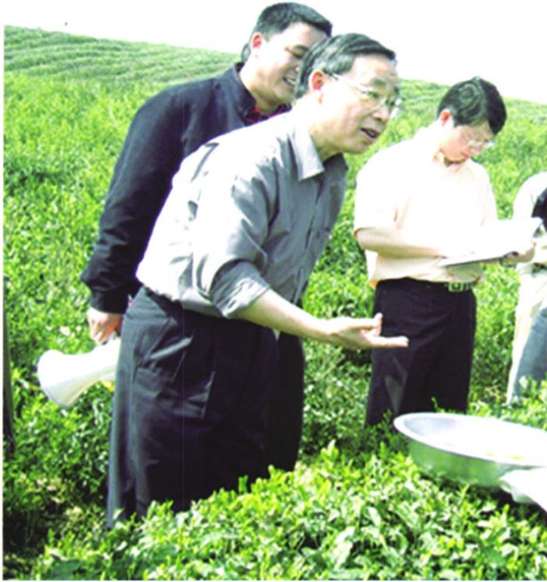
2008年4月18日,铜仁地区遭遇罕见雪凝灾害后,贵州省委书记、省长林树森(前中)到印江县调研茶树受灾及生产恢复情况。