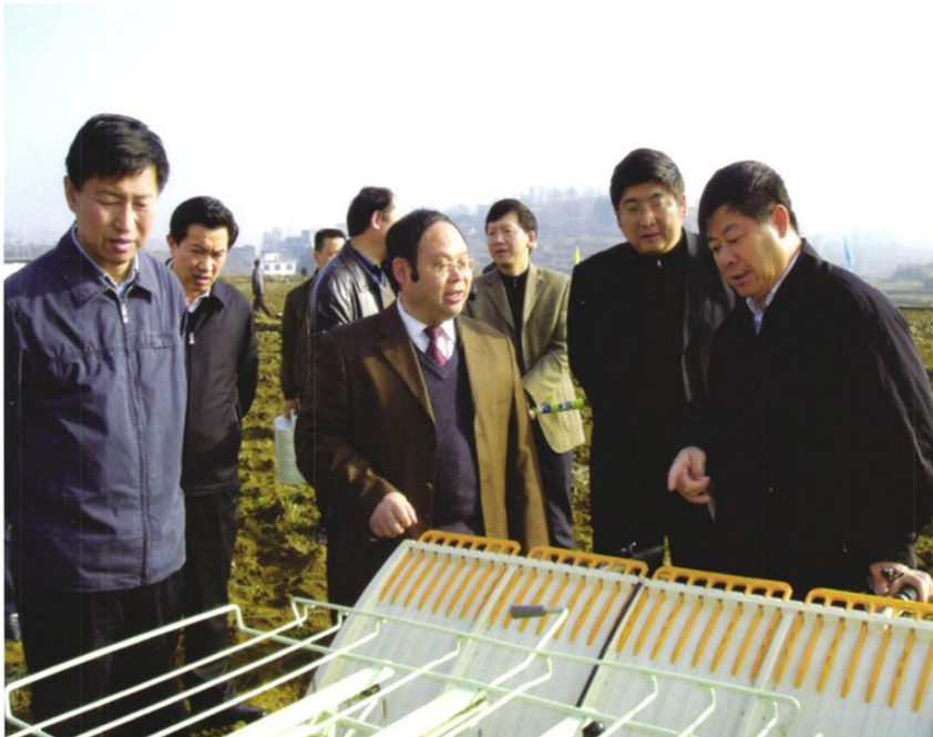
2008年3月,贵州省委书记王富玉(右一)在铜仁地委书记杨玉学(左一)、副书记龙德文(左二)陪同下到松桃自治县大兴镇星光村调研农业机械推广应用情况。