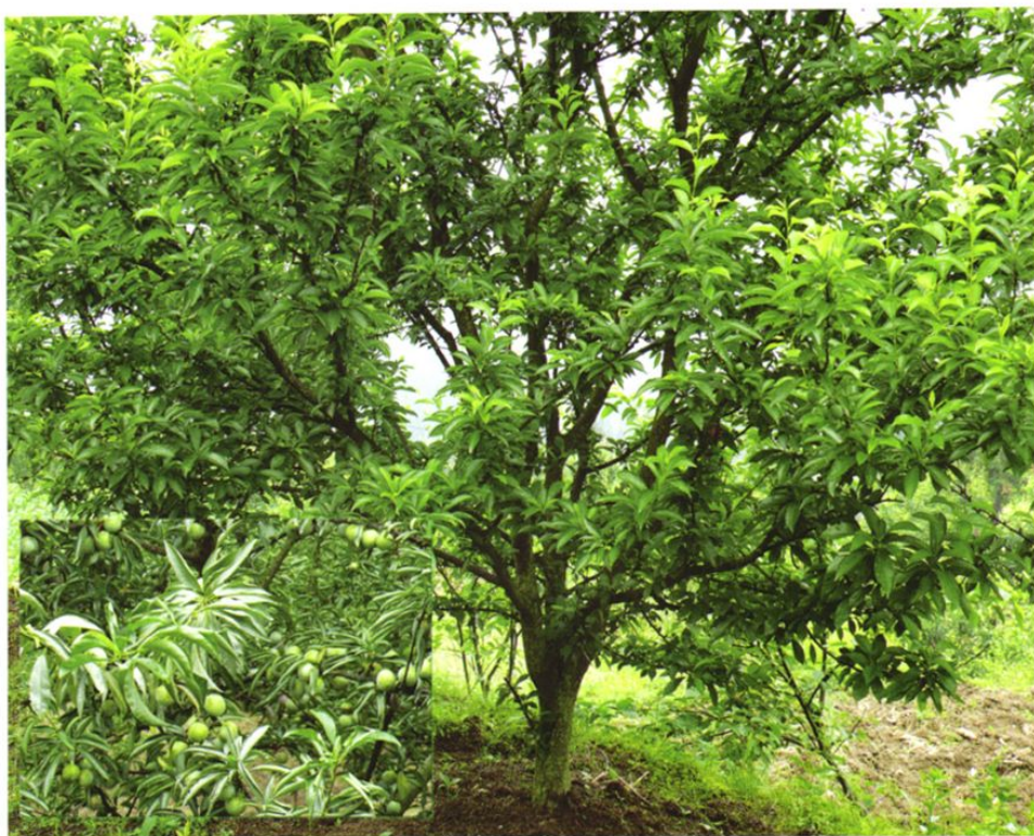
沿河县沙子空心李挂果树