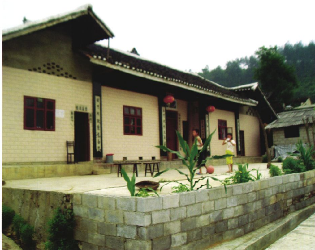
上图为解放初期铜仁市农村农民的住房,下图为2008年铜仁市农村农民的住房。彰显了解放后,特别是改革开放以后,铜仁地区农村面貌发生的翻天覆地变化,农民群众生活水平得到了飞跃提高。