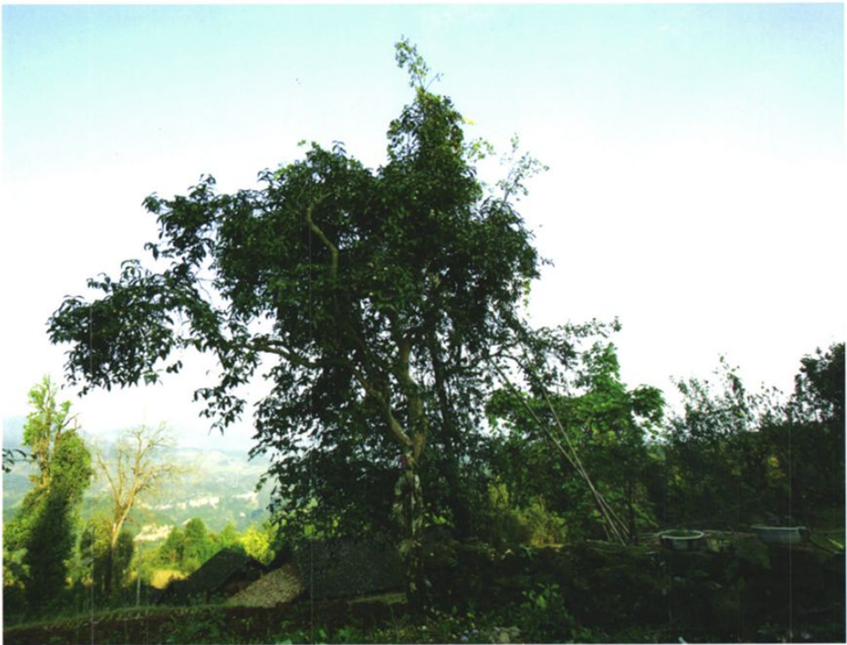
铜仁地区是茶叶的原产地之一。2006年4月18日，在沿河县塘坝乡榨子村发现了集中连片人工栽培的古茶树群。图为其中一株千年古茶树。