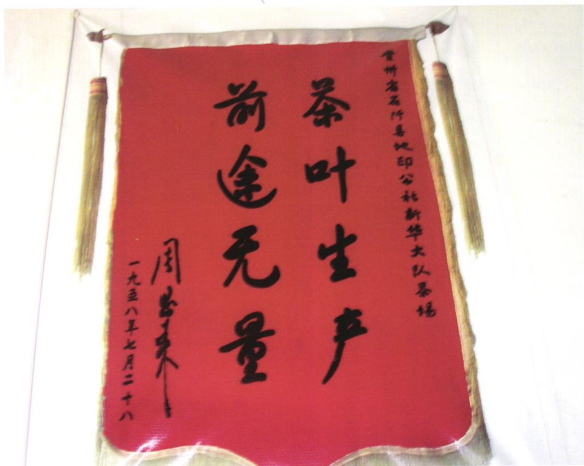
1958年7月,周恩来总理为石阡县地印公社新华大队茶场的题词。