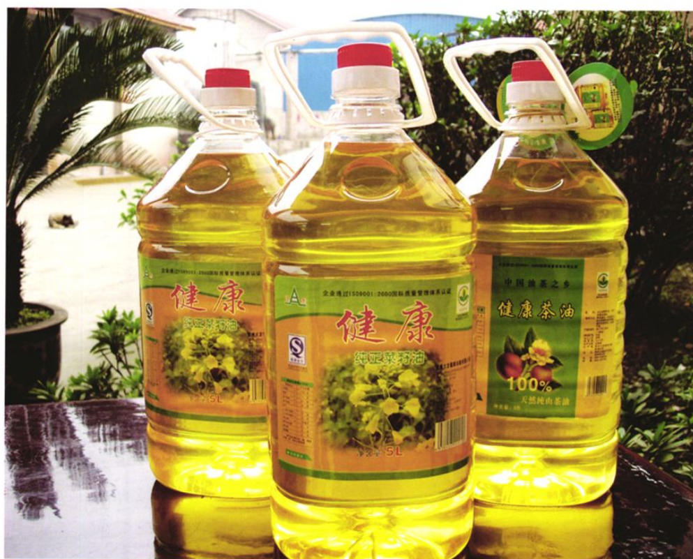
铜仁地区优质菜籽油和优质茶油