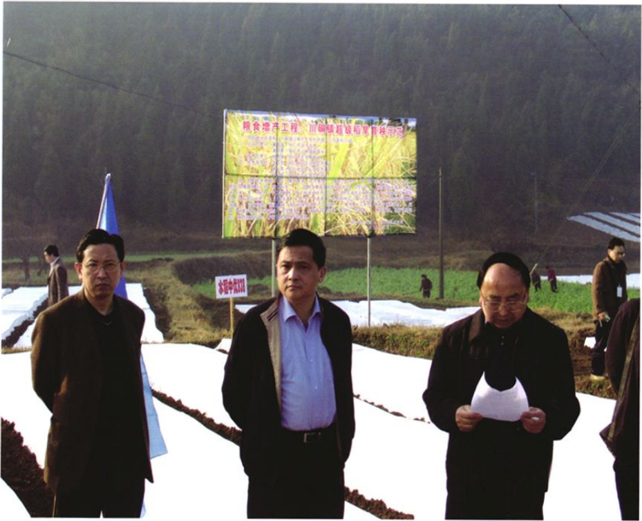
2008年3月,贵州省人民政府副秘书长刘福成(左一)、省农业厅厅长黄家培(中)、省人大铜仁地工委主任戴振华(右一)在铜仁市川铜镇检查粮食增产工程示范点兴办情况。