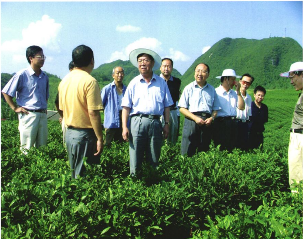
2004年1月2日,贵州省人大常委会副主任龚贤永(右七)在省人大铜仁地工委主任戴振华(右五)、铜仁行署副专员彭翔(右六)陪同下到印江银辉茶场调研。