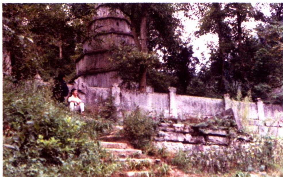
沙湾冉村和尚墓塔