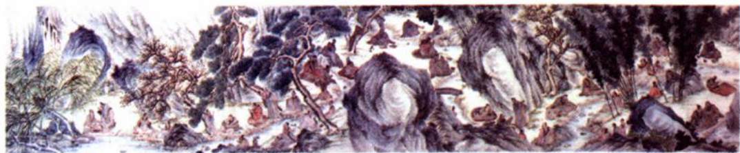
“兰亭真赏”图手卷局部（清）