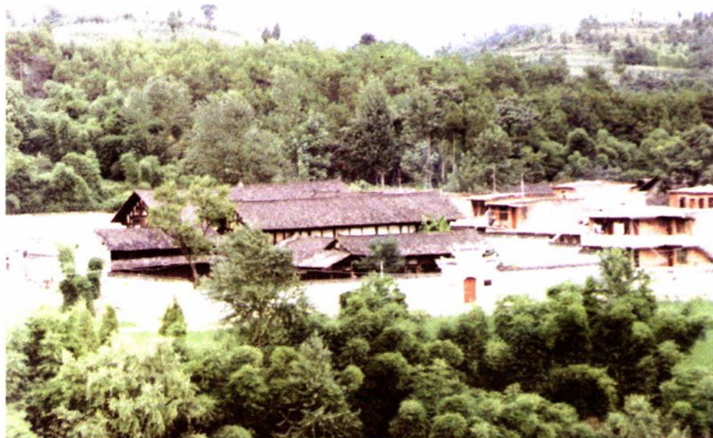
新舟沙滩黎庶昌故居