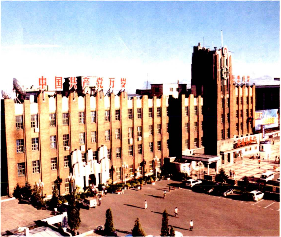
齐齐哈尔铁路分局办公楼