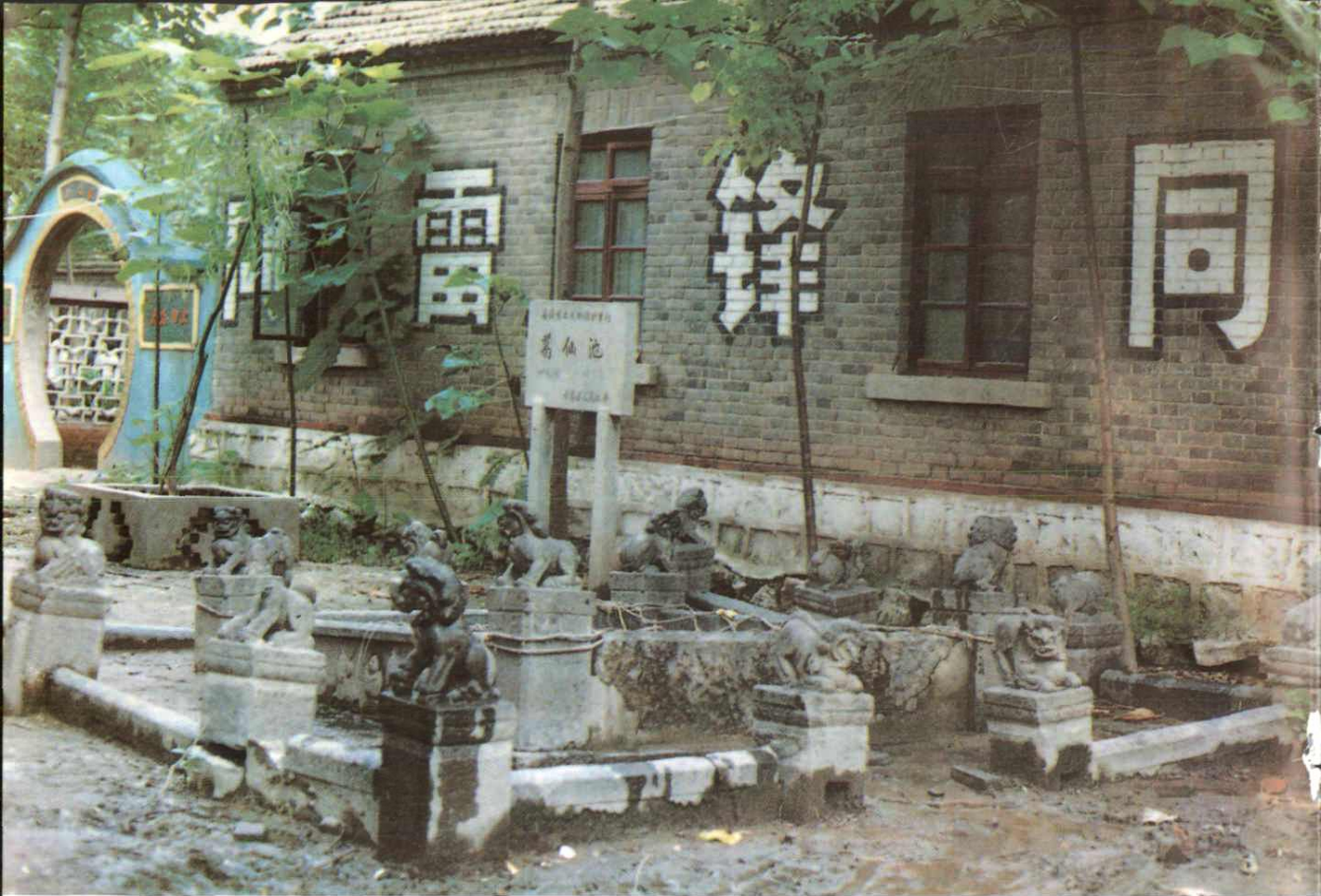
葛仙池 东魏敬史君碑碑亭