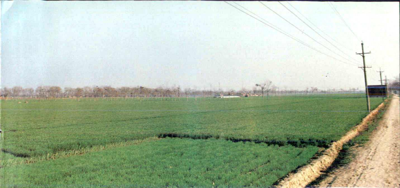
增福庙乡河涯刘 小麦千亩丰产方