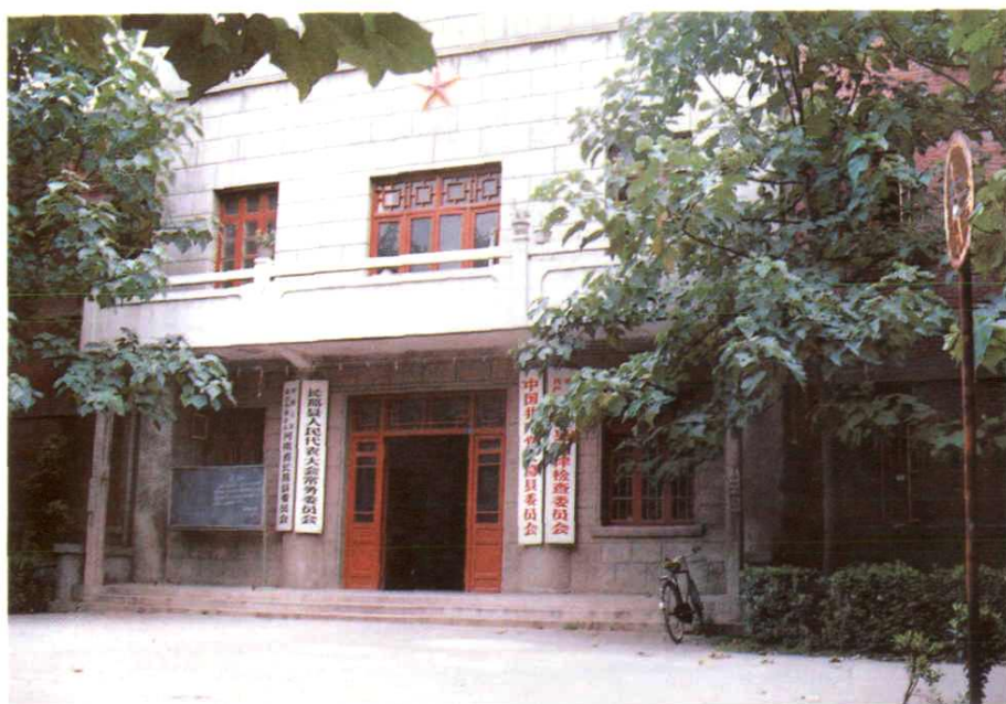
中共长葛县委办公楼