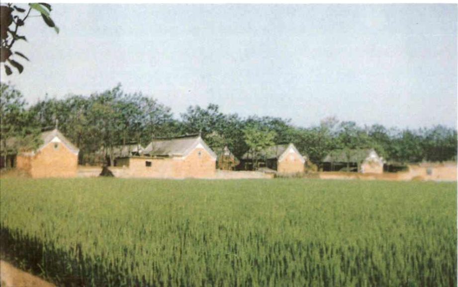
增福庙乡上坡 口新村