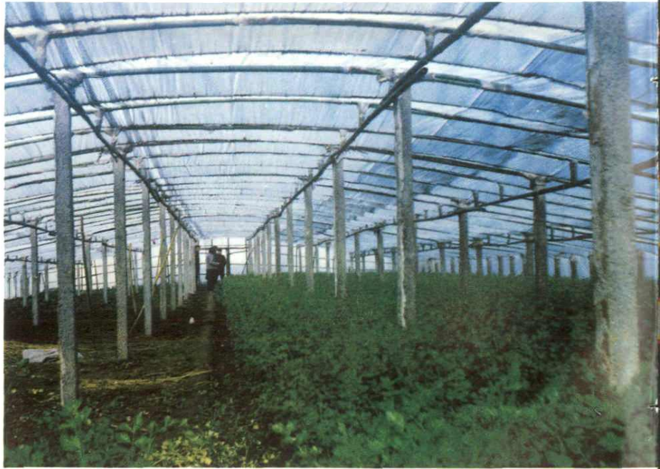
坡胡乡水磨河 塑料菜棚