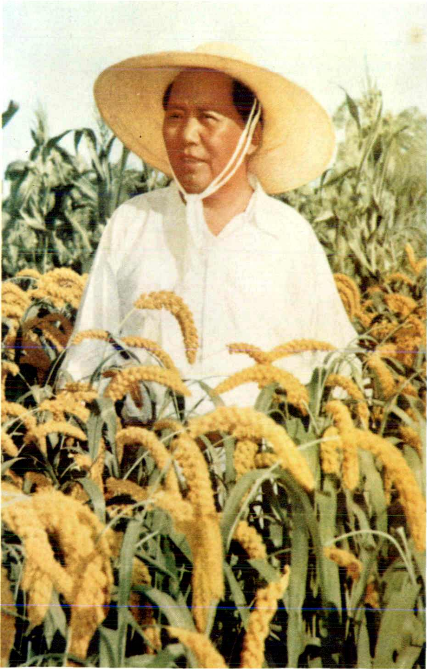
一九五八年八月七日毛泽东主席视察长葛