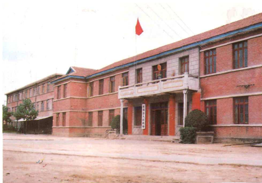
长葛县人民政府办公楼