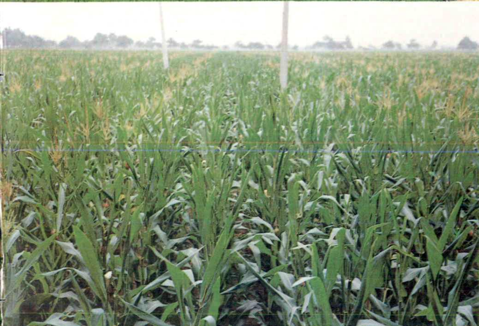
董村乡盆刘竖叶 玉米田