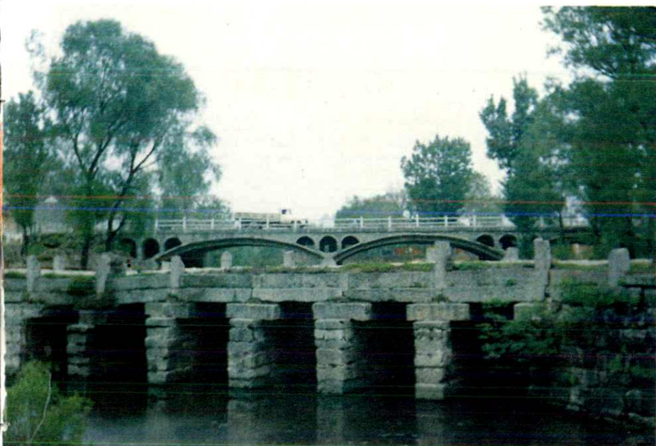
和尚桥及人民路桥