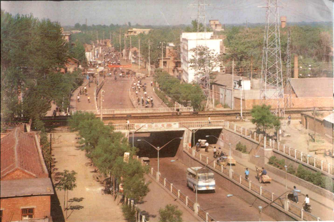
长社路立交桥 长社市场