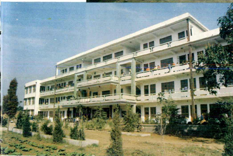
和尚桥镇八七学校