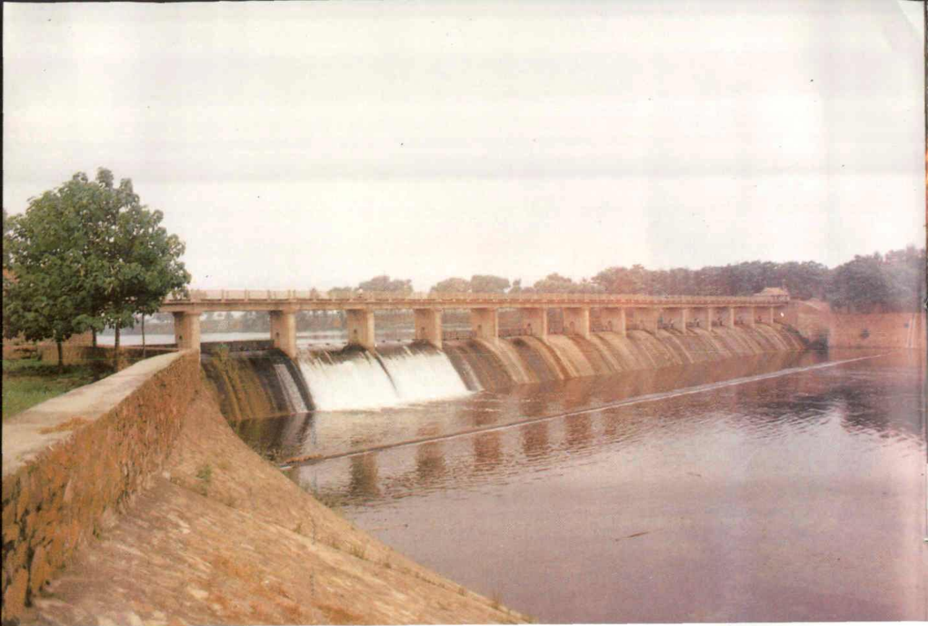
佛耳岗水库 西黄庄变电站