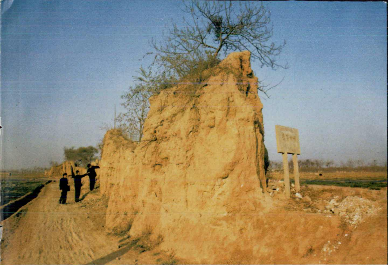
长葛故城 十二连城遗址