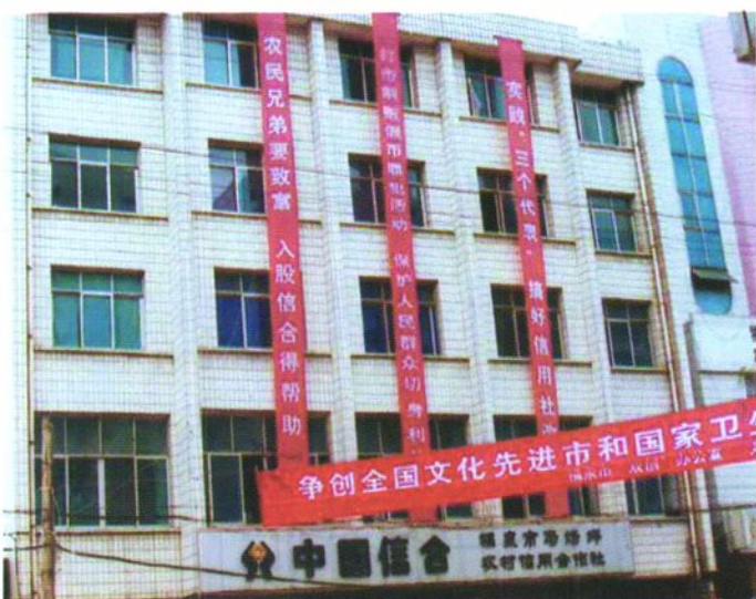
马场坪信用社办公楼