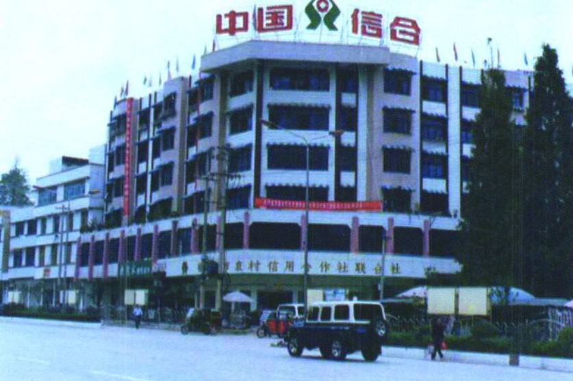
福泉市联社综合大楼