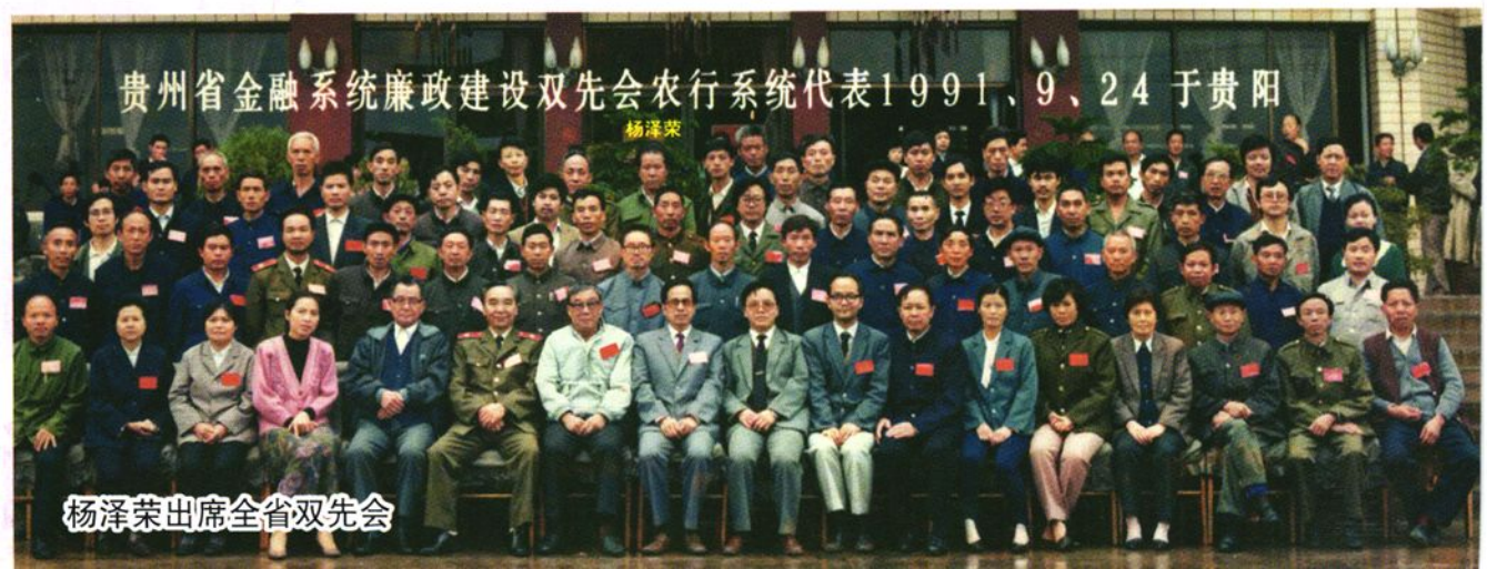
贵州省金融系统廉政建设双先会农行系统代表1991、9、24于贵阳