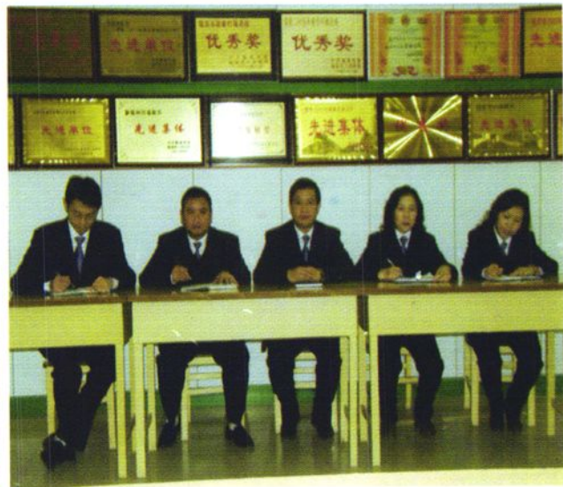
团结奋进的领导班子