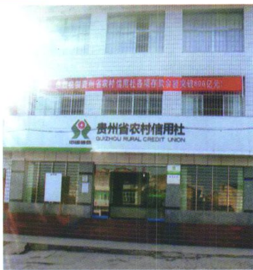
凤山信用社办公楼