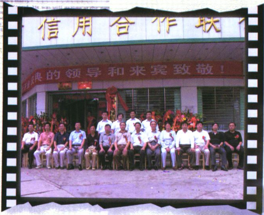
参加福泉联社挂牌庆典仪式领导合影