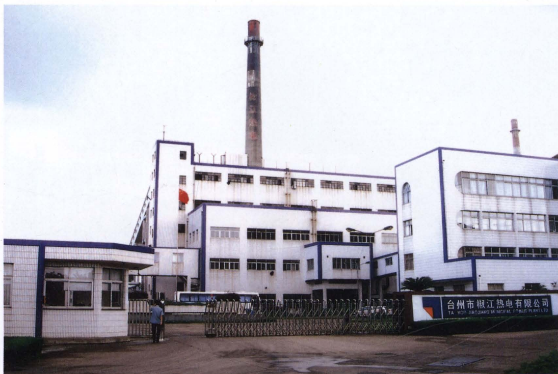
◇椒江热电有限公司