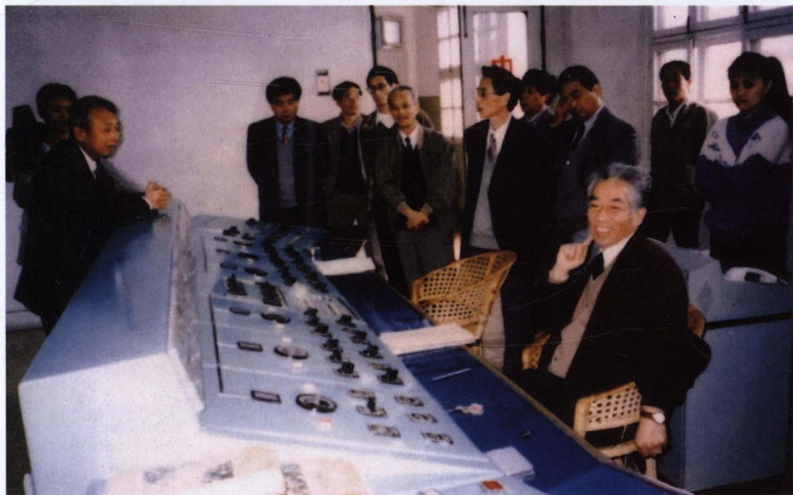
◇1996年11月16日,电力工业部副部长汪恕诚(坐者)视察江夏潮汐试验电站