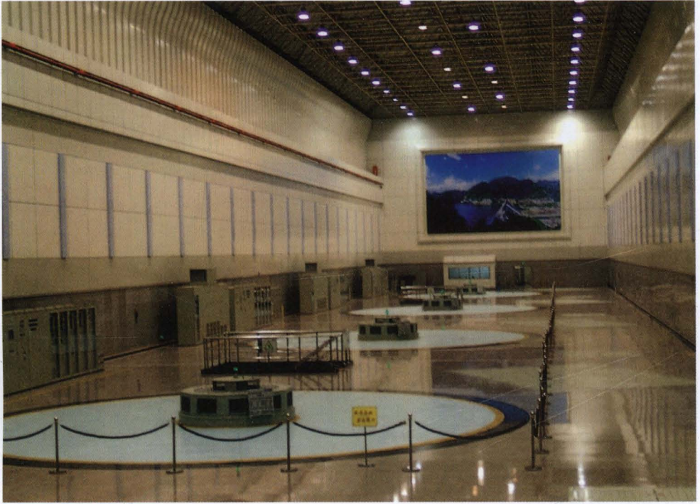
◇ 桐柏抽水蓄能电站发电机组