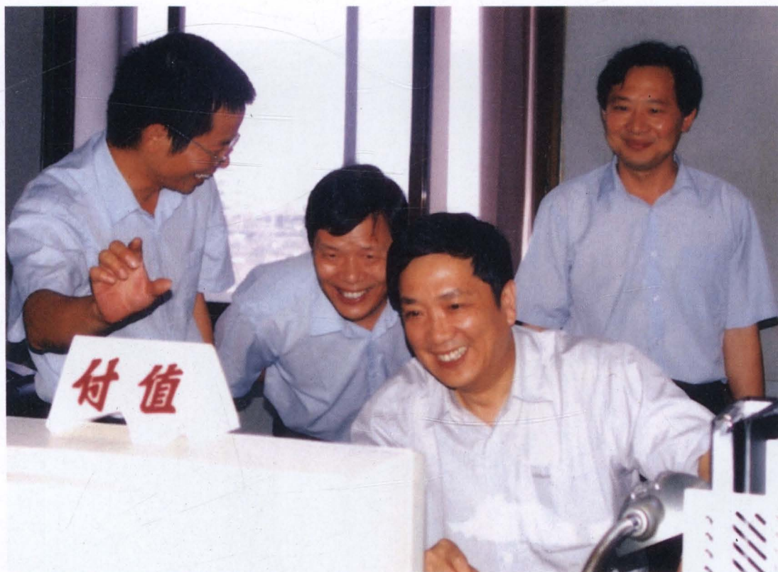
◇2004年8月,国家电网公司副总经理陆启洲(前排右一)到台州电业局考察电力工作