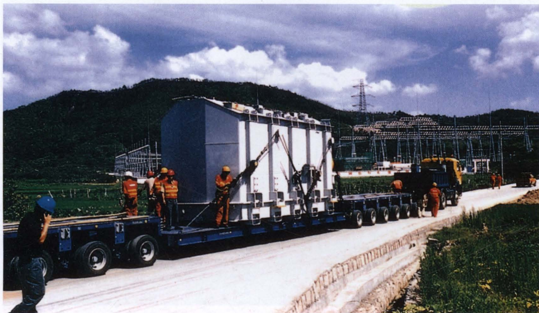
◇2004年9月6日,75万千伏·安变压器运抵500千伏塘岭变电所