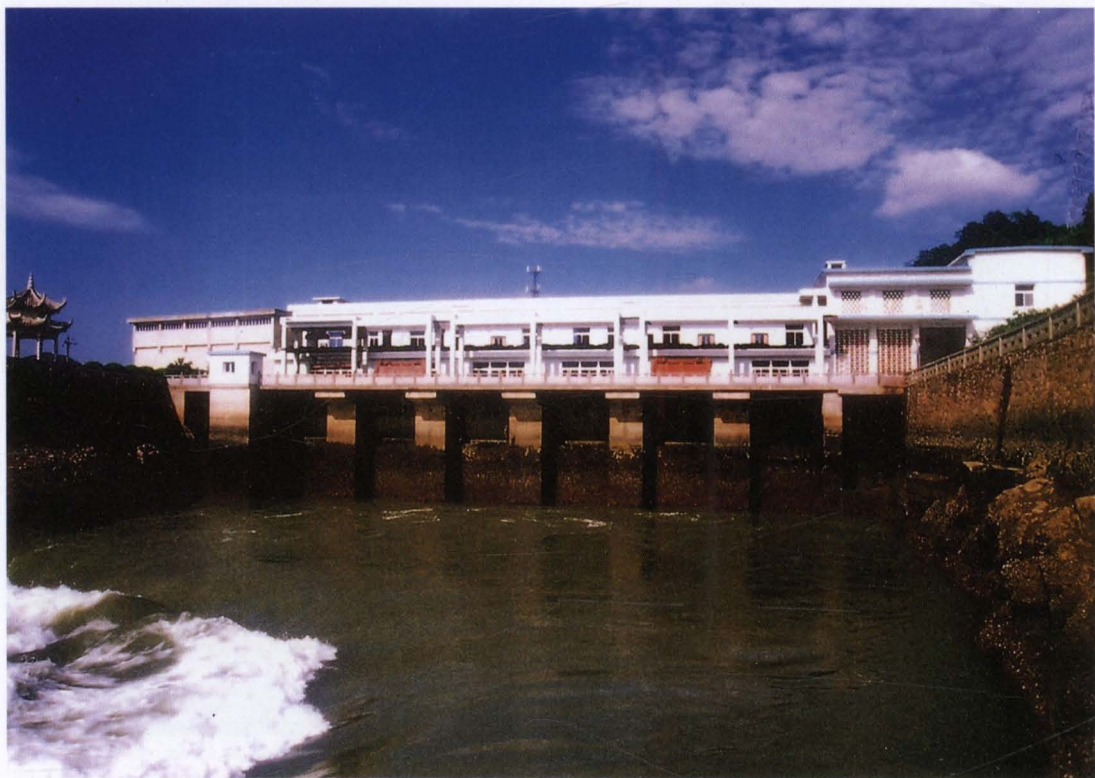
◇江夏潮汐试验电站厂房