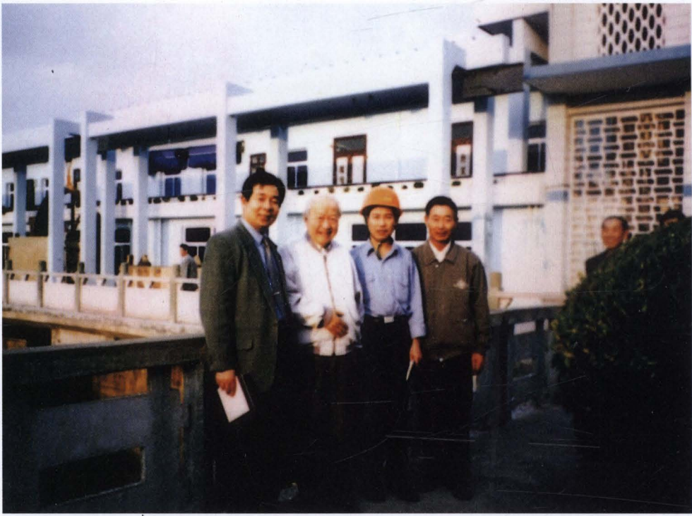
◇1998年11月6日,全国政协副主席钱伟长(左二)视察江夏潮汐试验电站