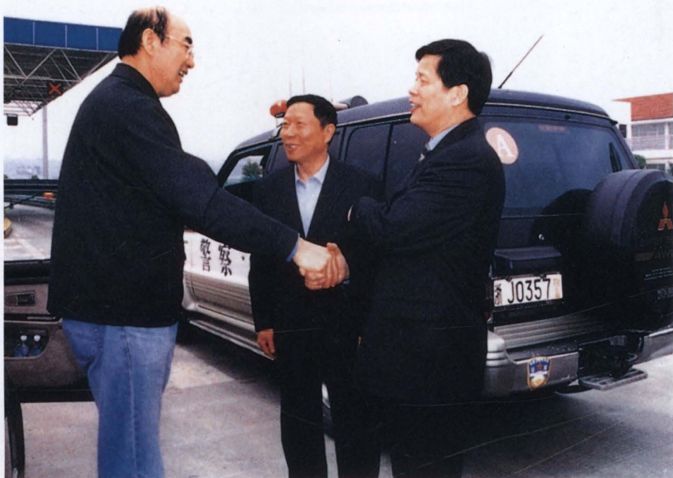
◇2004年4月,国家电网公司总经理赵希正(左一)视察台州电力建设