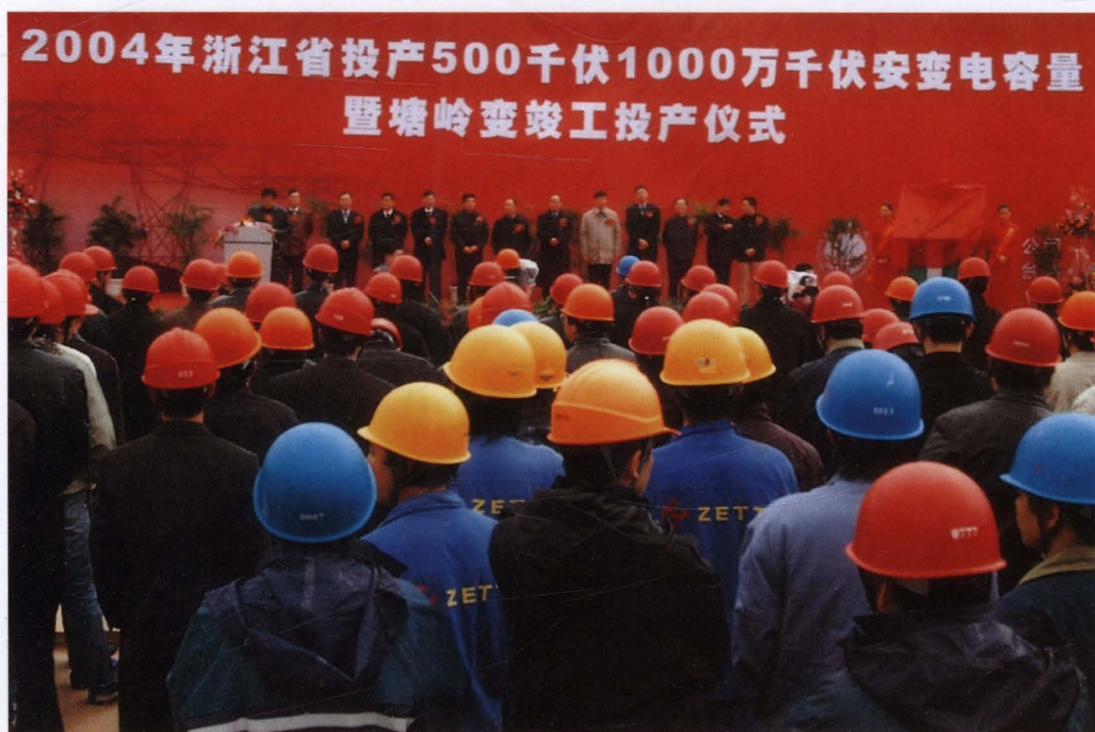
◇2004年12月26日,500千伏塘岭变电所竣工投产仪式