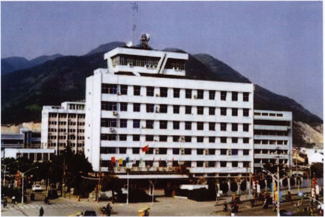
◇台州电力调度大楼