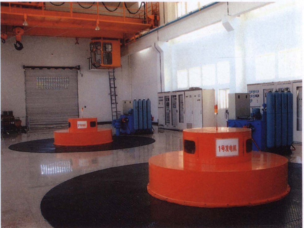
◇下岸水电站 1、2 号发电机组