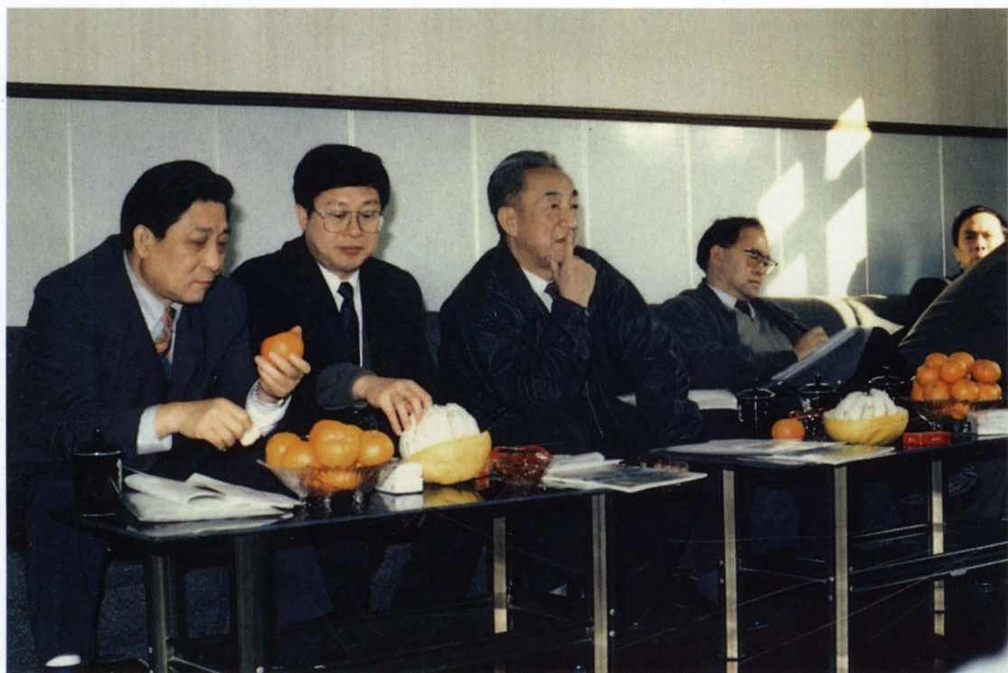
◇1994年12月5日,国务院副总理邹家华(左三)在浙江省副省长柴松岳(左一)陪同下视察江夏潮汐试验电站