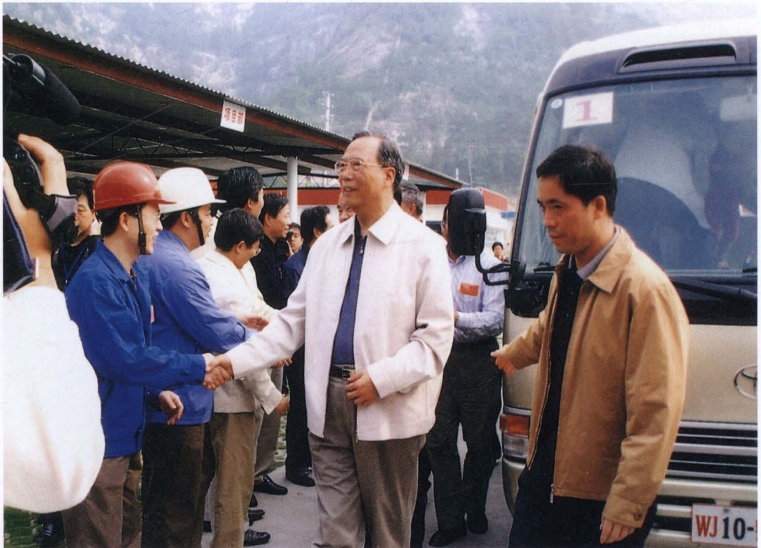
◇2004年10月4日,国务院副总理曾培炎(右二)考察桐柏抽水蓄能电站