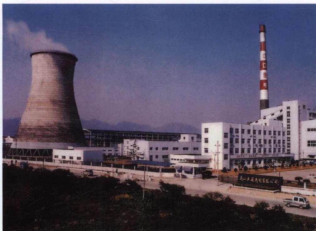
◇黄岩热电有限公司