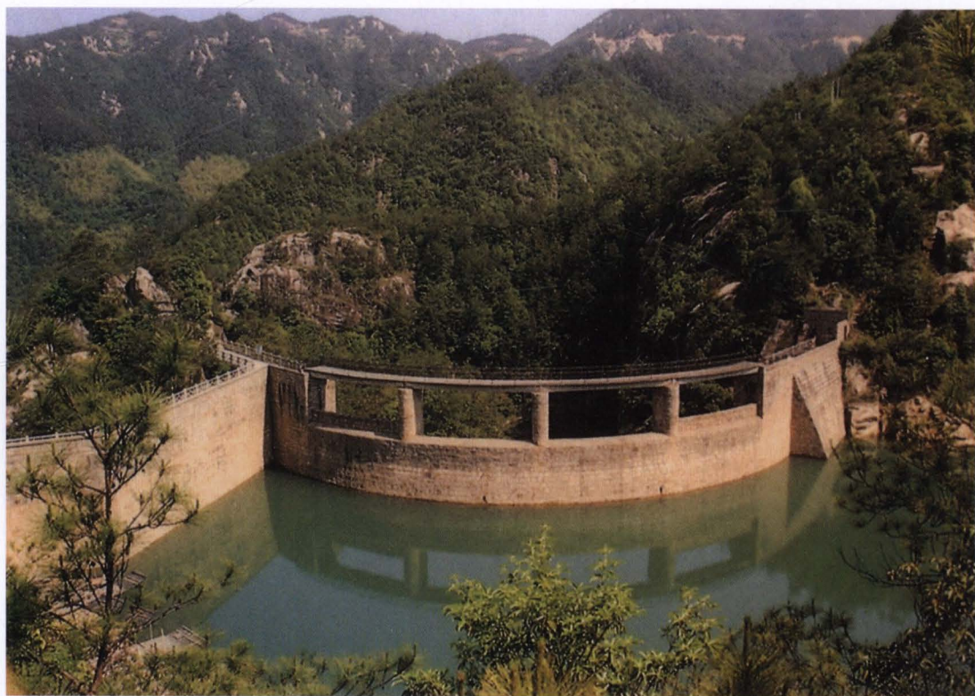
◇桐坑溪水电站双曲拱坝