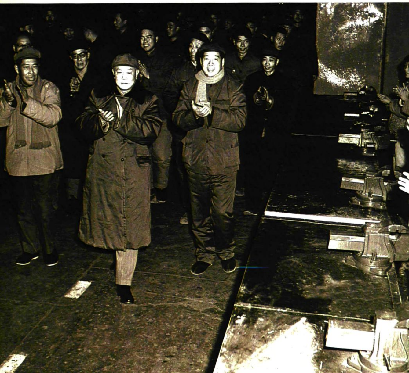
● 1978年1月10日，中共中央副主席、国务院副总理李先念视察二汽。