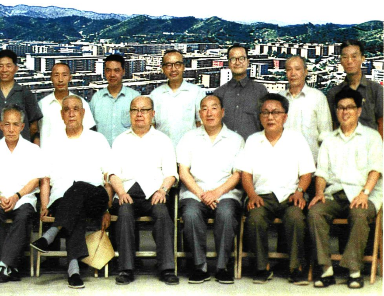
视察二汽部分专业厂后接见十堰二汽领导。

关心二汽建设，早在1965年选择厂址时，他就给予过热情的关注和指 期间，他参观了发动机、铸造、总装等专业厂，热情赞扬了二汽聚宝包 资金续建二汽的做法；鼓励二汽要注意多品种系列化生产，多搞民用 管理工作以及培养使用中青年干部的工作给予了肯定。