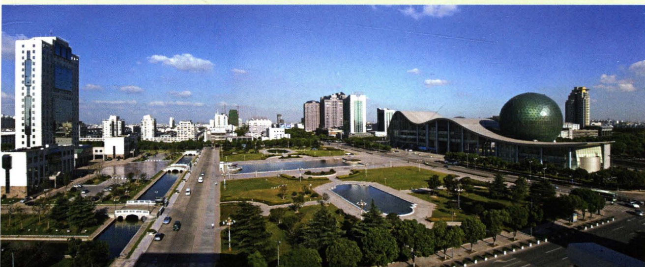
城市广场时尚气派