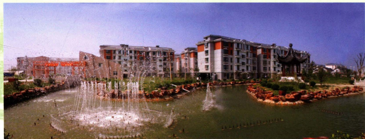
千灯镇大唐农村新居