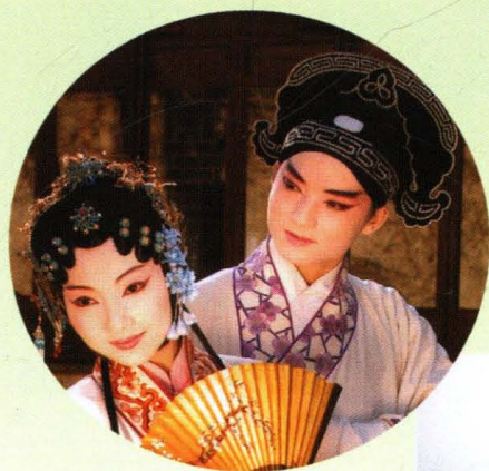
千灯昆曲表演真传神