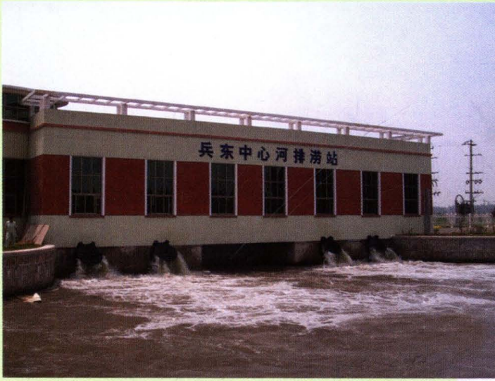
兵东中心河排涝站