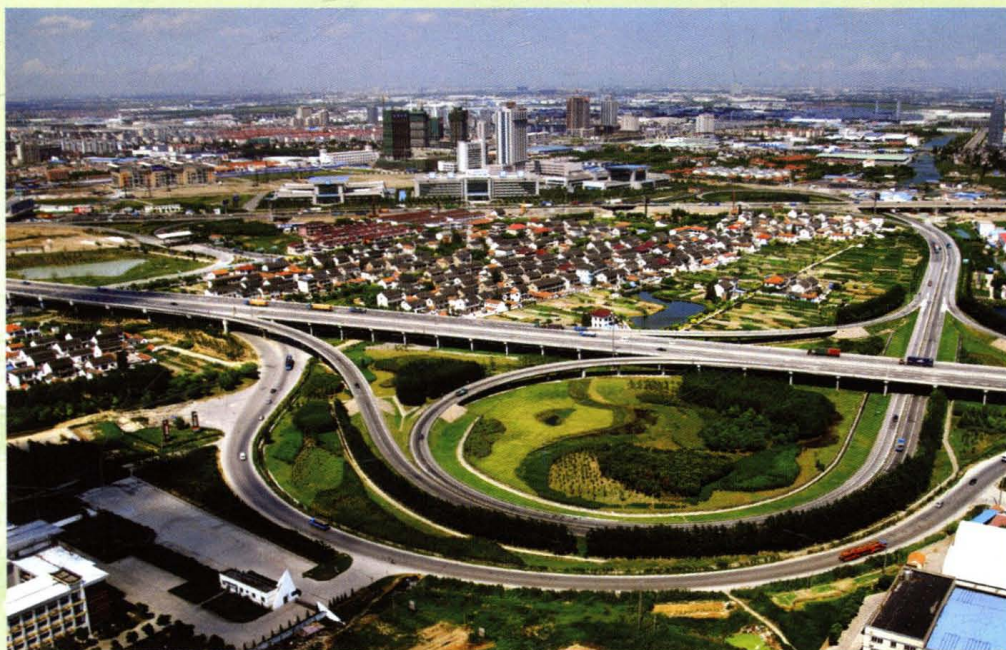
花桥沪宁高速立交