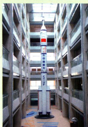
青少年宫航天展览馆