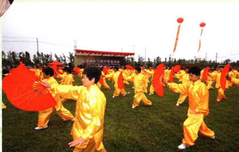
张浦农民运动会真热闹