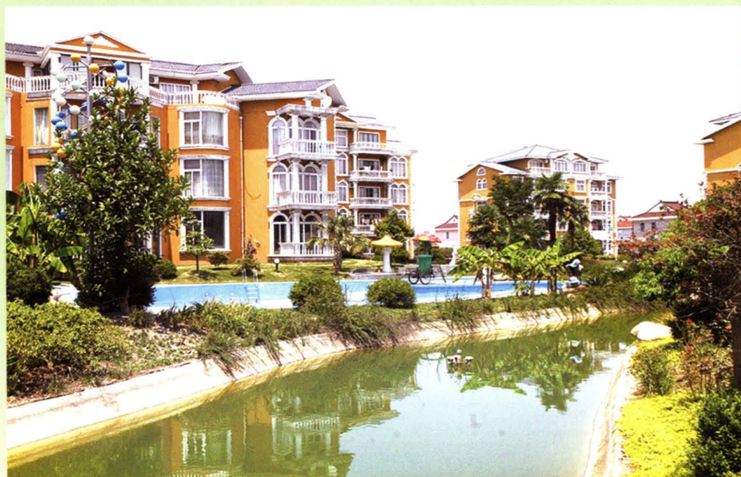
淀山湖晟泰农民新村