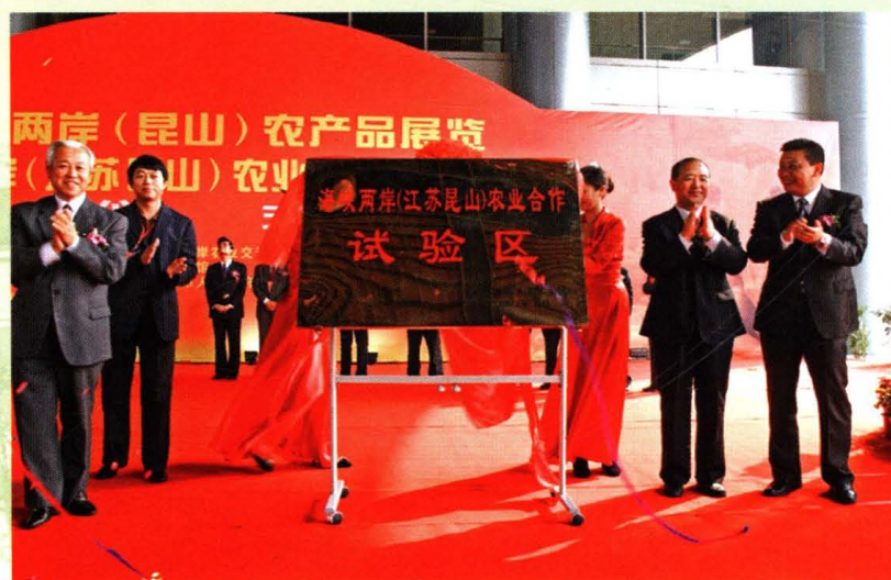
海峡两岸农业合作