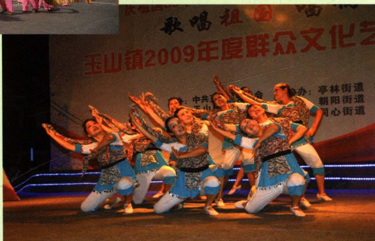
玉山群众文艺汇演真认真