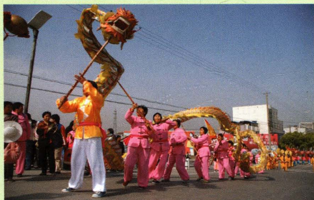
巴城农民舞龙队真棒