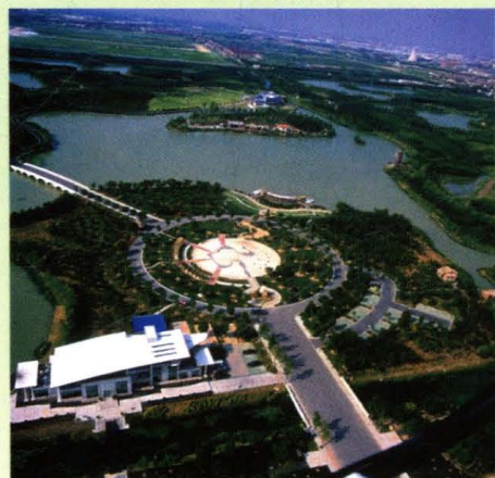
森林公园生态氧巴