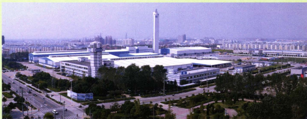
玉山镇通力电梯外景