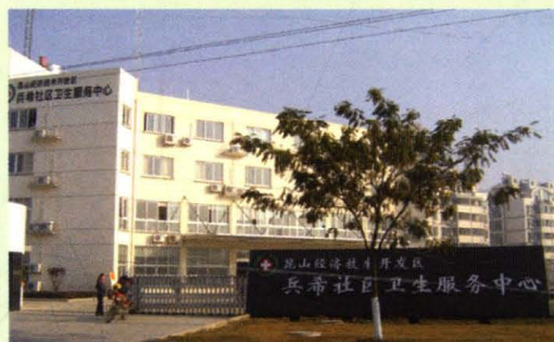
兵希社区卫生服务中心