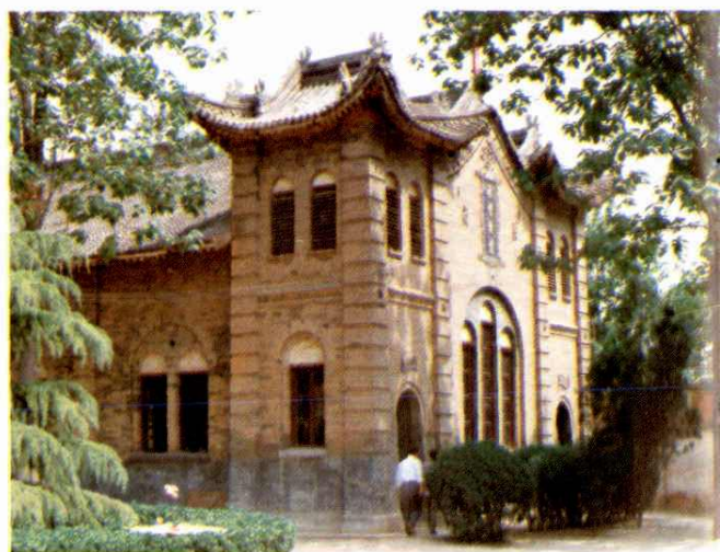
三原县油坊道基督教堂