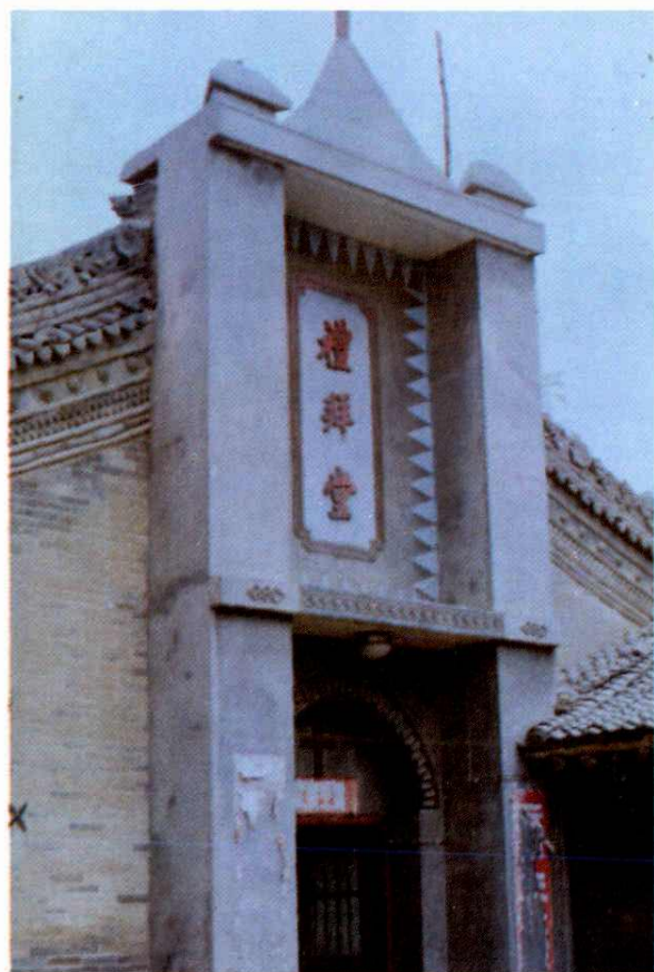
乾县城关基督教堂