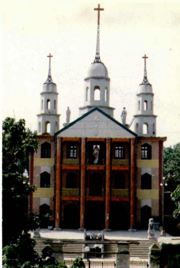
泾阳县修石渡天主教堂