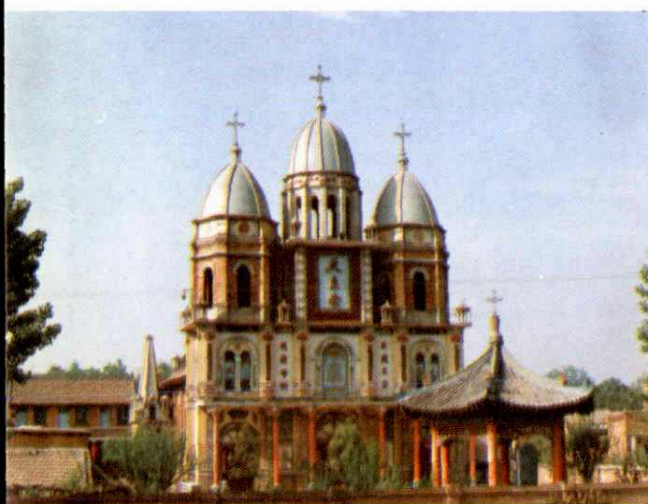
武功县普中天主教堂