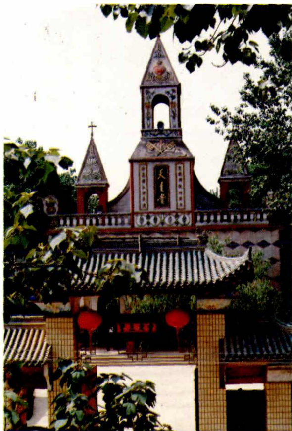
兴平五丰村天主教堂