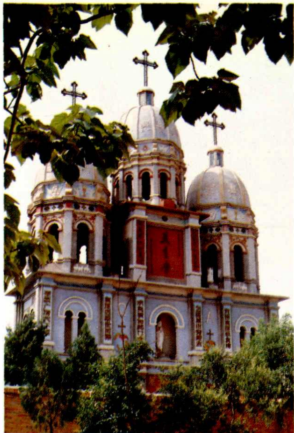
礼泉县茨林村天主教堂