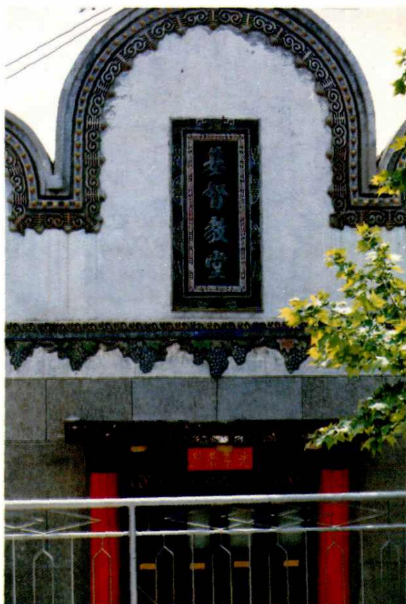
兴平槐巷基督教堂