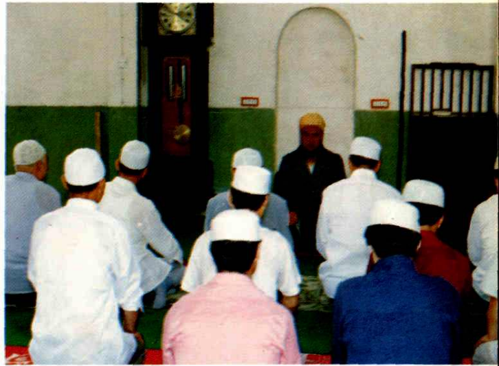
三原县穆斯林在清真寺举行会礼