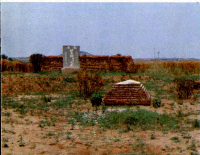
伊斯兰教经堂教育创始人胡大师祖(登洲)墓地