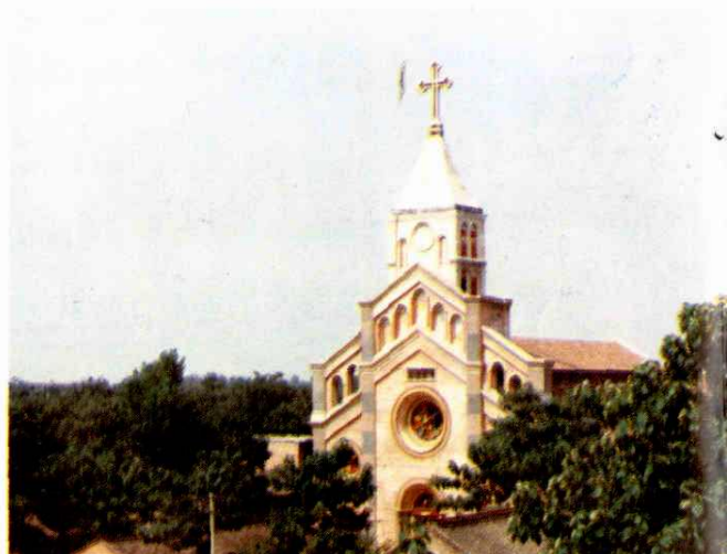
三原县辕门巷天主教总堂