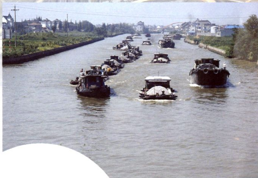
改造后的乍嘉苏航道