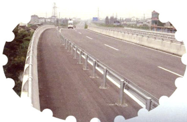
横贯全市中部腹地的一级公路—平廊公路