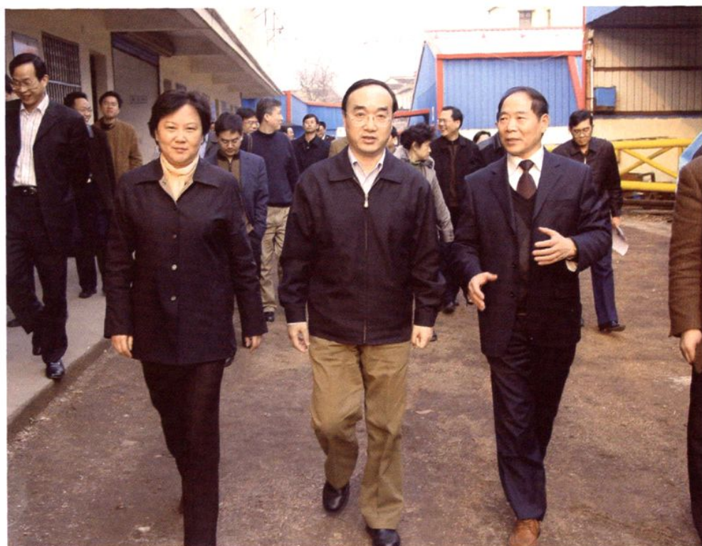
交通部副长翁孟勇来平湖市视察标准化船型改造工作（2005年3月）