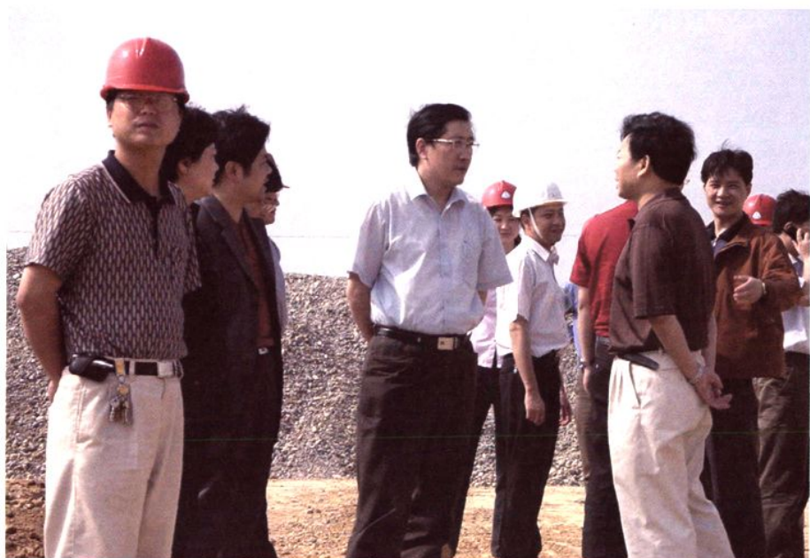
市长马邦伟视察交通 建设工地（2007年7月）