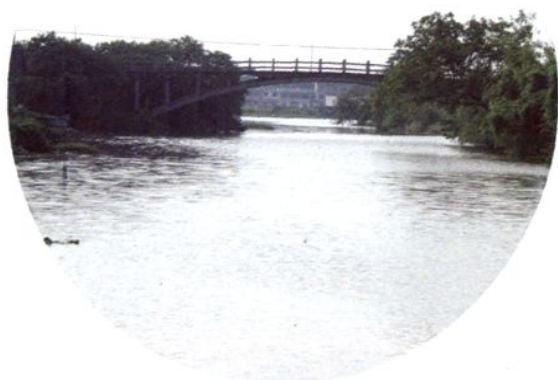
改造前的乍嘉苏航道