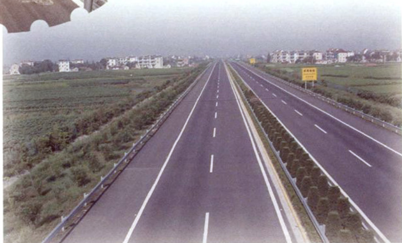
乍嘉苏高速公路的建成通车实现了平湖市内高速公路“零”的突破