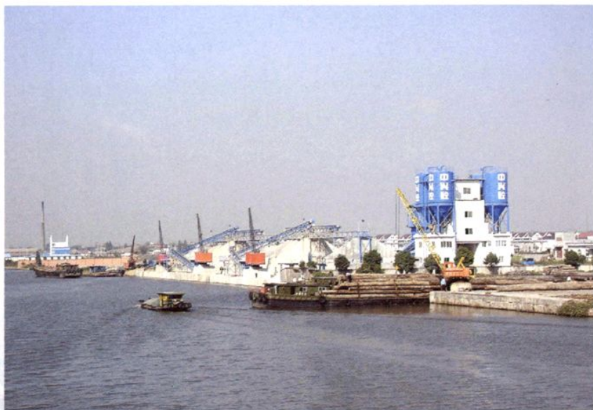
初具规模的白马内河港区