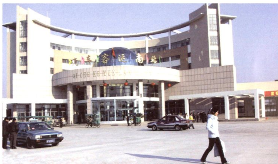
新建成的客运南站