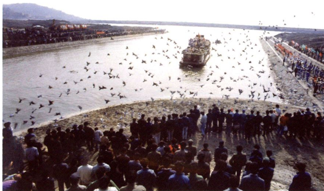
嘉兴（乍浦）港内河港池试航成功