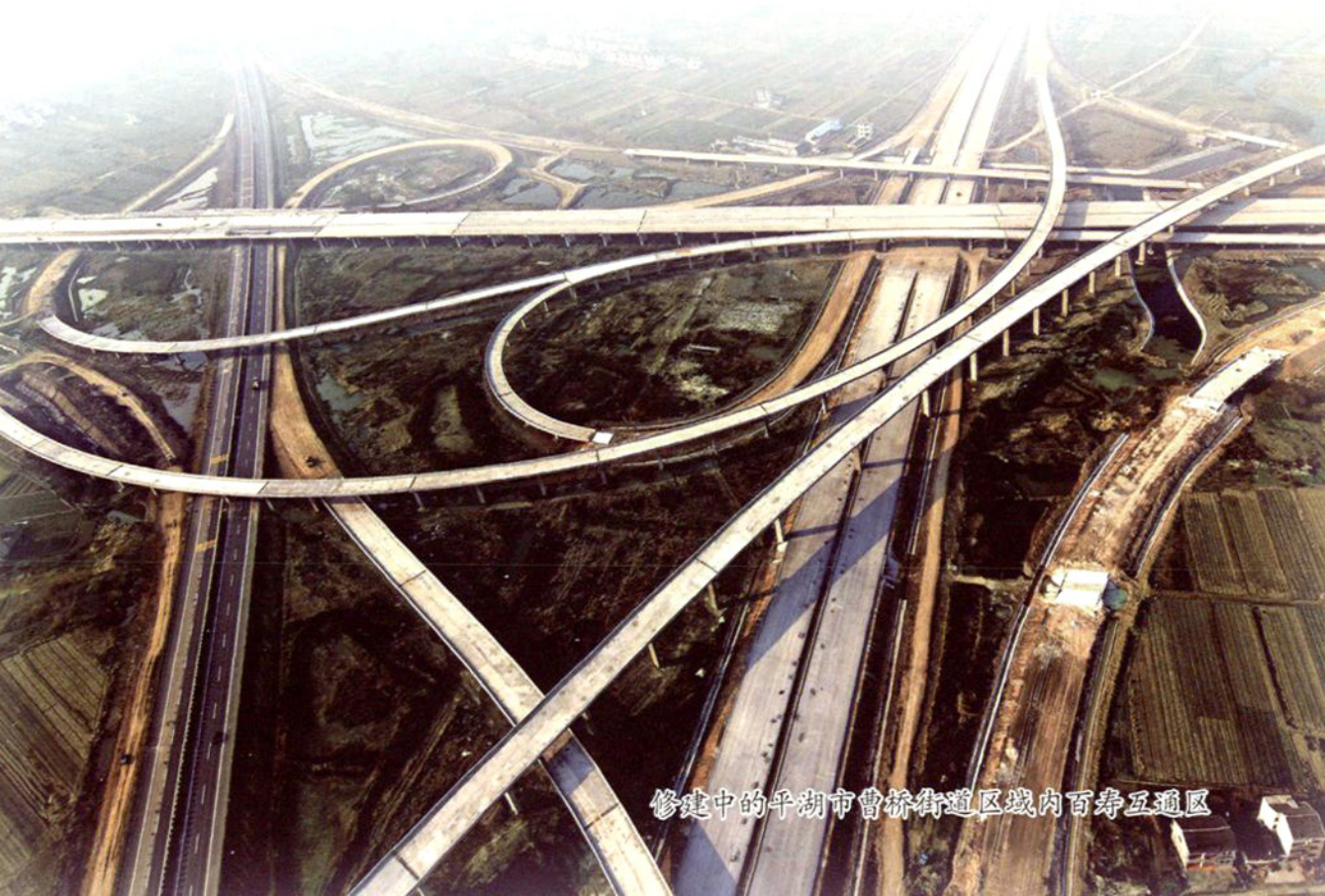
修建中的平湖市曹桥街道区域内百寿互通区