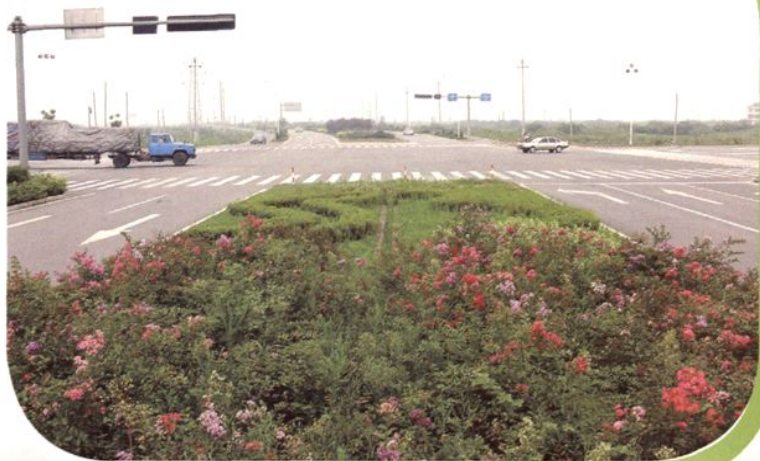
绿化一景 平兴—独黎公路口