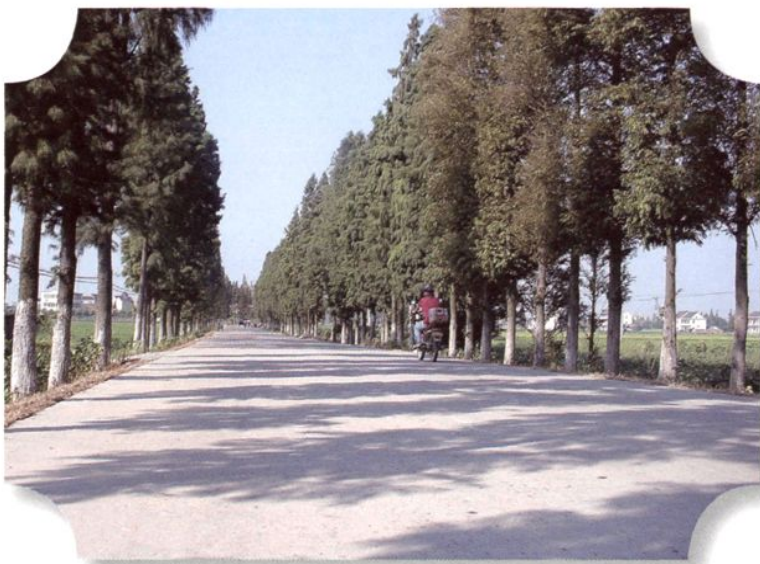
乡村公路绿色通道