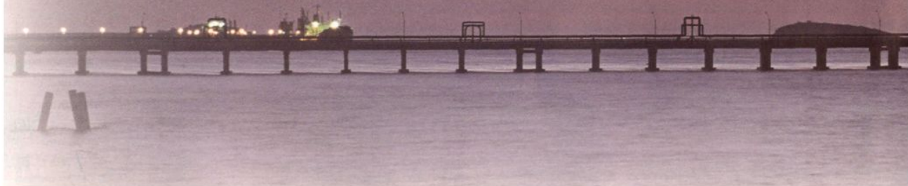
嘉兴（乍浦）港区一期