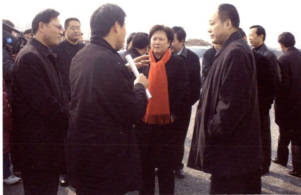
嘉兴市副市长王洪涛视察平湖交通建设工作（2006年11月）