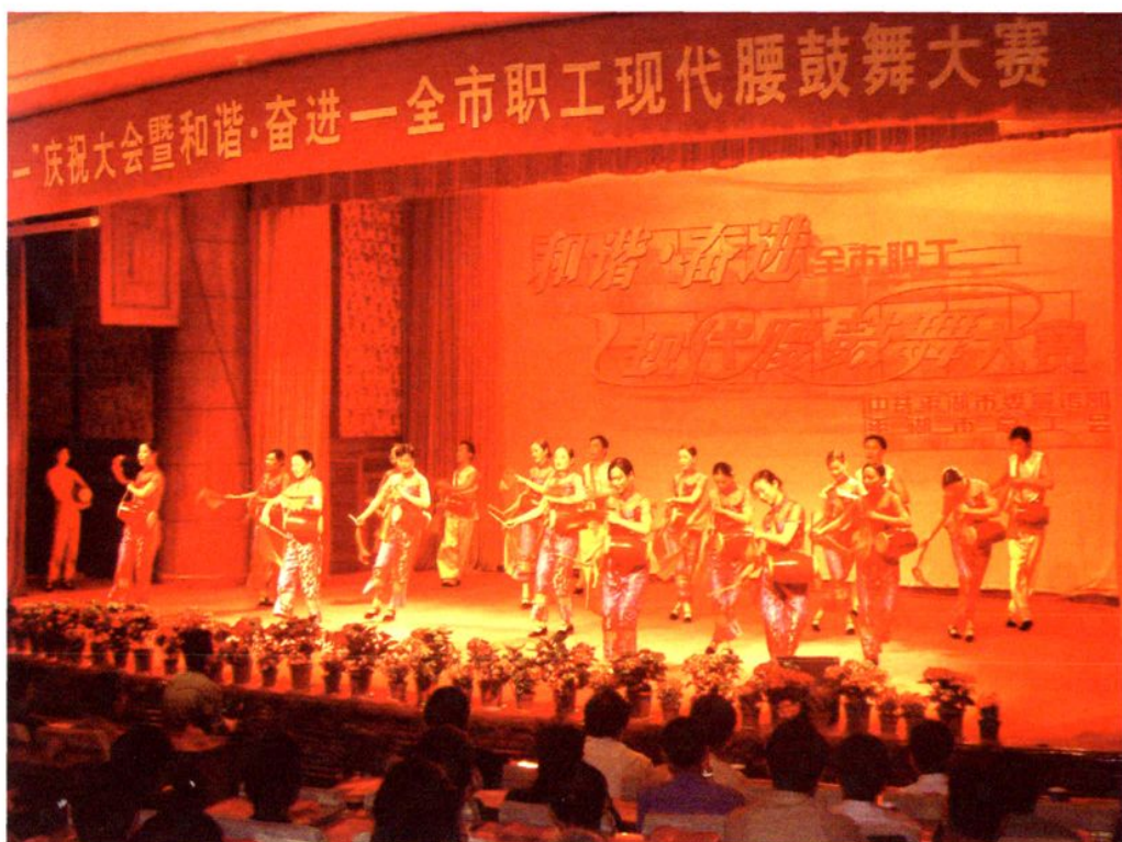
交通职工参加全市职工现代腰鼓舞大赛