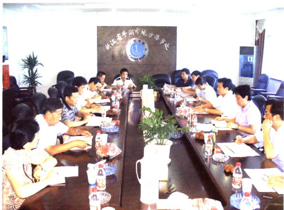
市委书记孙贤龙等领导听取 通发展规划汇报（2006年7月）