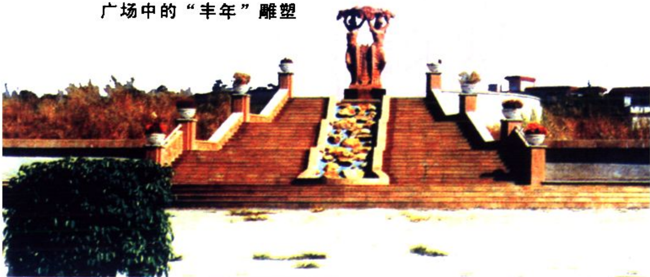
仑头生态文化广场