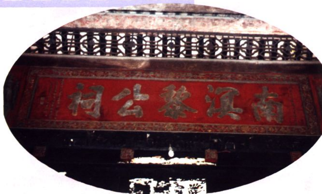
启建于乾隆二十七年 （一七六二）的南溟黎公祠