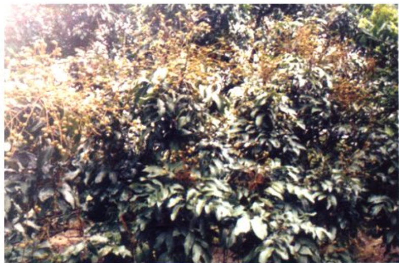
享誉广州市“南肺” 之称的仑头生态果园