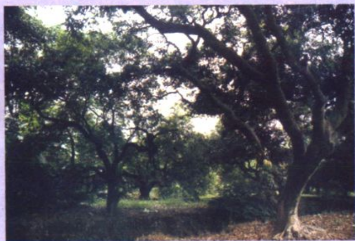
未被干扰的 自然生态环境