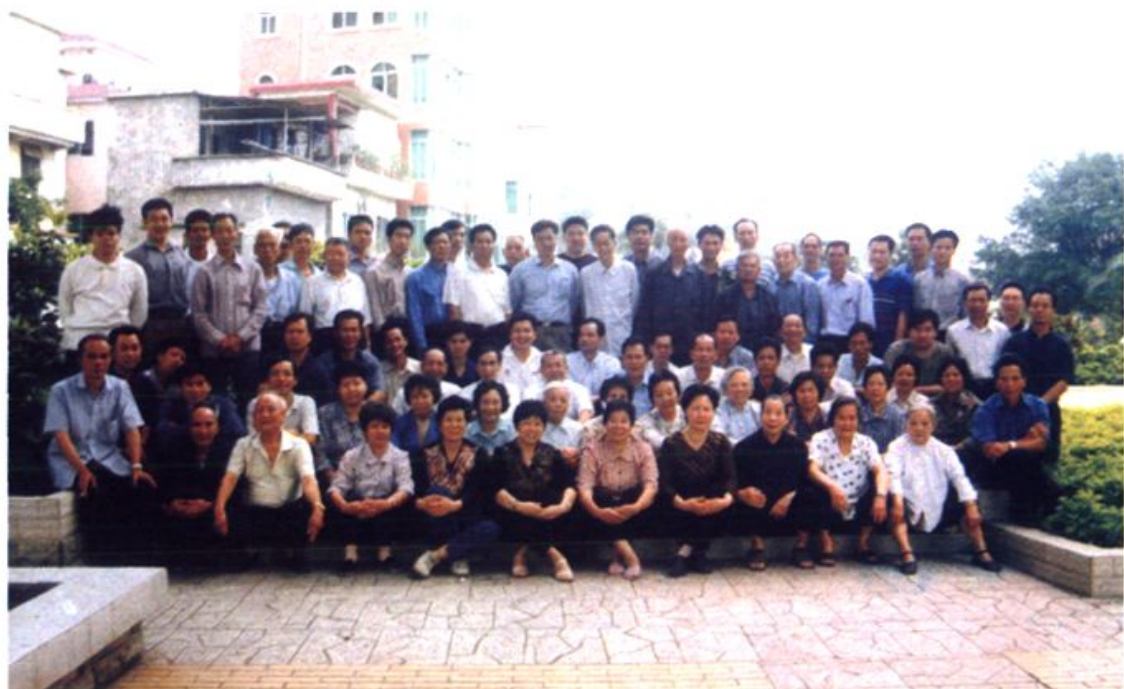
仑头村全体共产党员