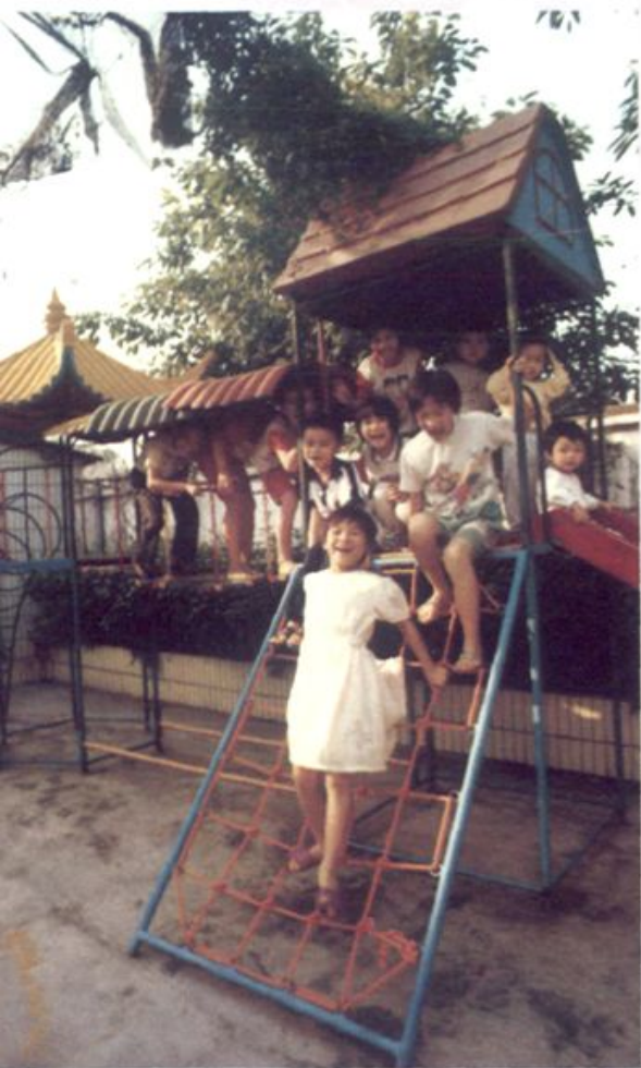
看，他们多么天真活泼