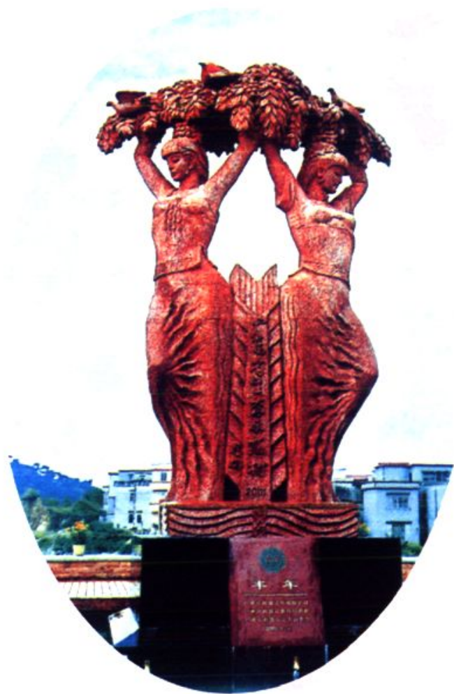
广场中的“丰年”雕塑