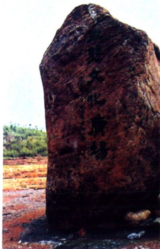
仑头生态文化广场 (陈景舒题)