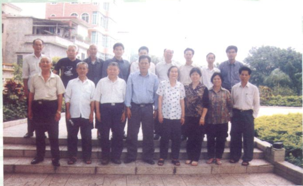
仑头村历届与现任村干部