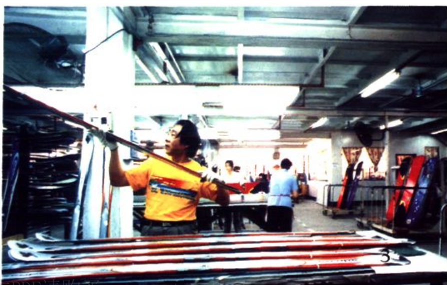
东泰金属制品厂 —— 滑雪板车间