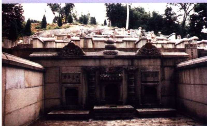
建于道光（一八三九） 的仑头始祖坟