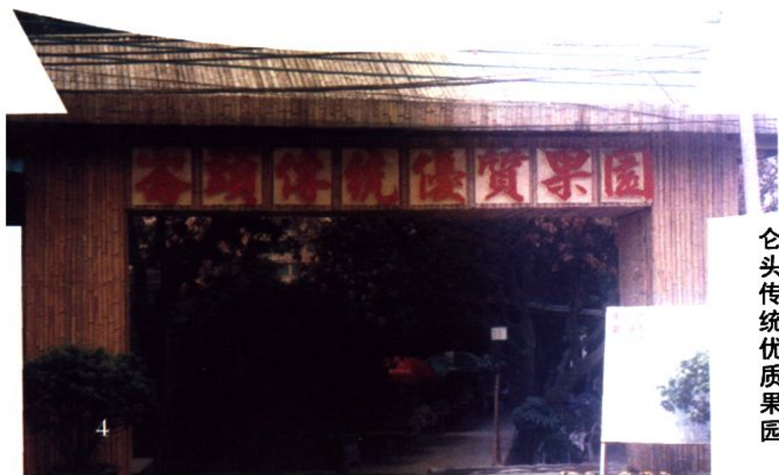
仑头传统优质果园