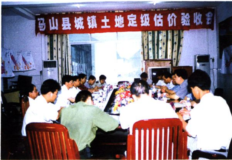
马山县城镇土地定级估价通过自治区的鉴定验收。图为验收会场。