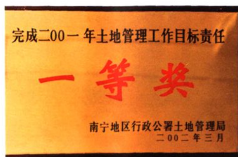
马山县土地管理局获得的荣誉证。