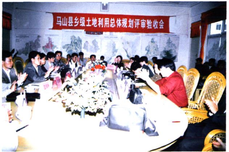
图为马山县乡级土地利用总体规划修编评审会会场。