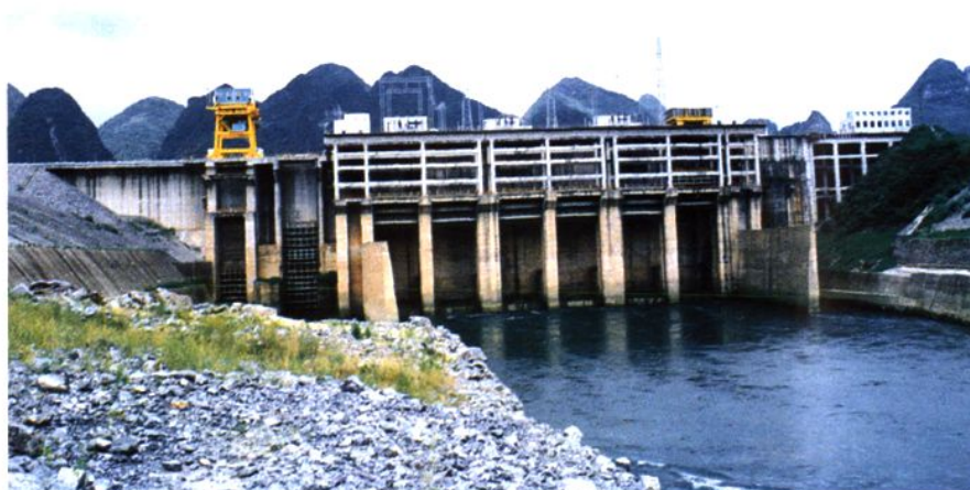
装机容量 19.2 万千瓦，无人值班的百龙滩水电站，座落在马山县百龙滩镇大球村红水河南岸。