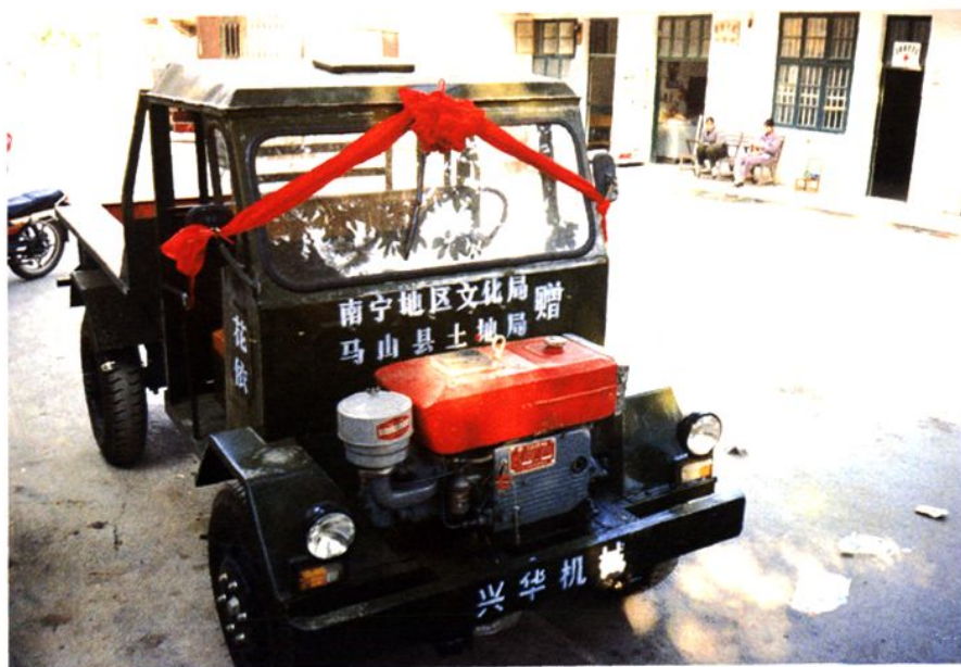
南宁地区文化局、马山县土地局支持扶贫点发展村办企业。图为两局无偿给花衣村赠送的价值 17000 元的小四轮农用车。