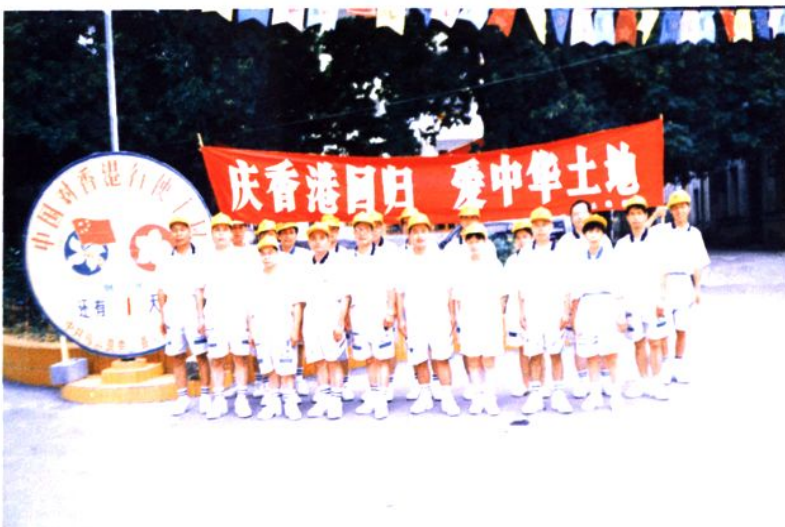
马山县土地局积极组织干部职工参加县委、县人民政府举行的各种大型活动。图为县土地局全体干部职工参加县委、县人民政府举行的县城迎香港回归万人环城跑活动前合影留念。