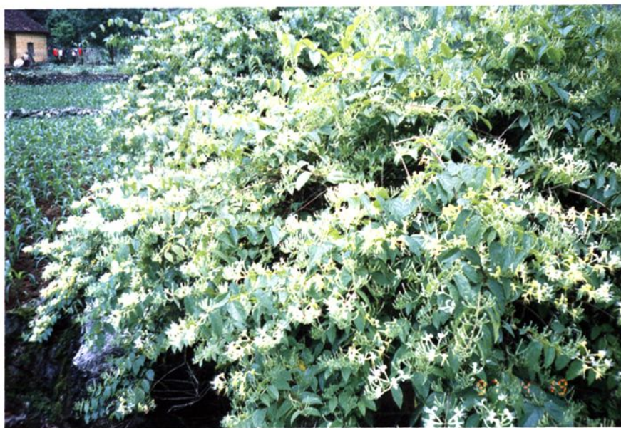
马山县注重因地制宜调整产业结构。图为县土地局扶贫挂点村——加方乡花衣村大力发展种植的金银花。