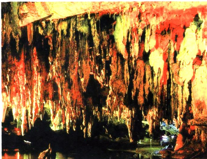
世界名洞——马山金伦洞风光如画