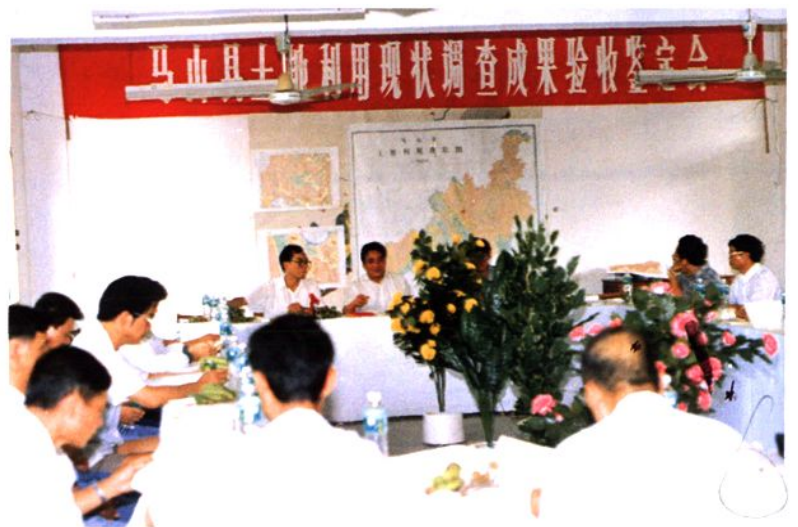
马山县土地利用现状调查成果通过自治区审查验收。图为验收鉴定会现场。