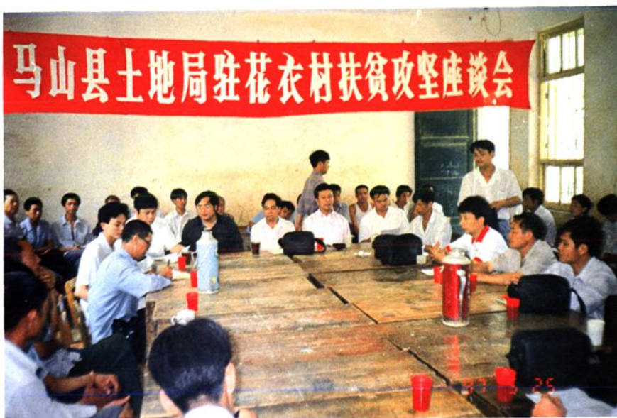
马山县土地局积极参与农村扶贫工作。图为县土地局召开的挂点花衣村扶贫座谈会。县委领导、自治区扶贫办领导、加方乡领导以及县土地局全体干部、扶贫联系户参加了座谈会。