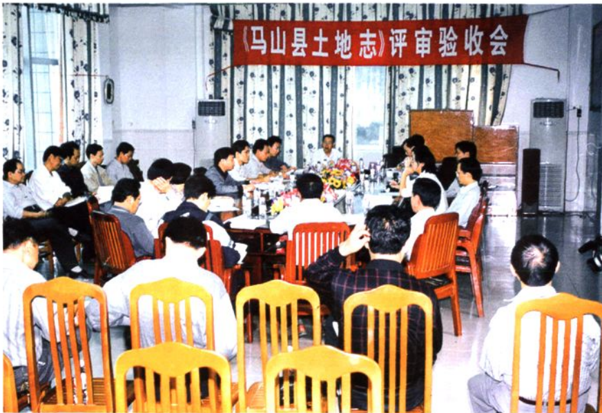
《马山县土地志》通过评审。