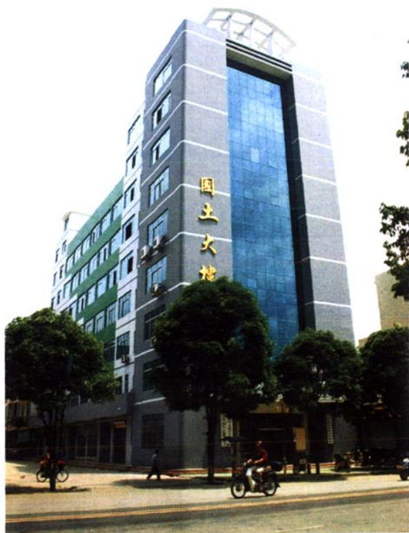
装修一新的办公大楼