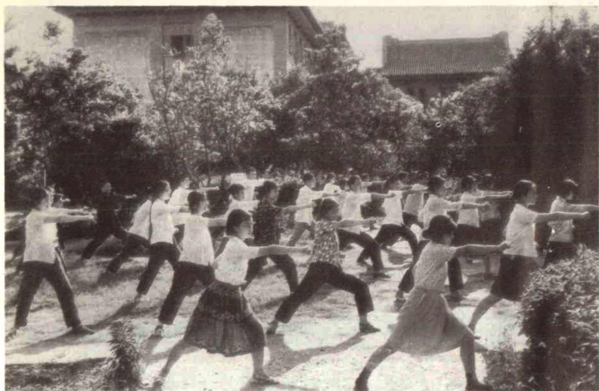
华中师范大学学生做广播体操。