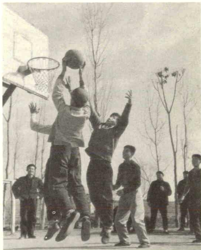
打篮球是农村青年们喜爱的一项体育活动。