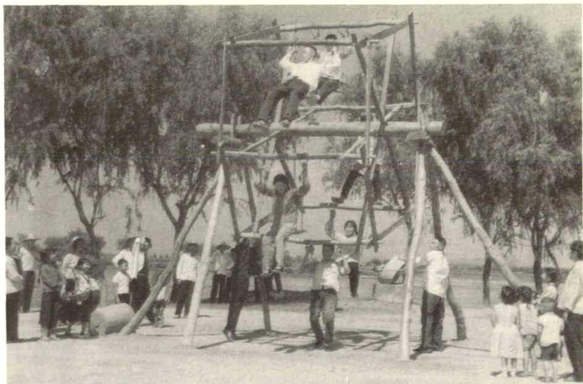
麻城县中一乡的妇女喜爱玩六人秋千。