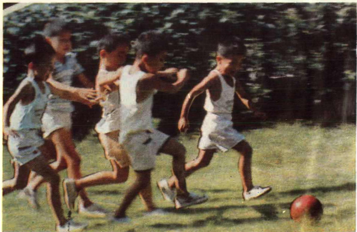
足球之乡安陆县的业余体校少年足球运动员在训练。