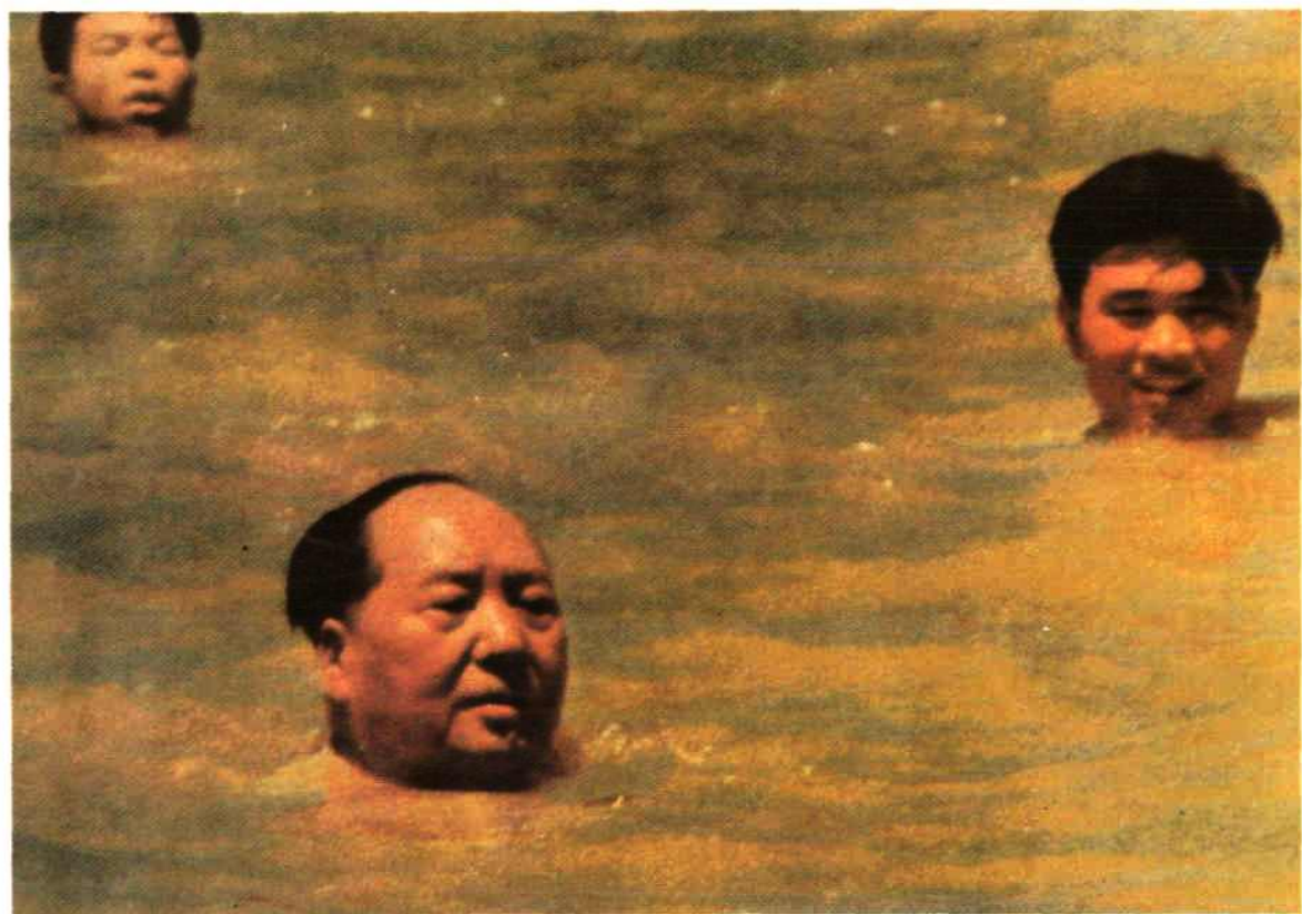
毛泽东主席在武汉畅游长江。