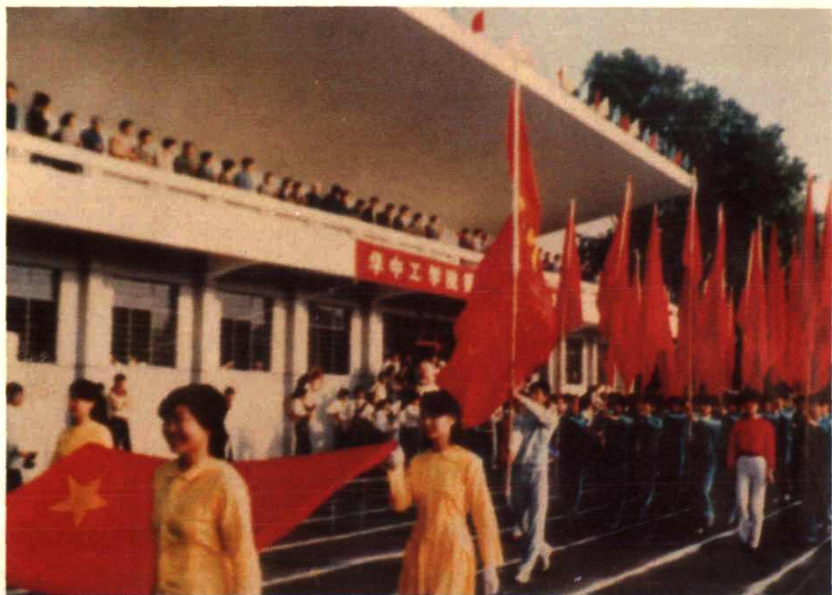
1985年华中理工大学运动会入场式。