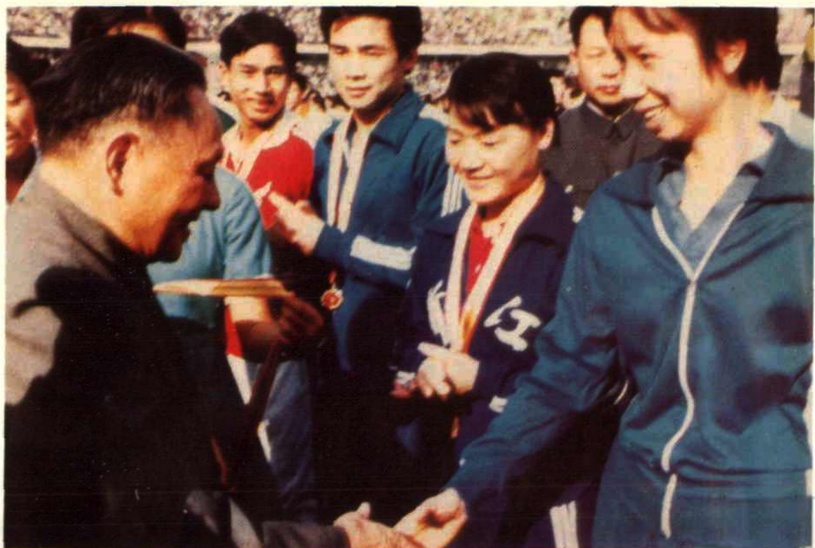
1979年在第四届全运会的闭幕式上，邓小平同湖北羽毛球运动员韩爱萍握手。