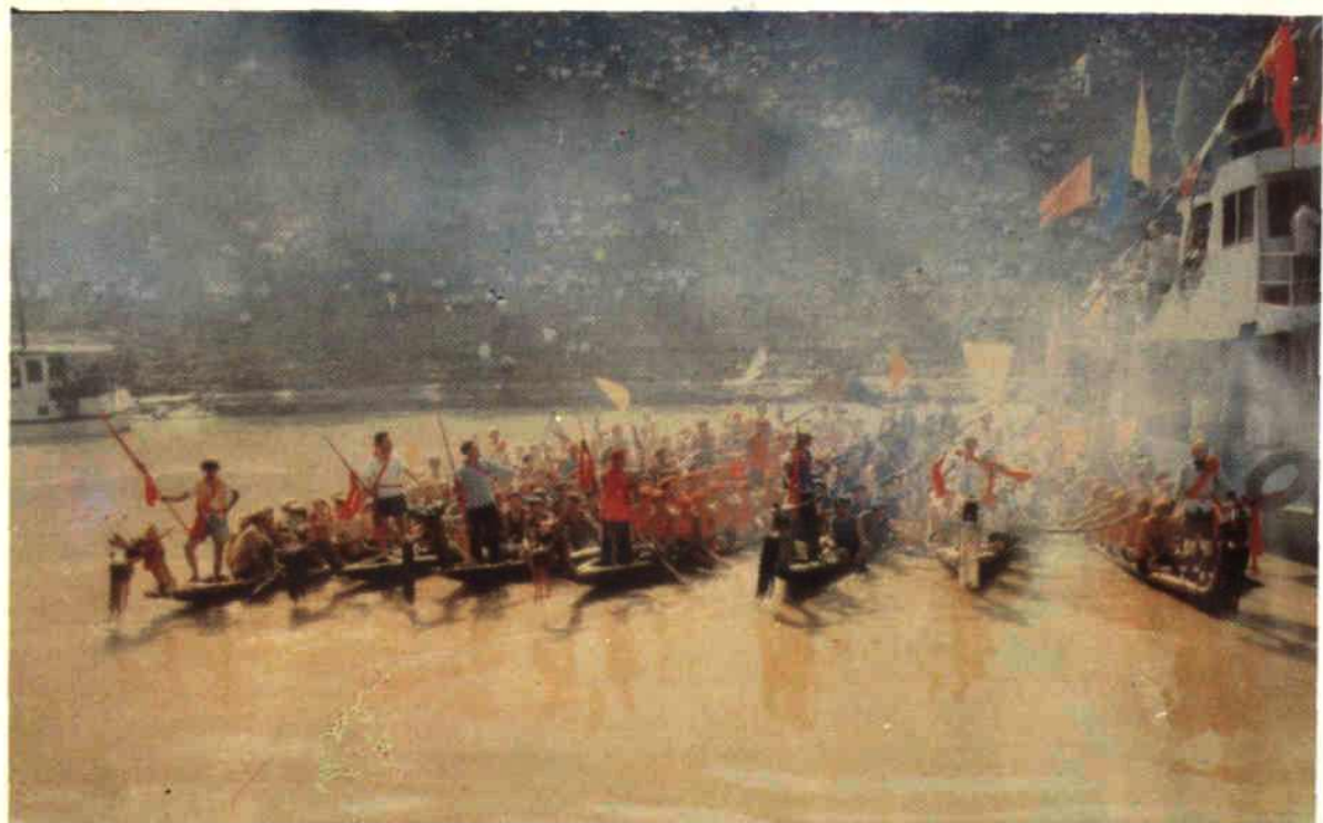
1982年农历五月初五（端午节），秭归县举行纪念屈原赛龙舟活动。