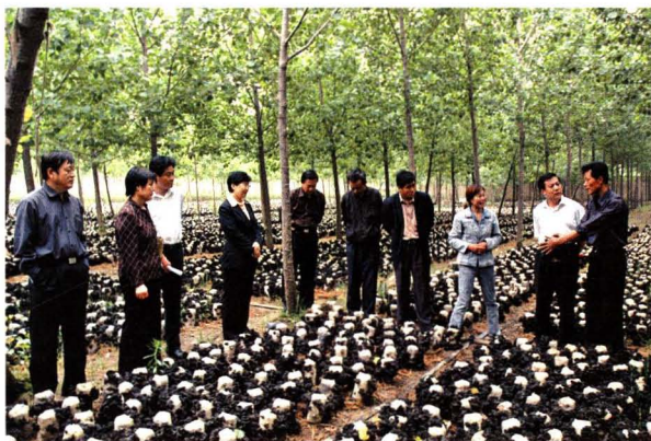
2006年5月，市致富工程食用菌工作现场会在费县薛庄镇召开。

1986年，费县科研机构数量较少，力量比较薄弱。1987年，费县科学技术情报研究所成立，是临沂地区第一家县级科学技术情报研究机构。20世纪90年代初期，费县民办科研机构才有所发展。1993年，费县板栗技术研究所成立。1992年10月—1995年12月，发展民办研究所17个。1995年，县政府印发《关于加速科学技术进步的决定》。1996年，全县建立厂办科研机构7个，配有专职科研人员101人，科技科（组）29个。1997年，费县珍稀动物研究所成