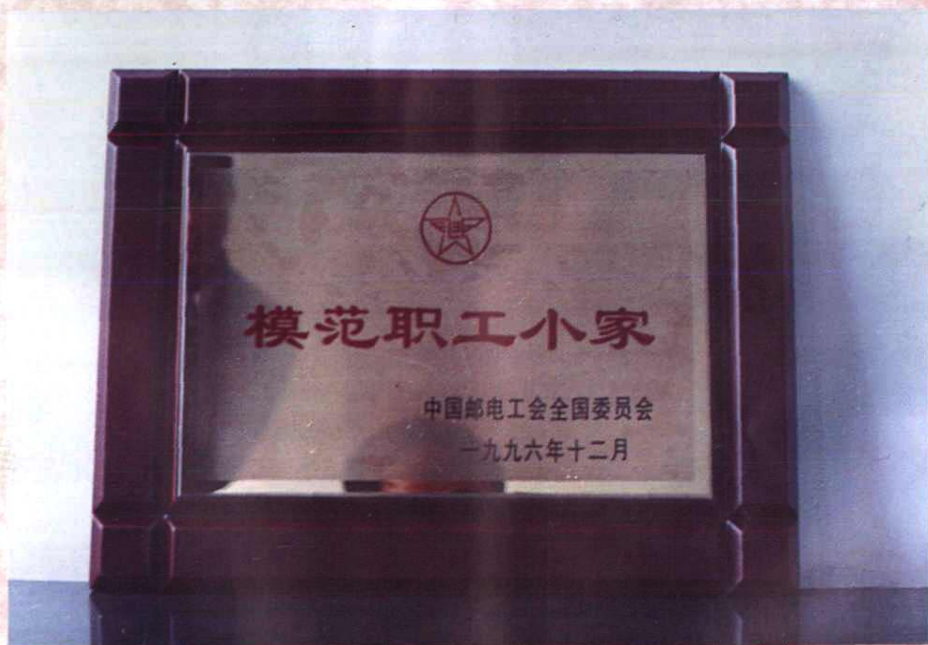
洲湖邮电支局被中国邮电工会全国委员会授予“模范职工小家”光荣称号（1996年12月）