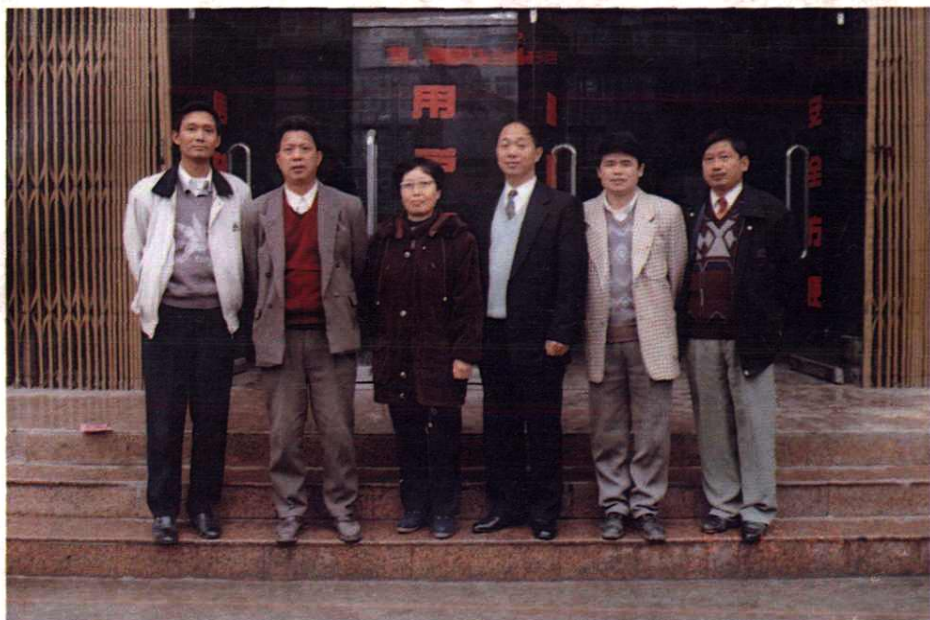
安福县邮电局领导班子成员合影(1997年12月)