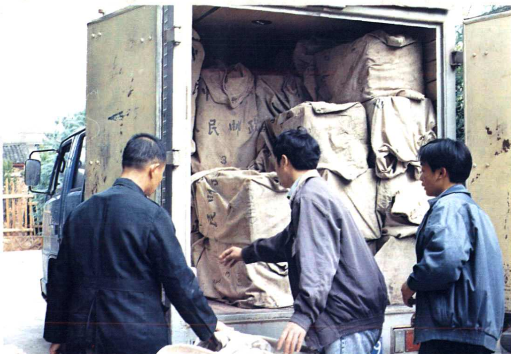
开办点对点包裹业务直运直投