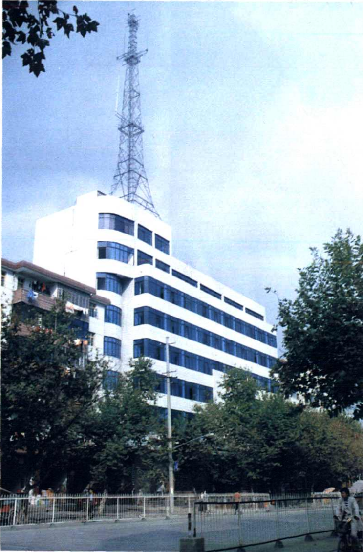
安福县邮电局程控大楼