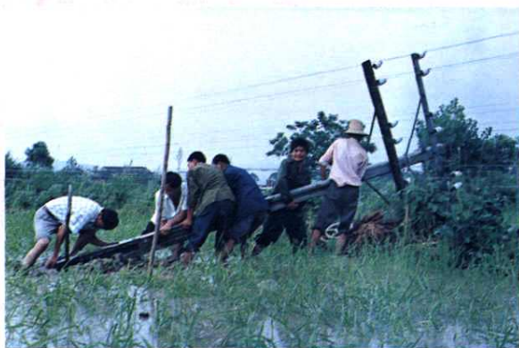
全力抢修被洪水冲断的中继电杆线路