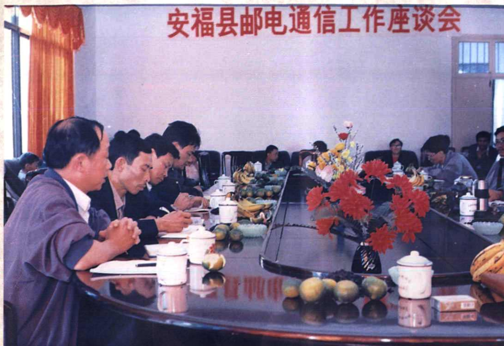
1995年安福县邮局通信工作座谈会