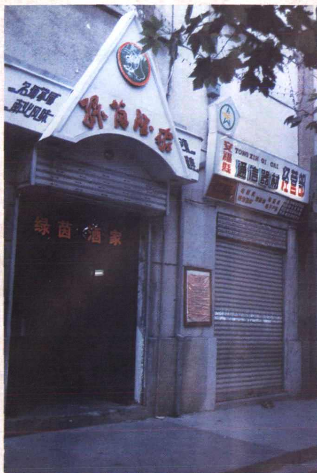
通信器材经营部和饮食服务部（绿茵酒家）