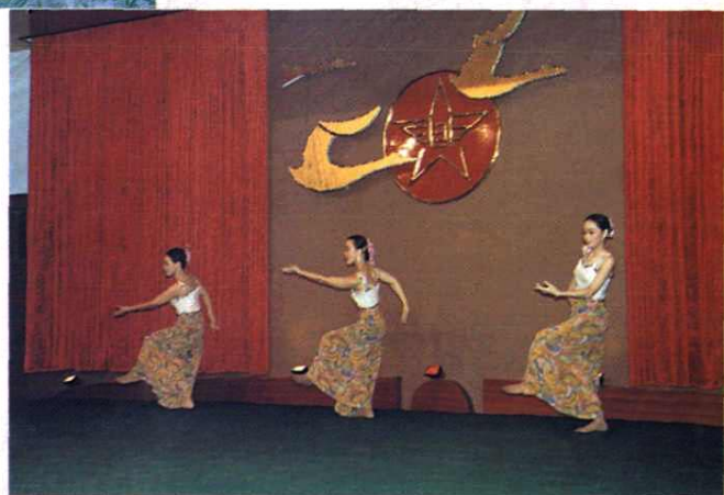
获第二届全区邮电职工文艺汇演表演奖节目“月光下” (1996.11)