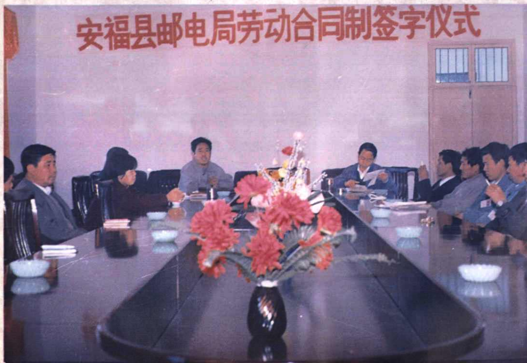
1995年12月举行劳动合同制签字仪式