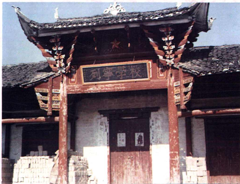
1931年冬，中共湘赣边特委西北特区分委在金田乡上城村设立上城赤色邮局。图为局房旧址。