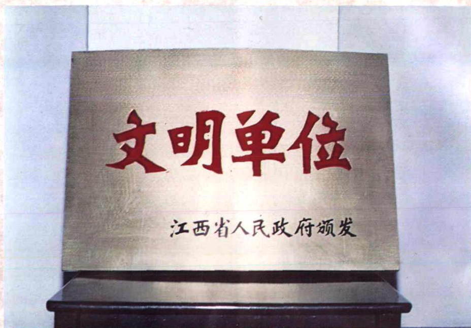
安福县邮电局荣获江西省人民政府颁发的“文明单位”光荣称号（1994年）