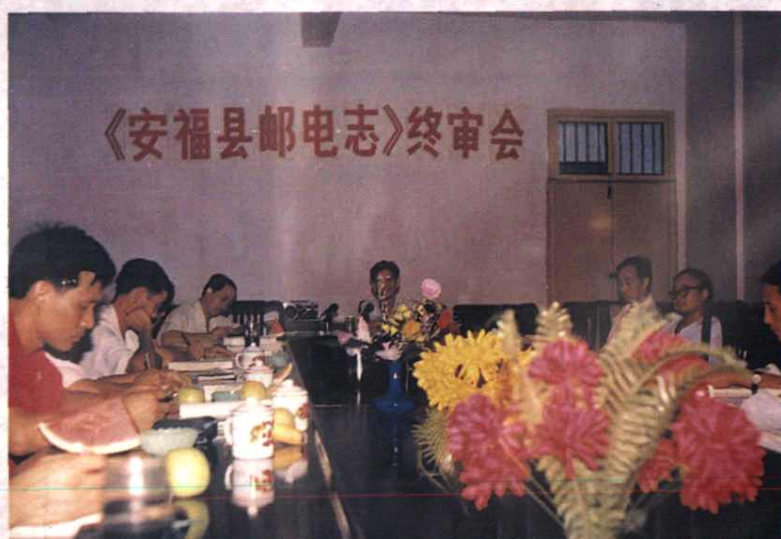
《安福县邮电志》终审会