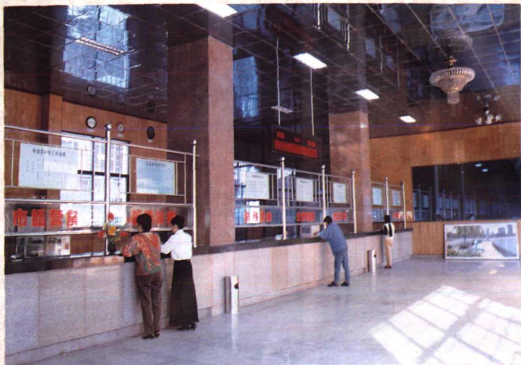
全省县级标准化电信示范营业厅