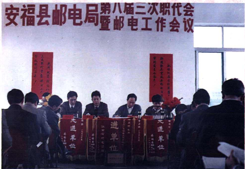
安福县邮电局第八届三次职代会暨邮电工作会议 (1997年3月)