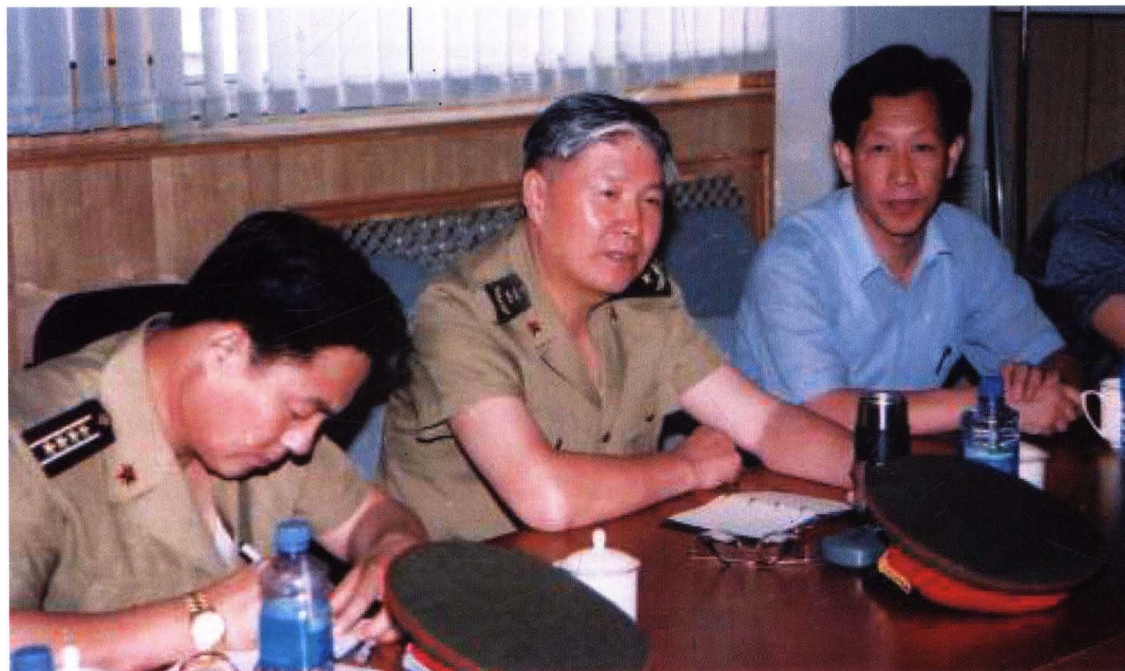
1997年,国防科工委副主任王统业中将(中)来校视察