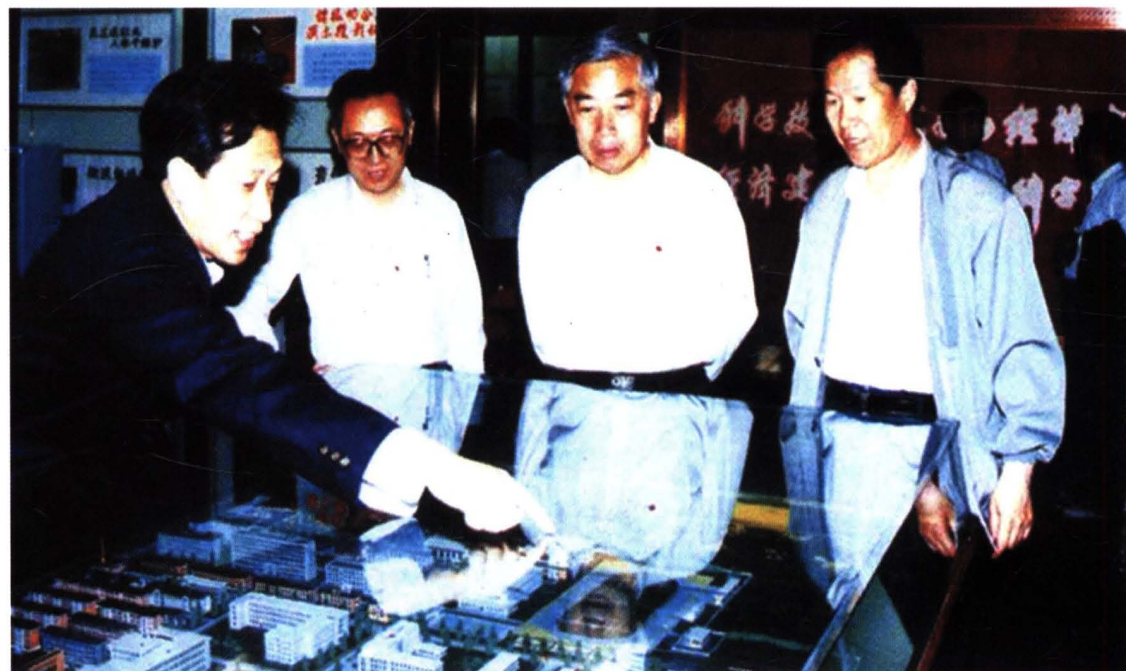
1996年,兵器工业总公司总经理张俊九(右二)来校视察