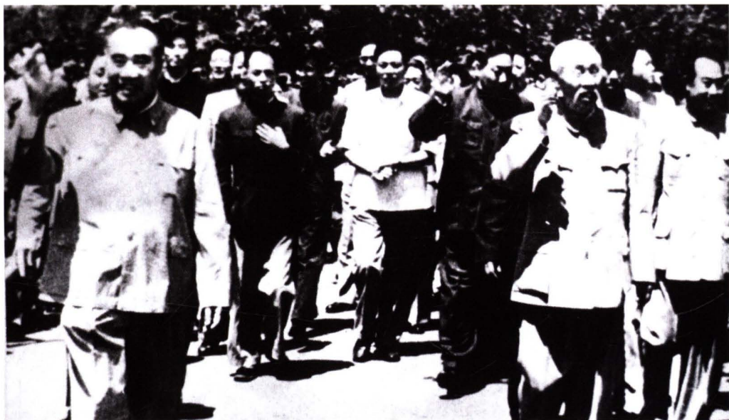
1959年,朱德、董必武、林枫等领导来校视察