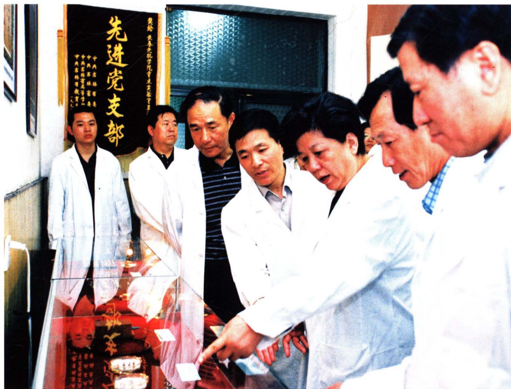
2003年,国务委员陈至立(右三)在中共吉林省委书记王云坤(左三)的陪同下来校视察