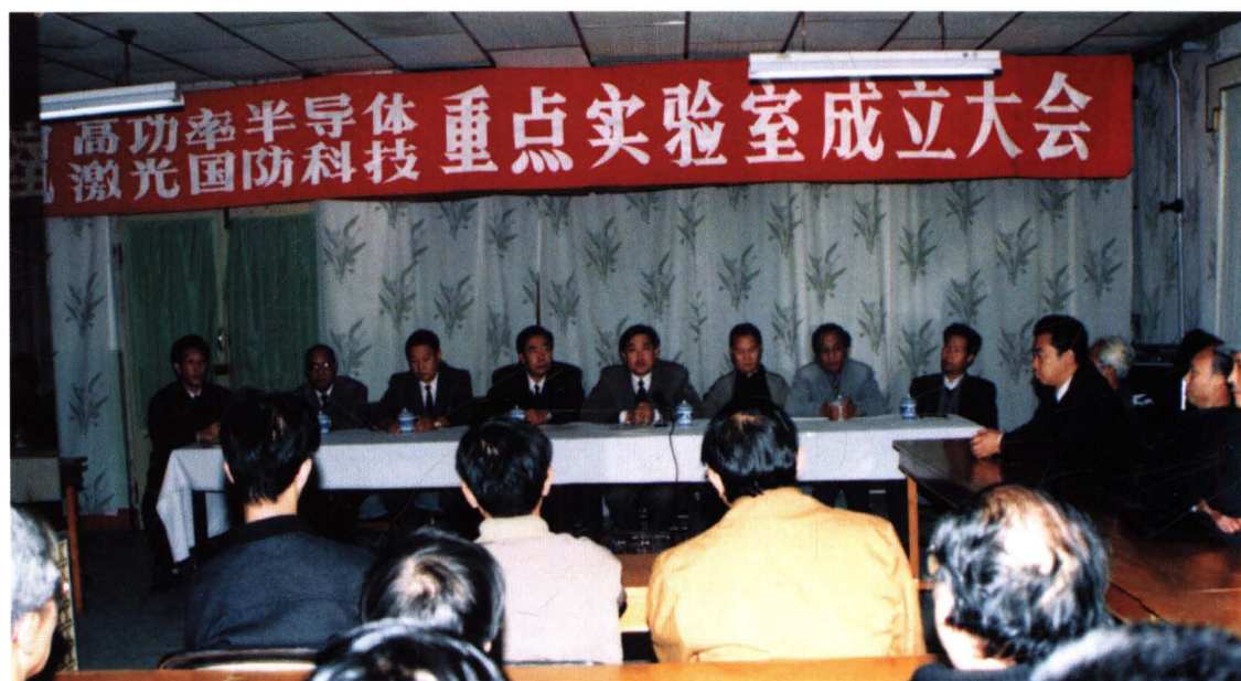
1994年,国防科技重点实验室成立大会