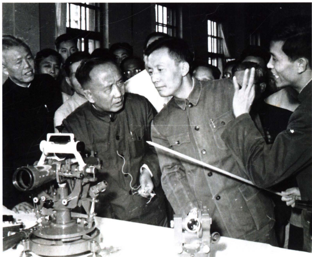
1958年,郭沫若、张劲夫、吴有训来校视察