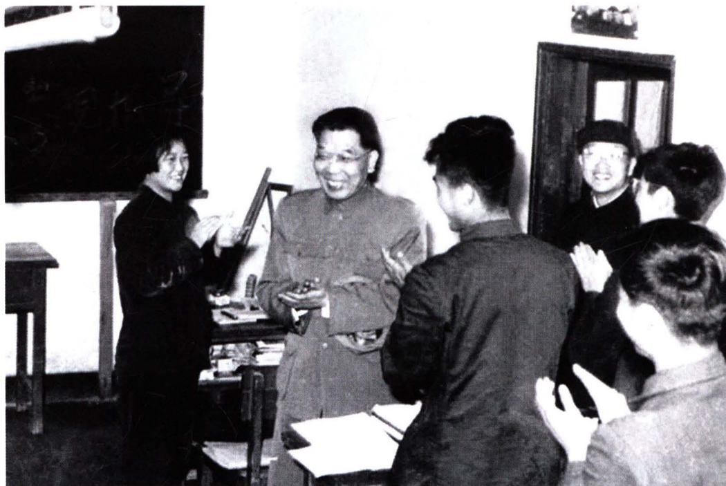
1963年,严济慈来校视察