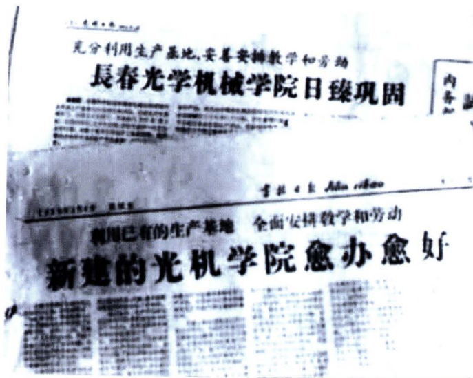
1960年,《光明日报》、《吉林日报》发表文章肯定学校取得的成绩