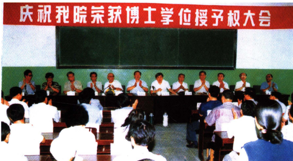
1996年,学校召开获得博士学位授予权庆祝大会