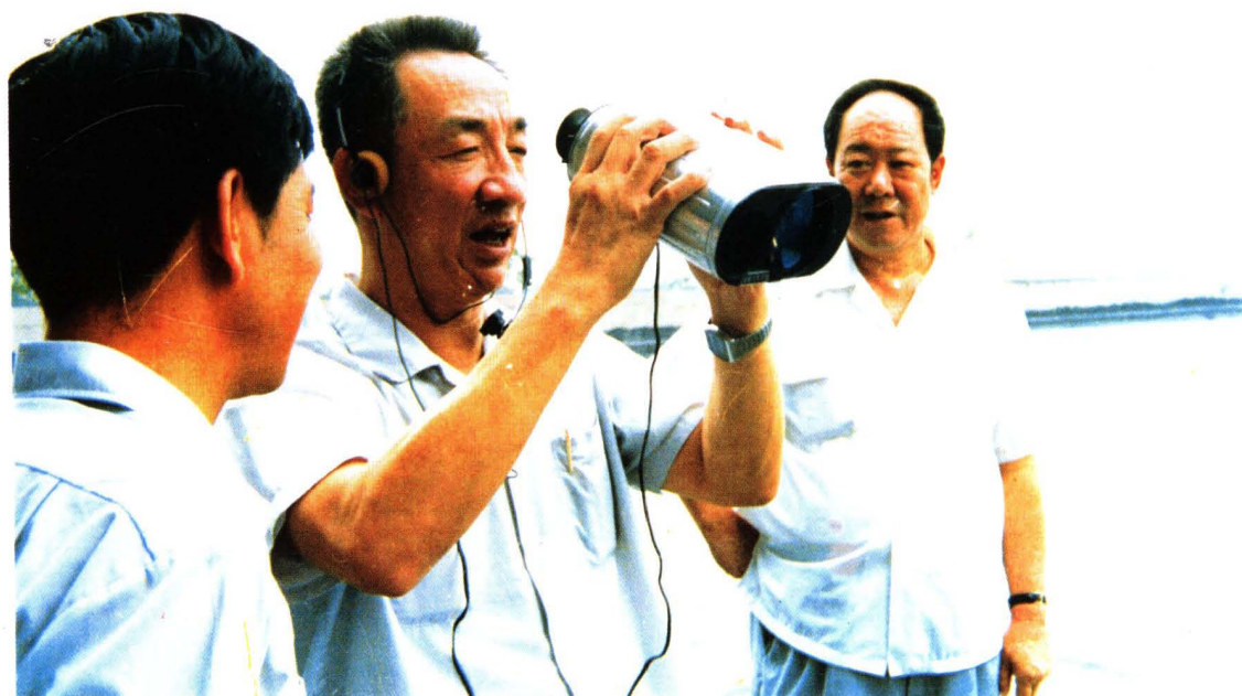
1985年,邹家华来校视察