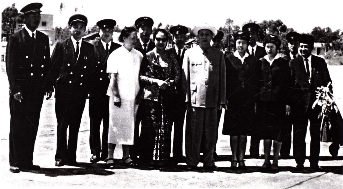
■ 1962年10月2日，民航北京管理局派专机执行印度尼西亚总统苏加诺（前排右一）及夫人哈蒂尼·苏加诺（前排右五）访问中国专机任务。图为广东省省长陈郁（前排右四）陪同苏加诺总统与专机组合影