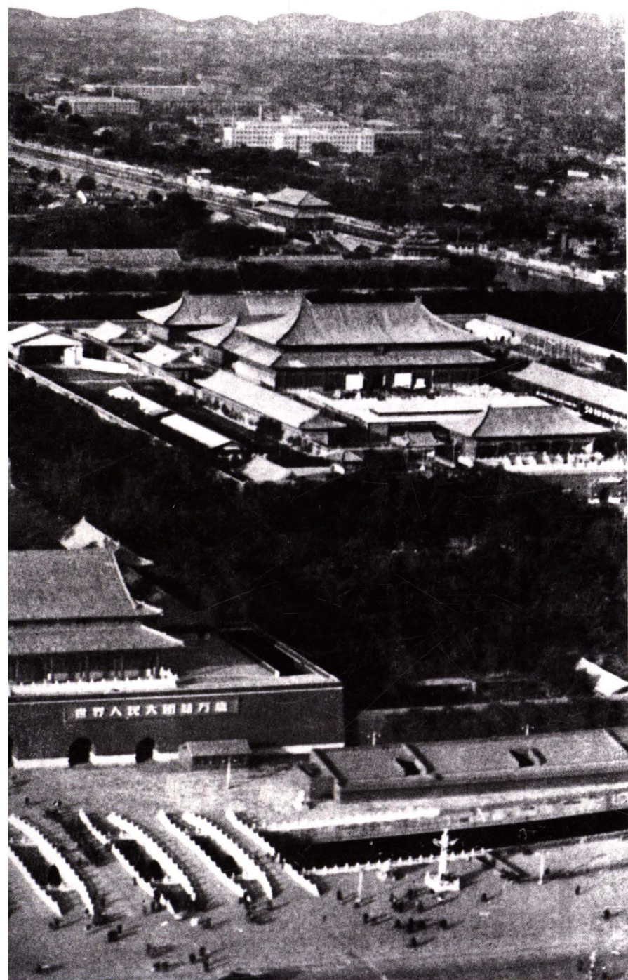
■ 20 世纪 50 年代末期，民用航空线从祖国的首都北京通向全国各地和友好邻邦