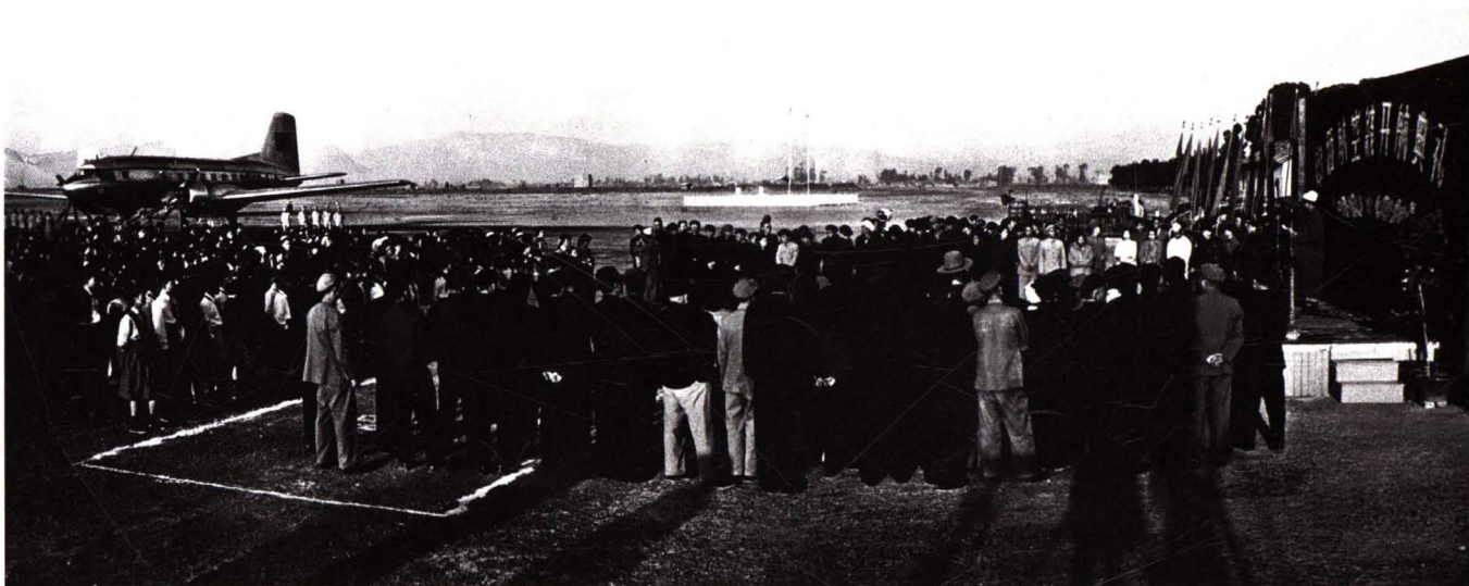
■ 1956年4月11日，民航北京管理处使用伊尔14型飞机开辟北京—昆明—缅甸曼德勒—仰光国际航线