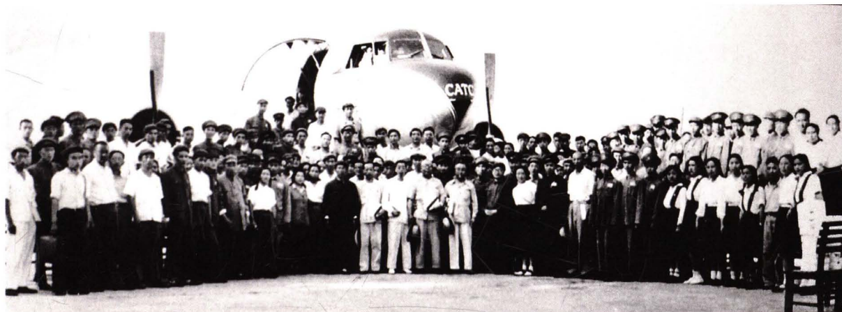
■ 1950年8月1日，“八一开航”全体人员在“北京”号飞机前合影