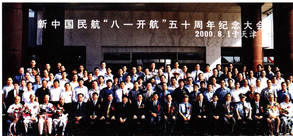
■ 2000年8月1日，新中国民航“八一开航”50周年纪念大会在天津召开