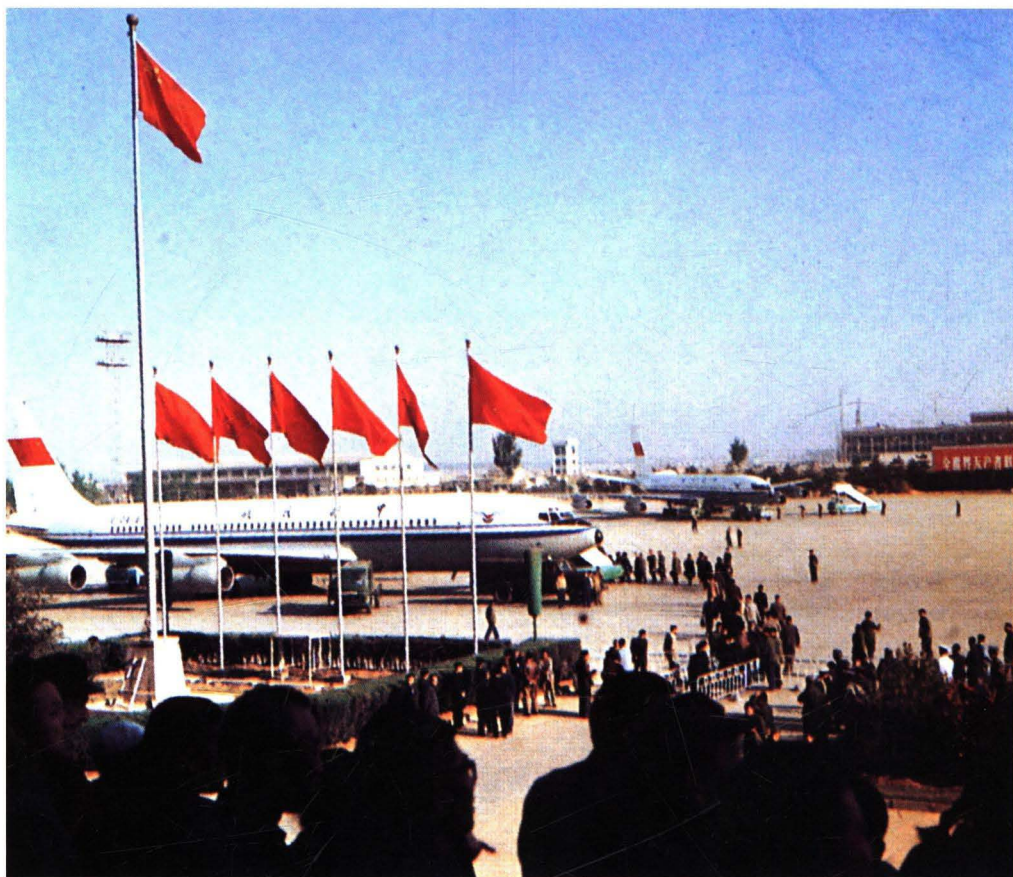
■ 1978年5月4日，民航北京管理局使用波音707型B-2418号飞机开辟北京—乌鲁木齐—贝尔格莱德—苏黎世国际航线。图为首航飞机离京前情景