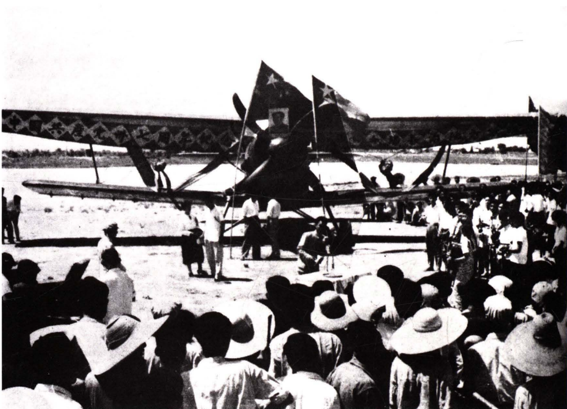
■ 1958年7月1日，山西省第一条地方航线太原—长治开航，中共山西省委、山西省人民委员会在太原亲贤机场举行庆祝活动