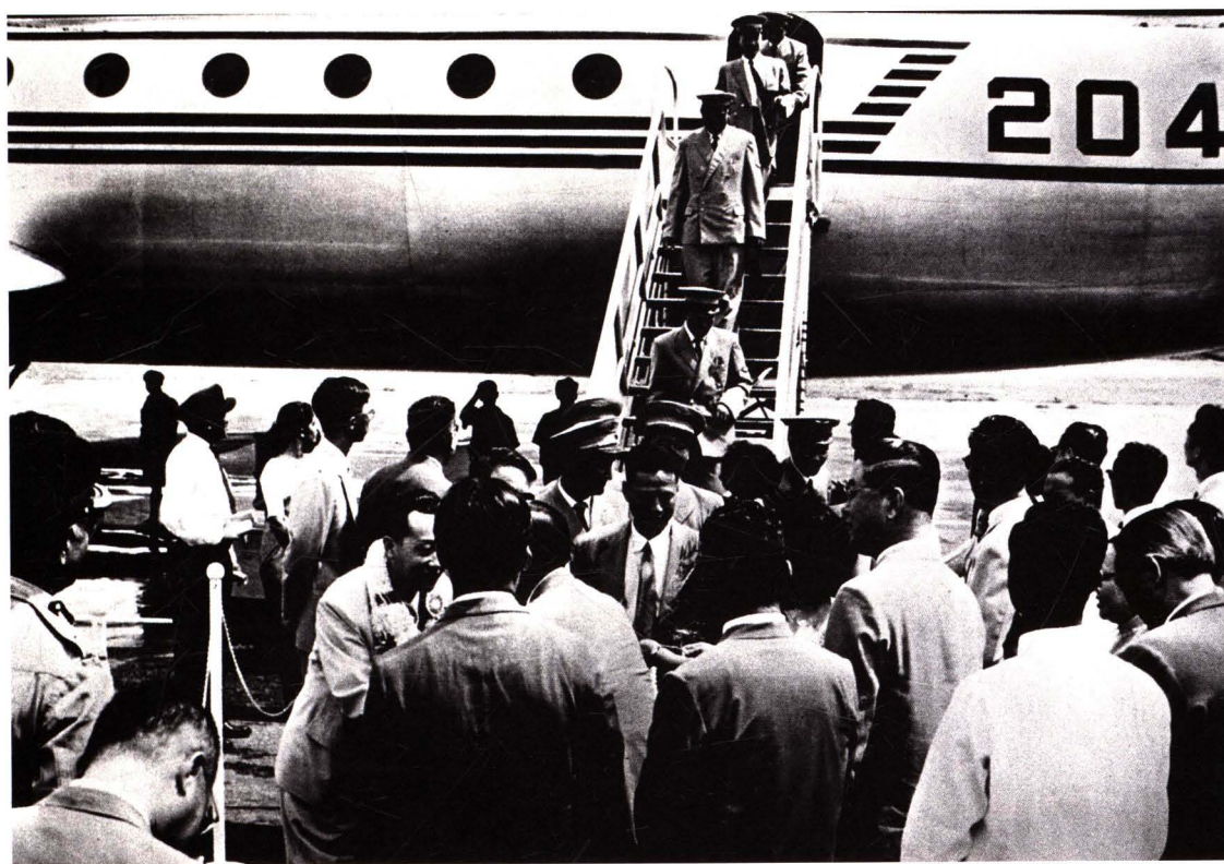
■ 1961年5月29日，民航北京管理局使用伊尔18型204号飞机开辟北京—科伦坡国际航线