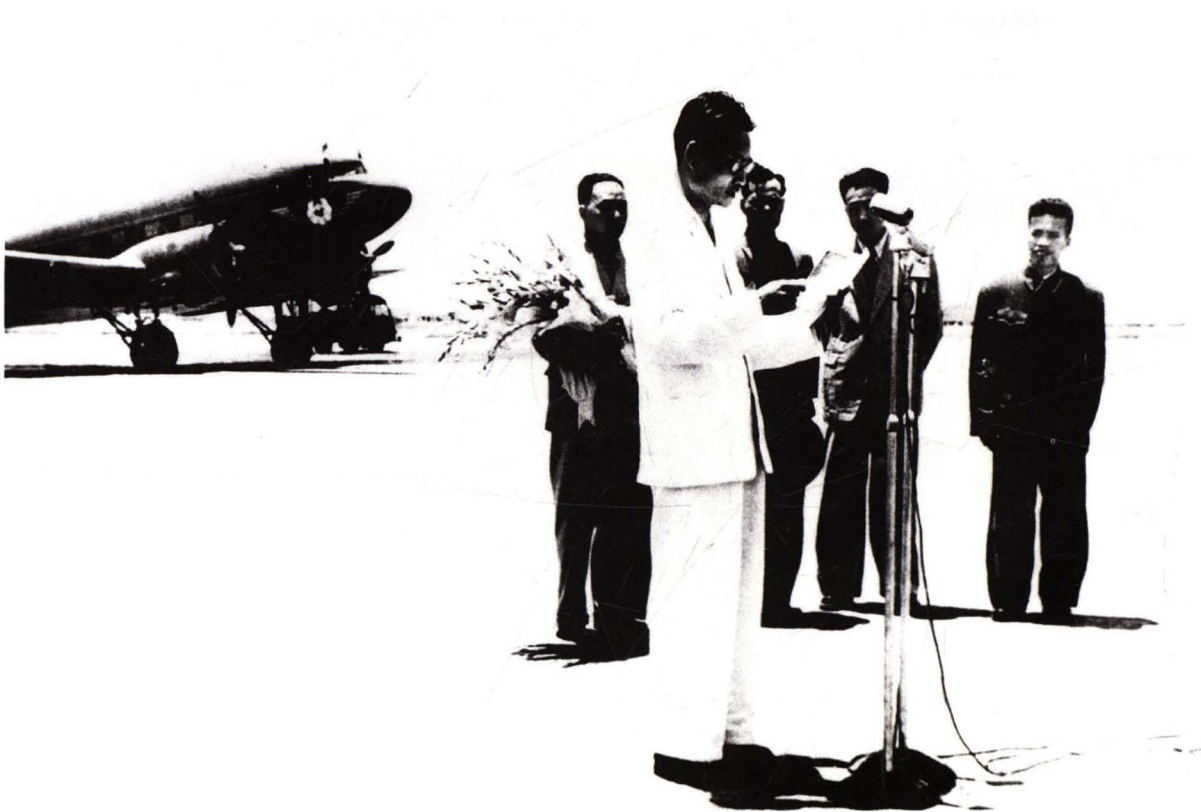
■ 1956年4月12日，民航北京管理处使用伊尔14型飞机开辟北京—越南河内国际航线