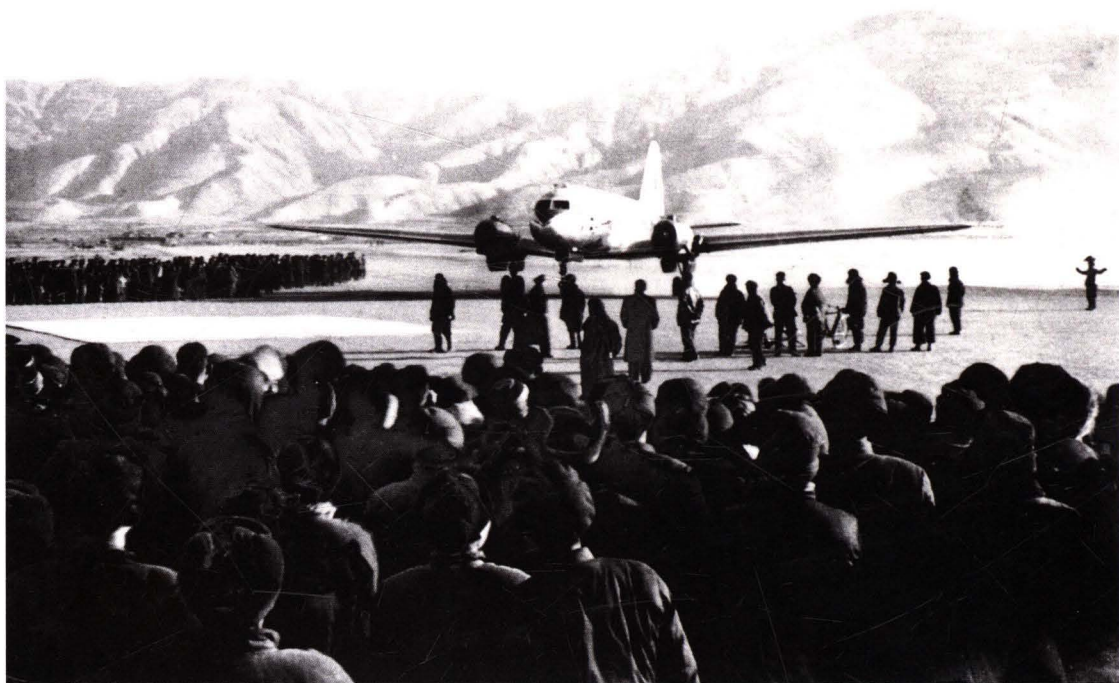
■ 1957年1月4日，民航北京管理处使用里2型飞机开辟北京—青海塔尔丁国内航线