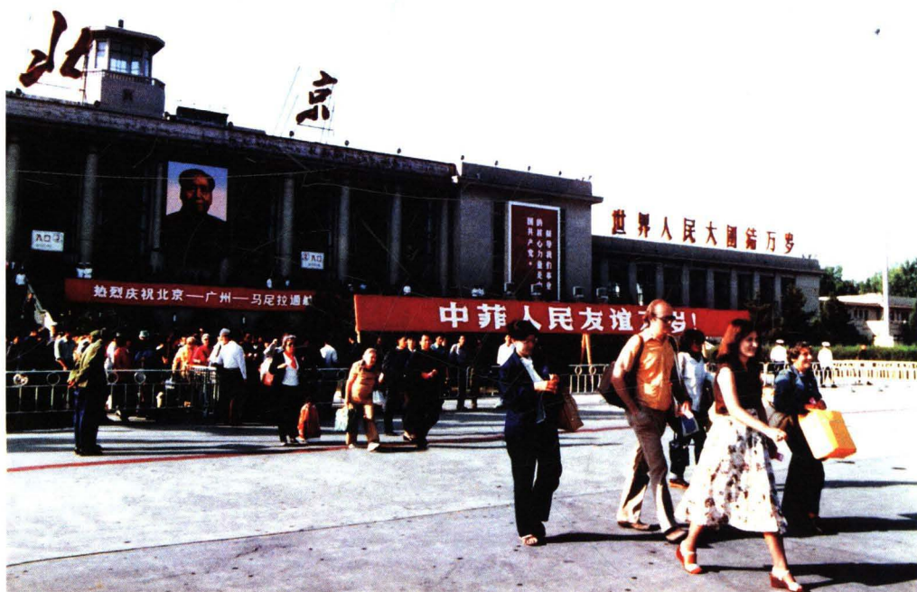
■ 1979年9月4日，民航北京管理局使用波音707型B-2418号飞机开辟北京—广州—马尼拉国际航线