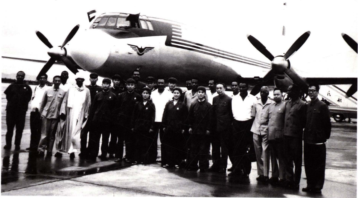
■ 1970年8月13日，民航北京管理局派专机执行外交部长姬鹏飞（前排右六）陪同苏丹共和国革命委员会主席尼迈里（前排左二）访问中国专机任务。图为在北京首都机场与徐柏龄（前排左四）专机组合影