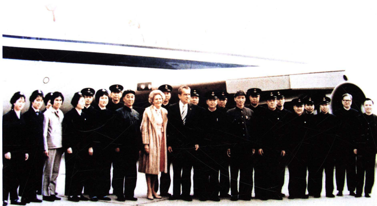
■ 1976年2月18日至28日，民航北京管理局首次派专机执行接送美国前总统尼克松（前排左八）和夫人（左七）第二次访问中国任务，图为尼克松总统在北京首都机场与中国民航第一飞行总队专机组合影