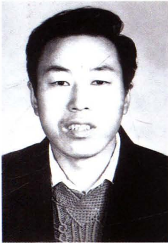
现任中共娄烦县委书记赵润元（山西寿阳）