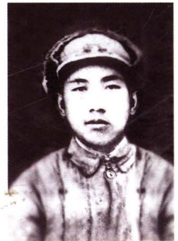
解放战争时期的战斗英雄郝成华烈士(大夫庄)