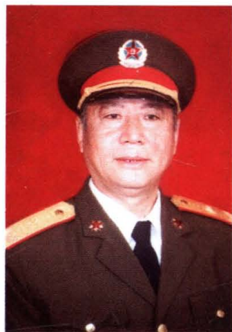
老八路、中国人民解放军少将刘永杰(马家庄)