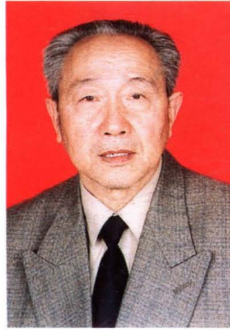
老八路、解放军航天医学研究所副所长(副军)李毓锦(姜家庄)