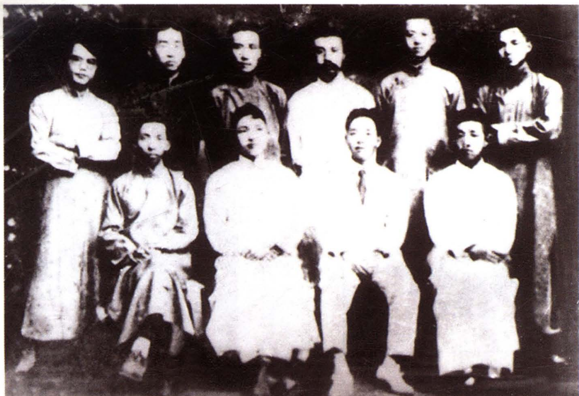
1920年高君宇参加了李大钊发起成立的少年中国学会，图为该会部分会员合影，后排左起第二人为高君宇，第四人为李大钊。