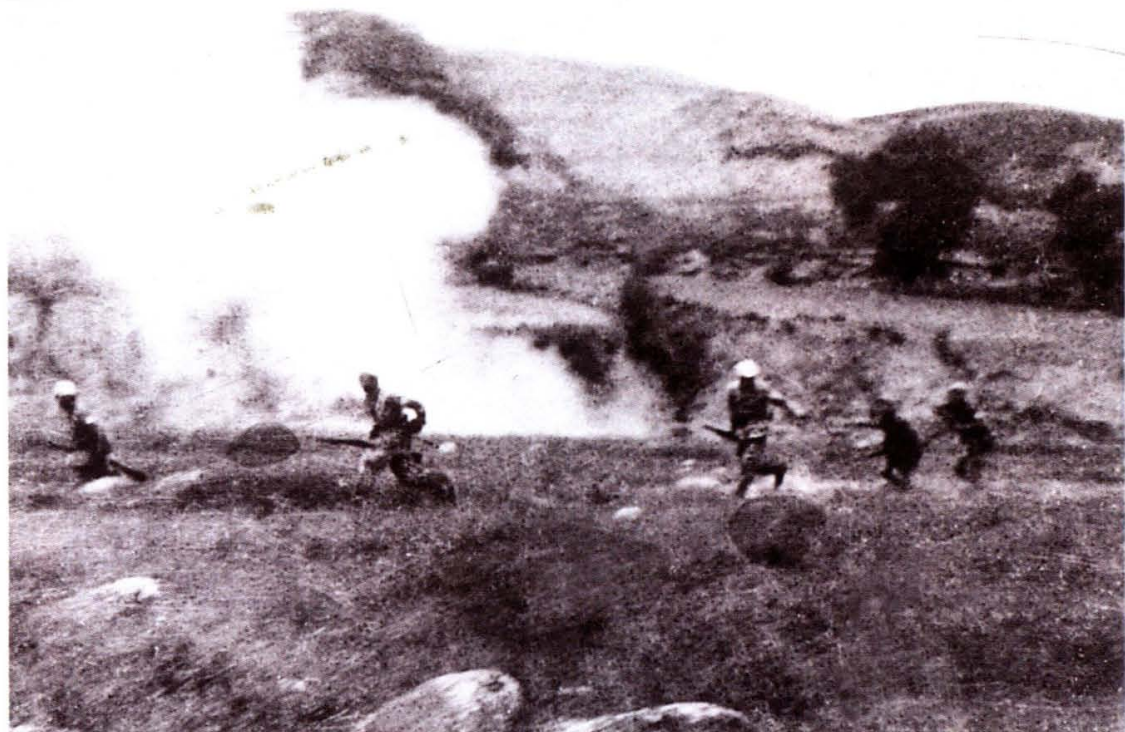
1940年6月八路军一二〇师三五八旅在贺龙师长、张宗逊旅长的指挥下，在娄烦米峪镇地区全歼日本侵略军村上大队700多人。图为米峪镇战斗中，八路军战士向敌人发起冲锋（此片藏于中国人民革命军事博物馆）。