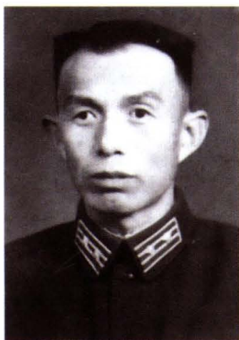
老八路、解放军空军师政委李顿（南峪）