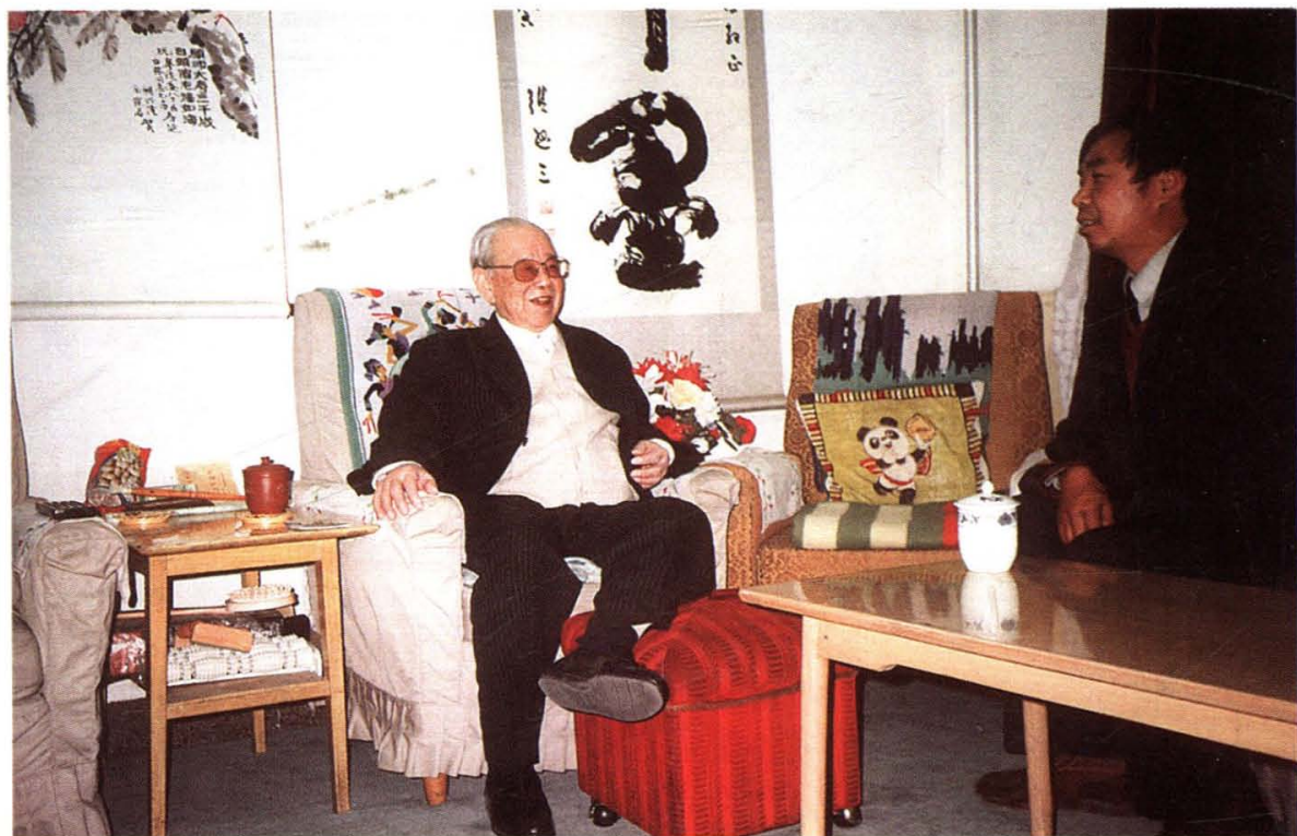
1998年11月24日，全国人大原副委员长廖汉生将军在北京住所接见来自娄烦县的李国成等同志，向他们介绍娄烦县的抗日战争史。