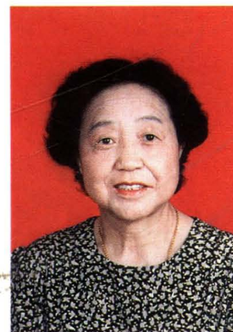
老八路、林海清将军夫人段晓兰（峰岭底）