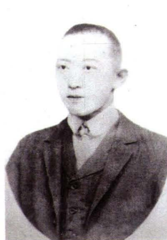
救治八路军伤病员的 爱国中医刘肇津(马家庄)