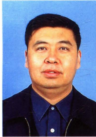
现任娄烦县人民政府县长郭建发（山西清徐）