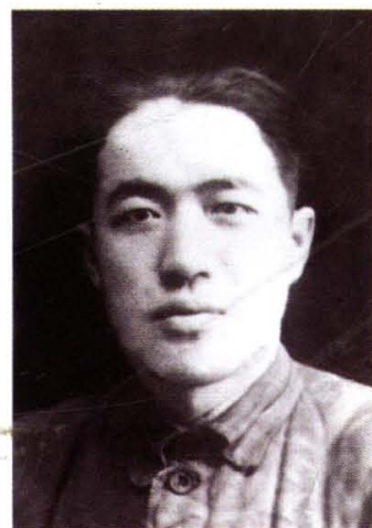
解放太原“八君子”之 一李祥瑞烈士(姜家庄)