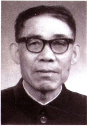
原四川绵阳地委副书记、行署专员段晋昭(庙湾村)