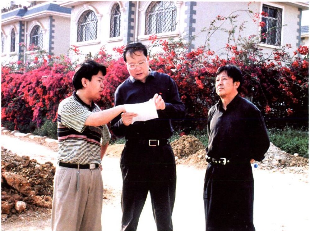
州长助理毛国伟(中)视察州卫生监督所新建办公楼基建工作