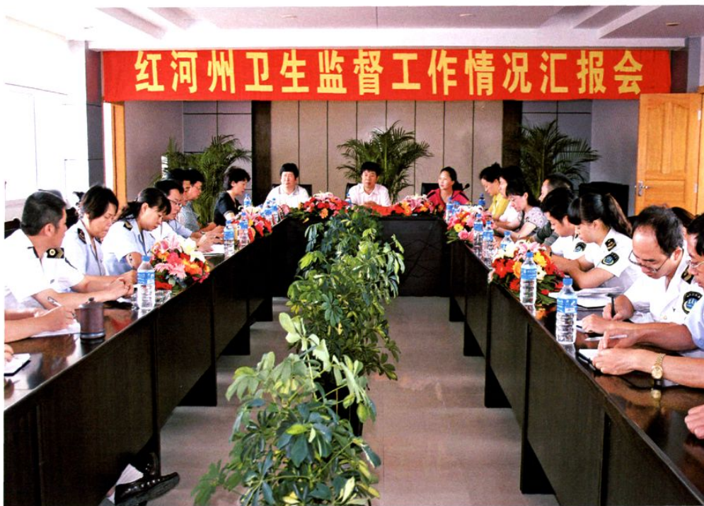
州政协副主席丁润森率调研组对全州卫生监督工作进行专题调研