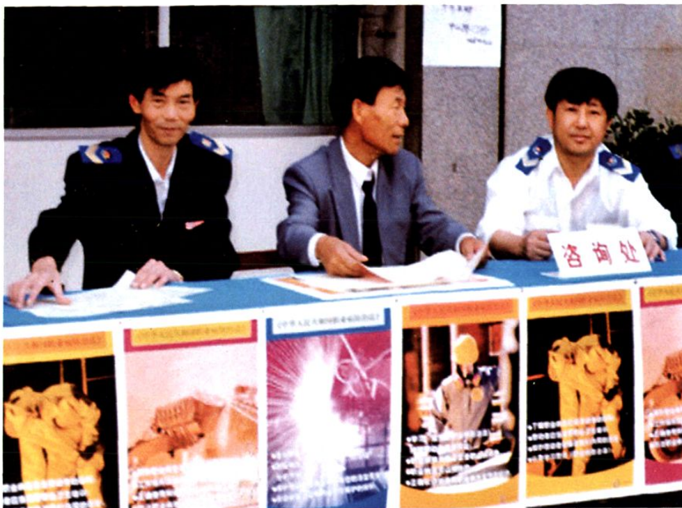
州人大常委会副主任杨臻(中)参加《职业病防治法》宣传周活动