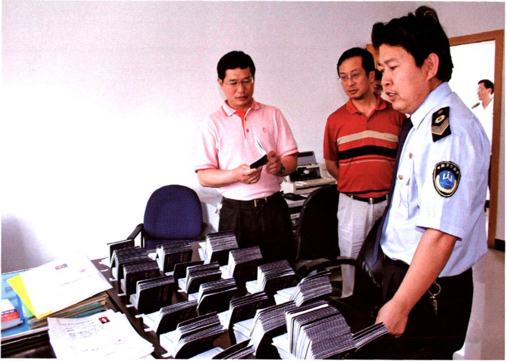
副州长普绍忠(左一)到州卫生监督所调研