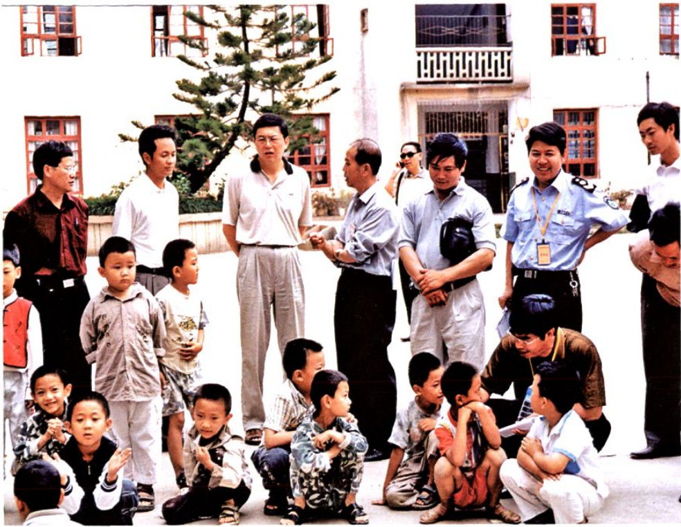
中共红河州委副书记张笑春(后排左三)率督查组督查学校非典防控工作