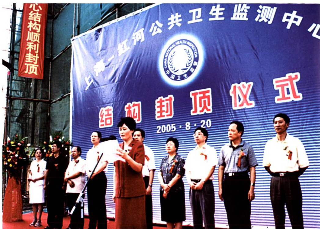
新建办公楼主体结构封顶仪式