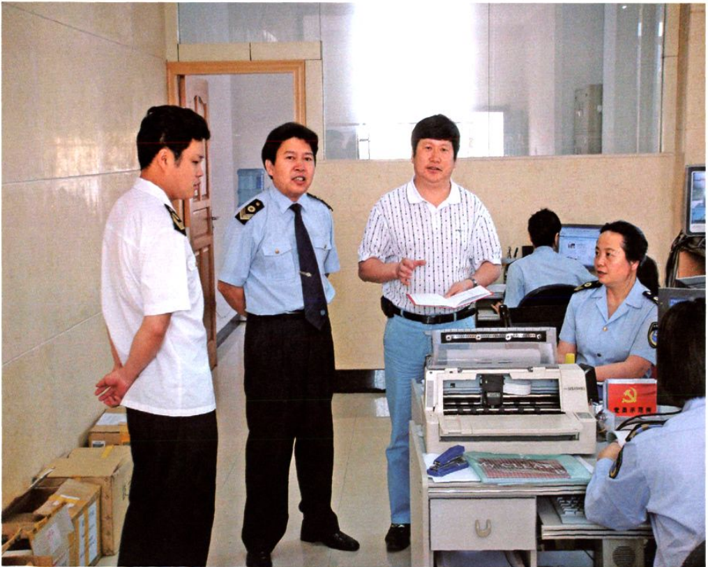
州卫生局党委书记、局长田黎明在州卫生监督所检查指导工作