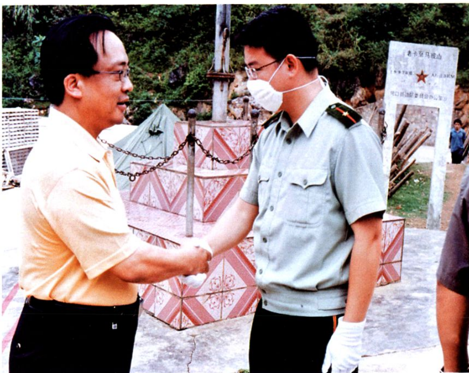
州委常委、副州长李扬在河口老卡边防检查站督查非典防控工作