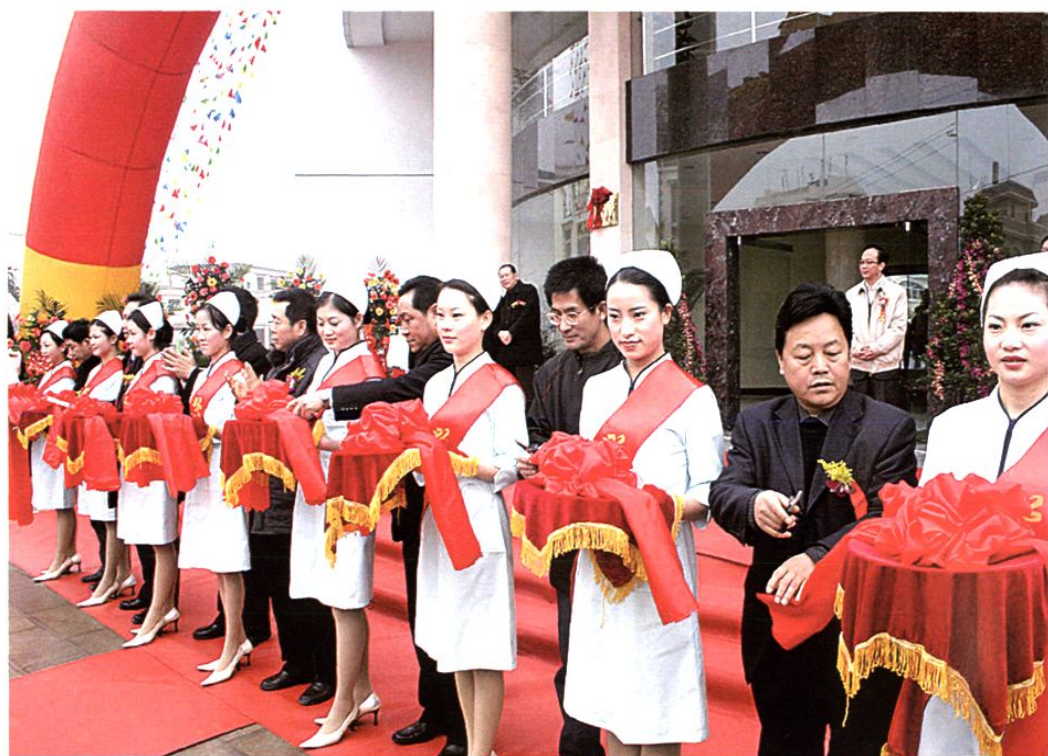
新建办公楼落成剪彩仪式