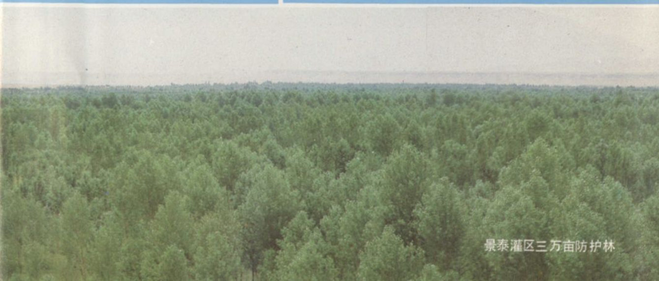
景泰灌区三万亩防护林