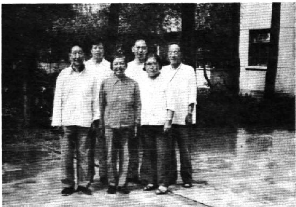
晋宁县纪委历届领导