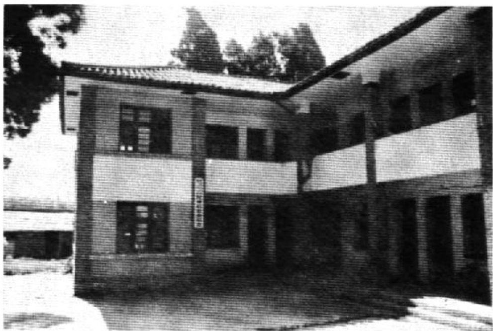
中共晋宁县纪委办公楼