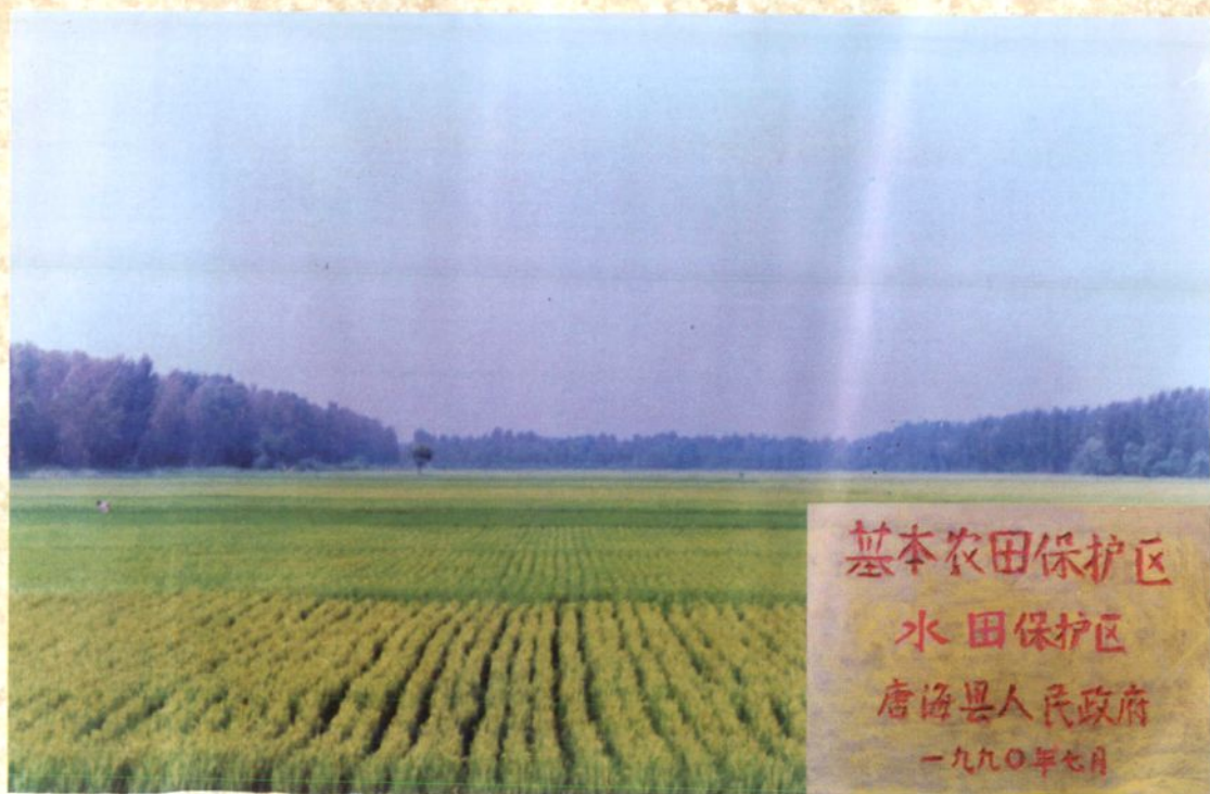
唐海县基本农田保护区