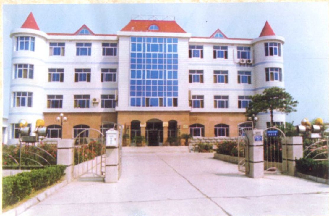
唐海县土地管理局