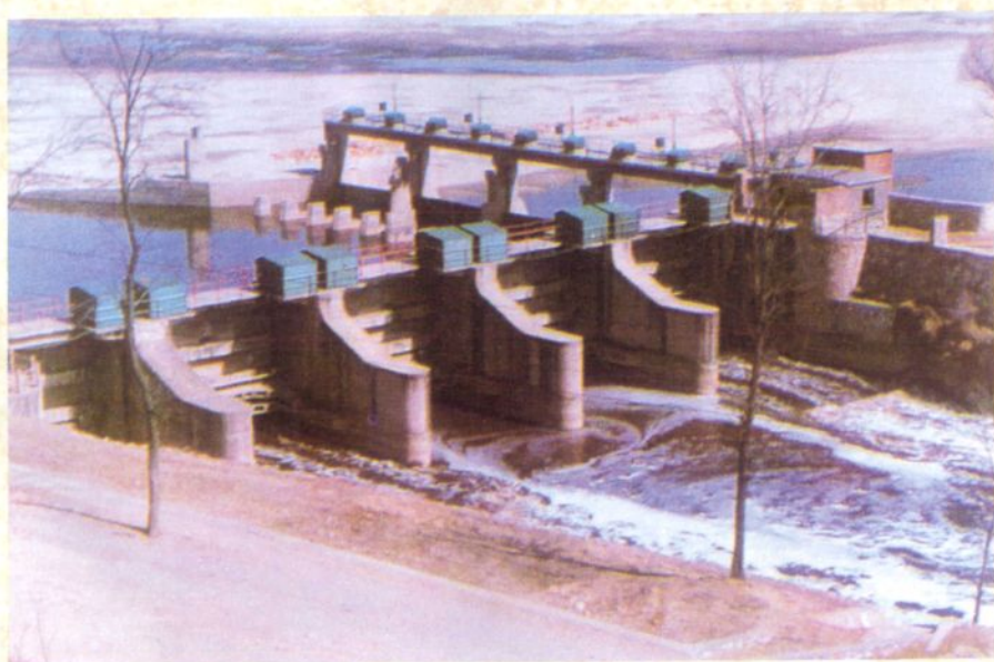
输水总干渠渠首闸