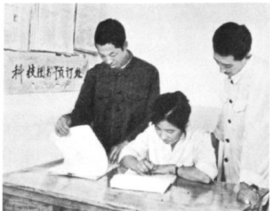
抚宁县店门市部的科技书预订处