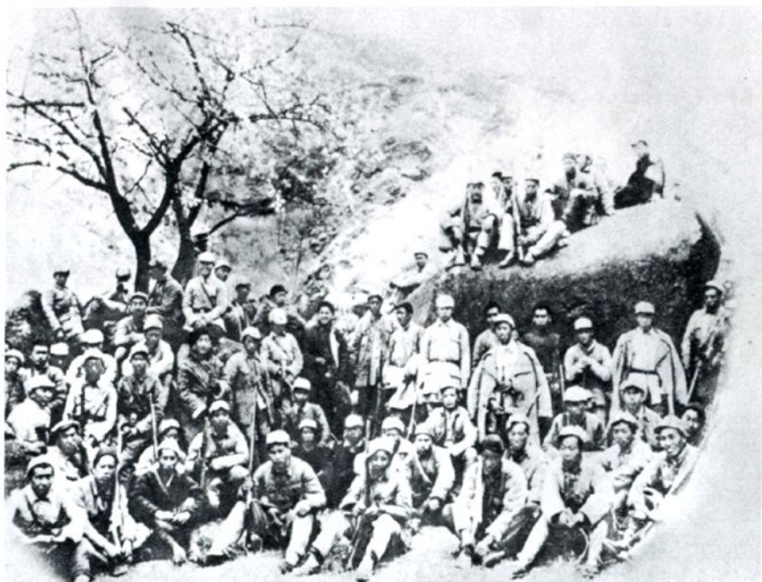
晋察冀新华书店和晋察冀日报社同志共同参加军事训练（1942年）

1944年7月晋察冀日报社出版、由晋察冀新华书店发行的《毛泽东选集》精装合订本（左）和1947年3月晋察冀中央局出版的《毛泽东选集》精装合订本（右）