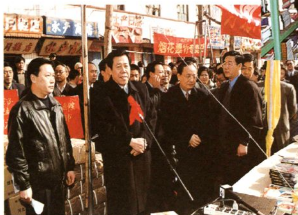
中共河北省副书记赵世居、省委常委、宣传部部长张士儒、河北省新闻出版局局长甄树声在送书下乡活动中的赠书仪式上