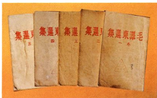
全国第一部《毛泽东选集》，1944年5月由晋察冀日报社编辑出版，晋察冀新华书店发行。图为平装本书影

1944年7月晋察冀日报社出版、由晋察冀新华书店发行的《毛泽东选集》精装合订本（左）和1947年3月晋察冀中央局出版的《毛泽东选集》精装合订本（右）