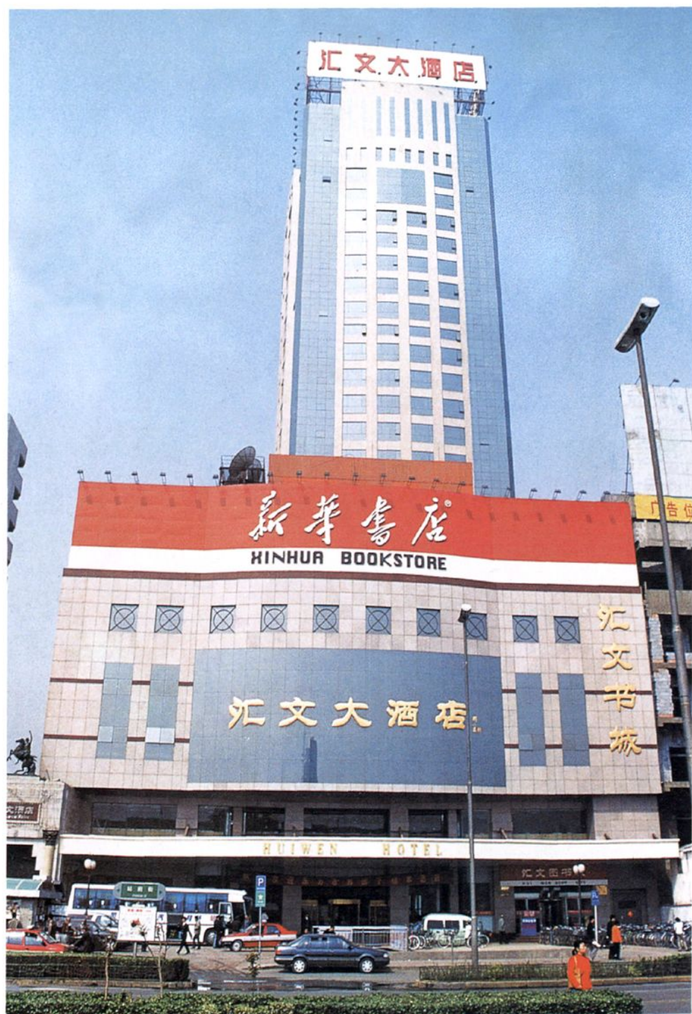
河北省新华书店集团总部