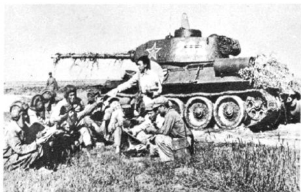
获鹿县店到坦克部队为指战员供应图书