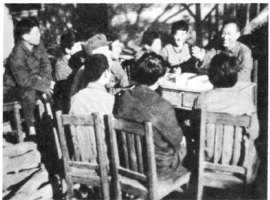
深县书店重视对个体发行员的思想教育，辅导他们多发好书