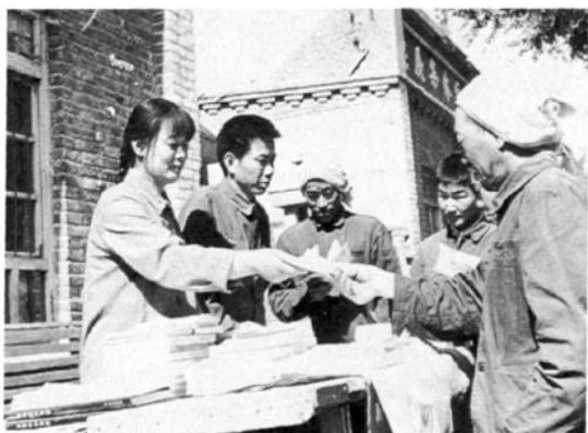
晋县书店设在村镇的售书摊