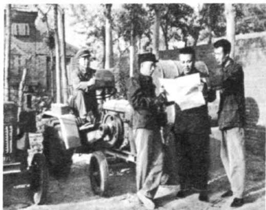
故城县店委托农机系统业余发行员征订科技书