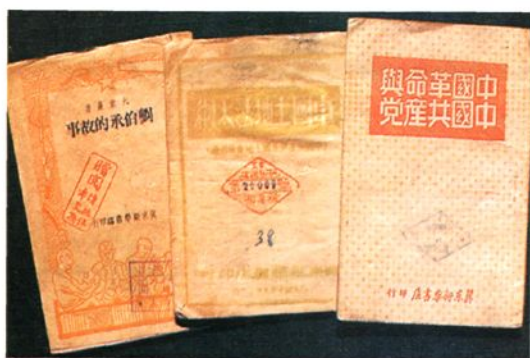
解放战争时期冀东新华书店出版的部分图书