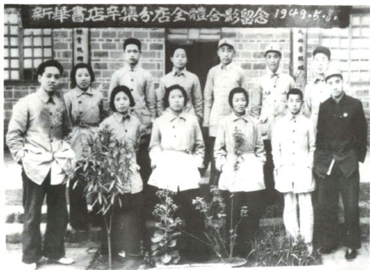
1949年5月8日，新华书店辛集分店全体职工留影