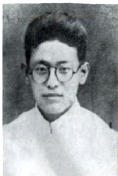
新华书店晋察冀分店首任经理罗军烈士（摄于1937年冀县）