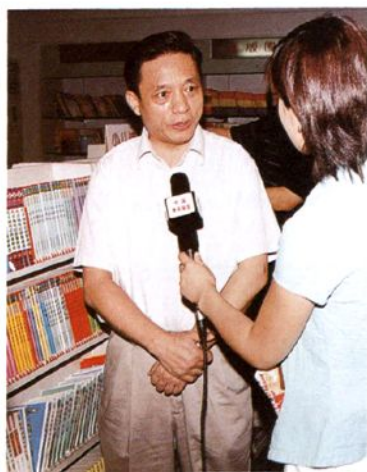
新闻出版总署副署长桂晓风在河北省基层店检查工作时接受当地媒体采访