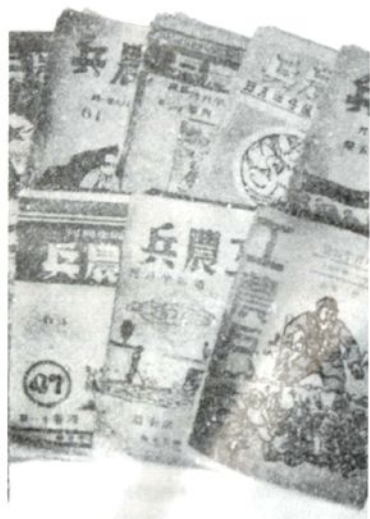
由冀南新华书店编辑出版的《工农兵》杂志，于1946年4月创刊于威县方家营村。图为保存下来的部分刊物