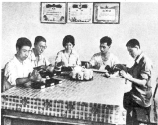
抚宁县店坚持业务练兵