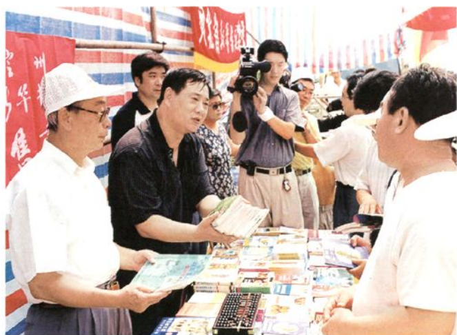
1999年8月，在“‘服务三农’全国农村图书大联展”活动中，新闻出版署出版物发行管理司司长王俊国（左二）、中国书刊发行业协会秘书长徐家祥（左一）深入售书棚了解农村读者购书、用书情况