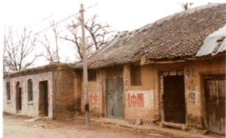
1941年5月5日，新华书店晋察冀分店在灵寿县陈庄镇成立，图为分店旧址（2000年）

1941年7月23日罗军牺牲，安葬于灵寿县陈庄镇旁。1971年4月，烈士遗骨迁回故乡重新安葬，当年书店职工为烈士所树墓碑也运回冀县立于罗军墓前，图为罗军烈士之墓