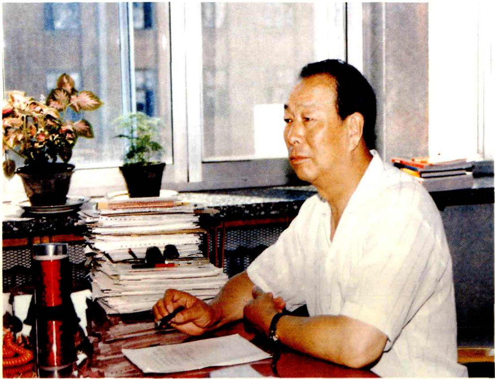
内蒙古自治区副主席刘作会题词