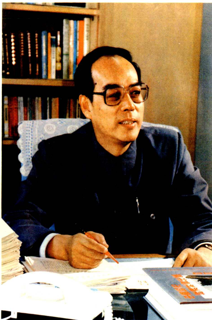
包头市委书记袁明铎题词