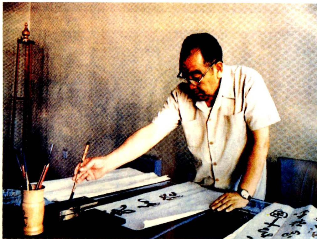
内蒙古自治区主席布赫题词