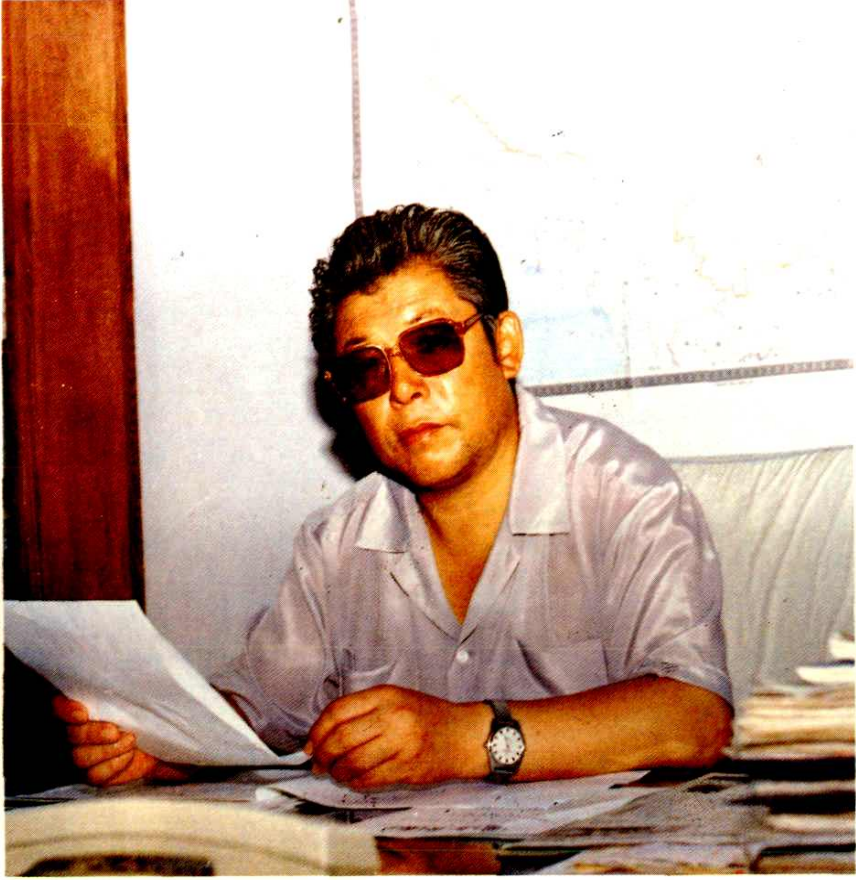
包头市市长王凤岐题词