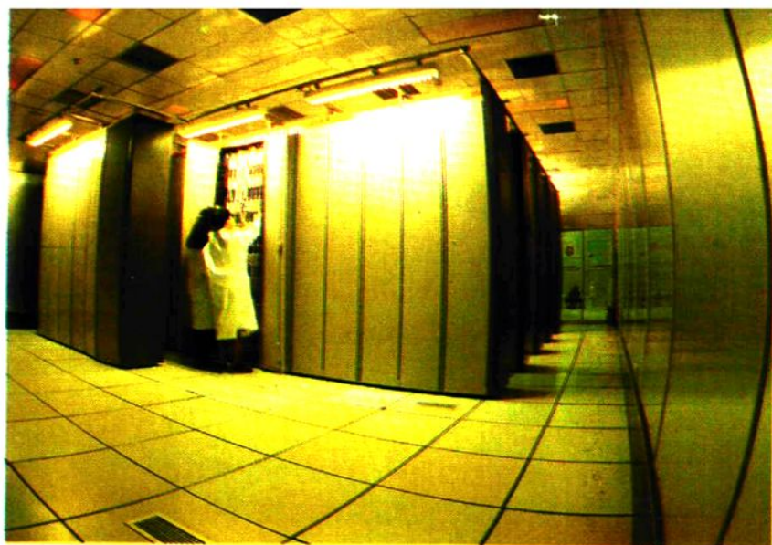
◁ 数字程控电话机房