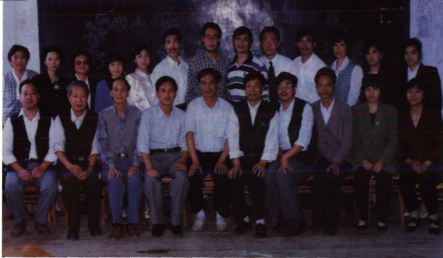
全县小学教师基本功竞赛评委与教委领导合影