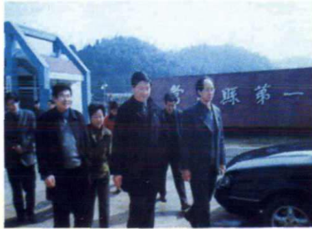
省教育厅副厅长张绪培 「前右二」视察常山一中