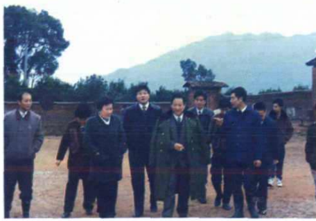
省教委主任陈文韶 「前右二」视察龙绕初中