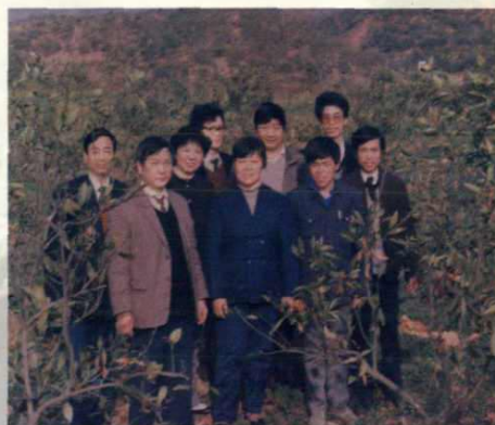
市教委主任王仙芝「前右二」 视察芳村农中劳动基地