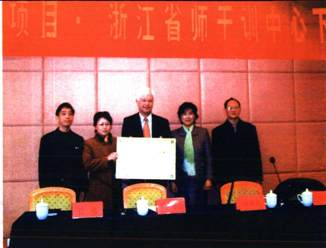
县教师进修学校是德国汉斯·赛德尔基金会与浙江省教育厅合作项目——浙江省教师培训中心下设机构 该项目已进行六期合作