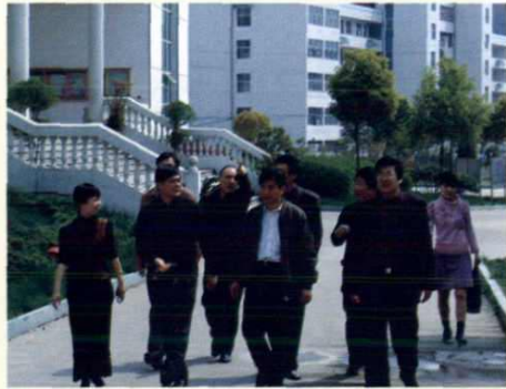
省教育厅副厅长鲍学军 「前右二」视察常山教育