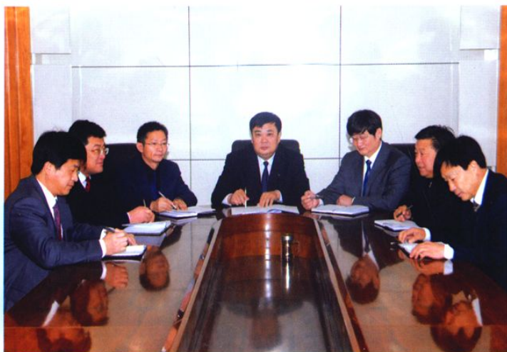
奋发有为的领导班子