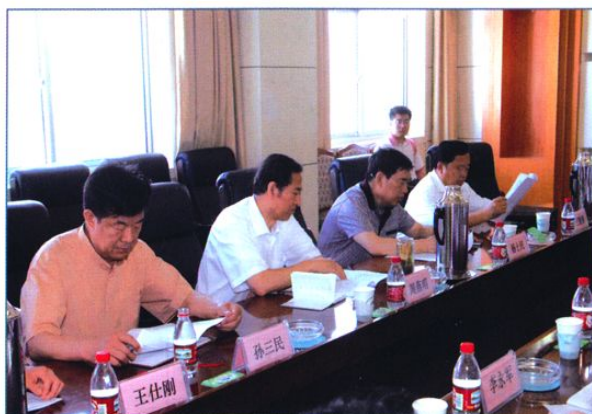
东营市人大常委会第一副主任周燕明(左三) 在市水利局调研。