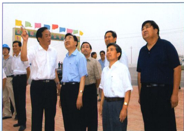
西藏自治区党委书记张庆黎(右三)、甘肃省副省长石军(右四)视察水利工程。