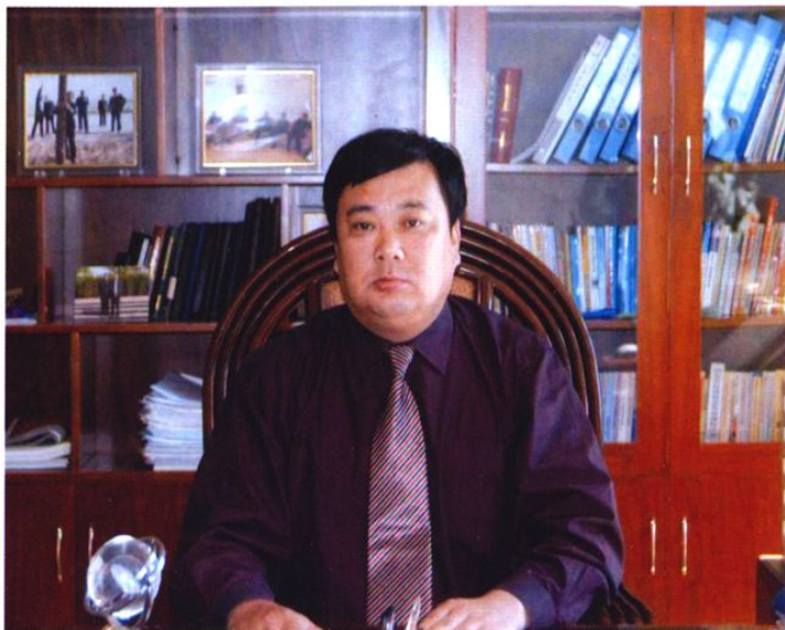
东营市水利局党组书记、局长黄梅芳