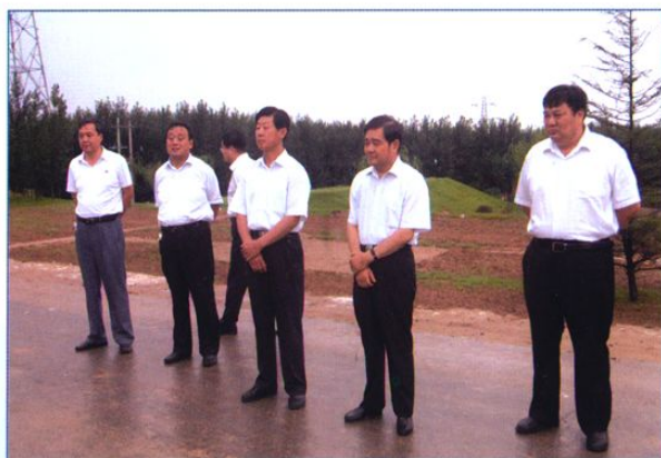
东营市人大常委会副主任崔兆武(右三)视察 水利工程。