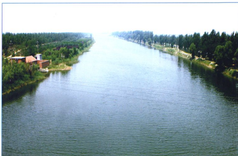
支脉河绿色长廊工程