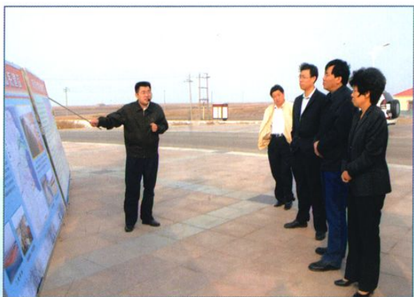
山东省水利厅厅长杜昌文(右二)视察水利工程。