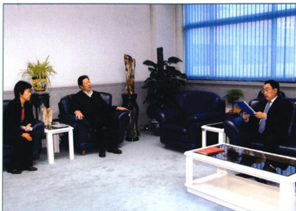
水利部部长陈雷(右)会见东营市领导。