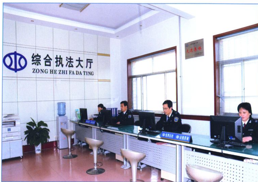
现代化的综合执法大厅