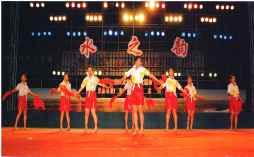
丰富多彩的职工文艺生活