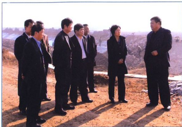
中共东营市委常委、副市长吕雪萍(右二) 视察水利工程。