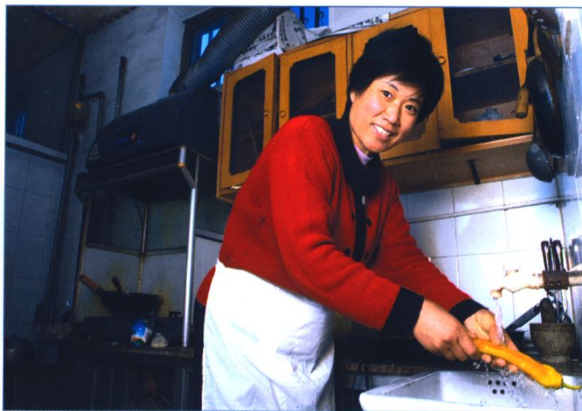
农村安全饮水工程