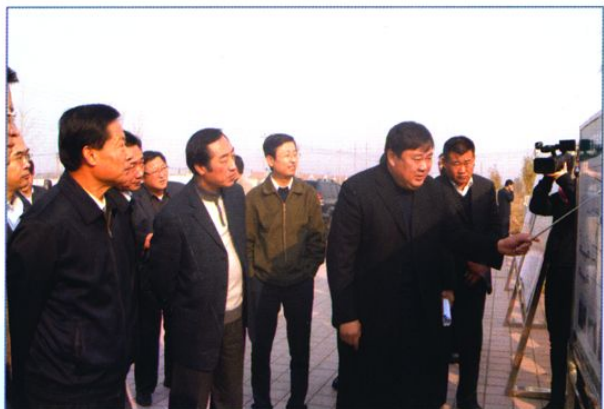
东营市政协主席于树健(前左一)视察水利工程。