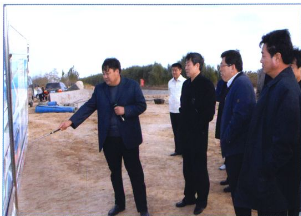
中共东营市委书记张秋波(前左二)视察黄河水城治理工程。