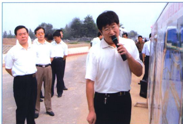
中共东营市委副书记刘曙光(左一)视察水利工程。