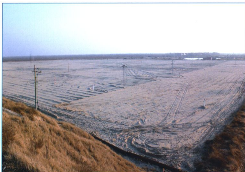
黄河南展区房台拓展工程