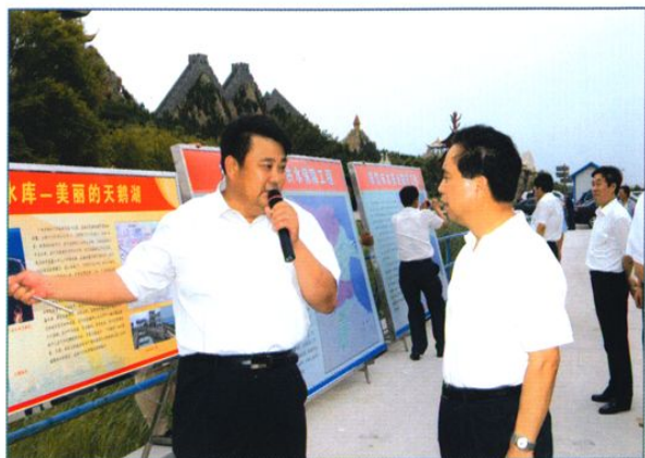
全国人大常委会副委员长李建国(前右)视察水利工程。