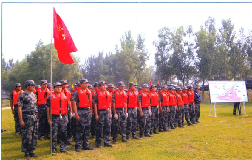
防汛抢险队伍建设