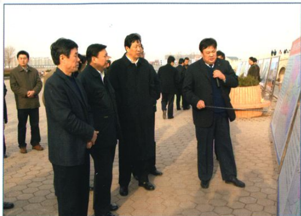
中共山东省副书记、省长姜大明(前右三)视察水利工程。