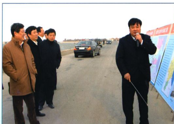
国家发改委副主任杜鹰(左一)视察水利工程。