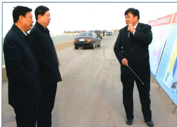
中共山东省委书记姜异康(左二)、省长姜大明(左一)视察水利工程。