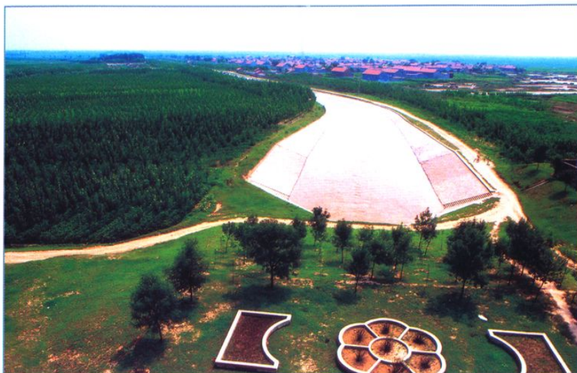
灌渠节水改造工程