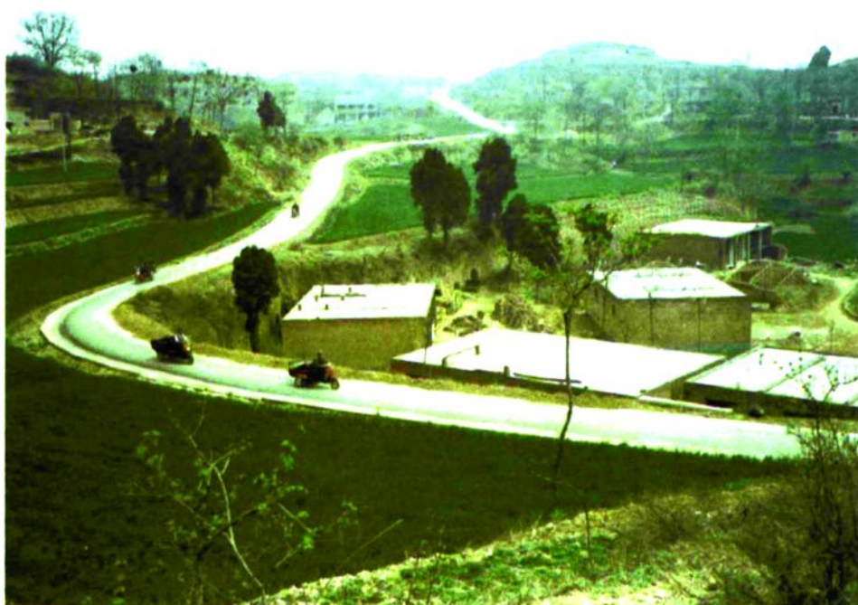
图6 村中水泥硬化公路