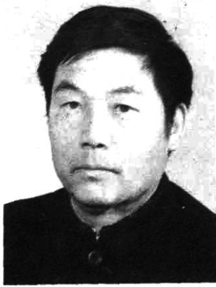
程盛世 1981年6月至1986 年2月期间任副厂长。