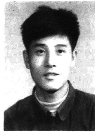
方可 1983年6月任厂长 助理，1984年8月任副 厂长。