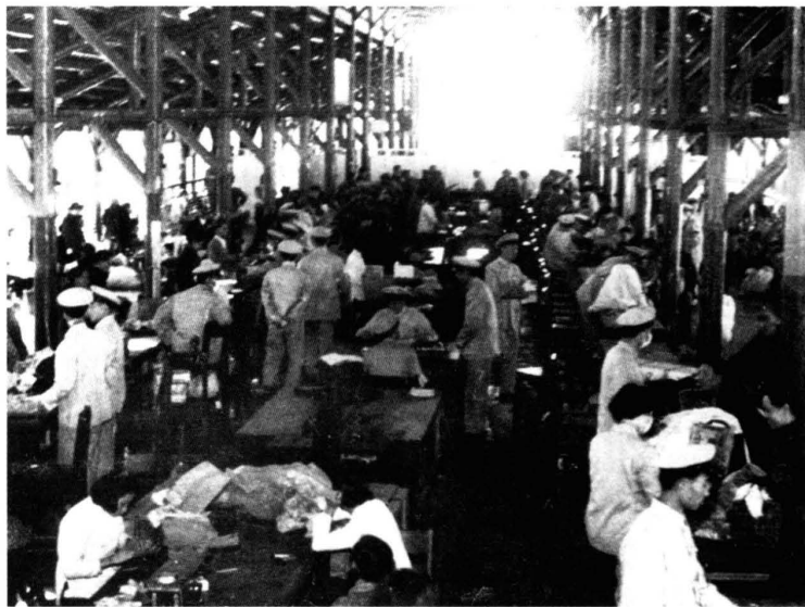
图 3-4-1-4 1957年，九龙海关关员在检查大厅检查旅客行李物品

1958年，全国海关关长会议作出《关于加强旅客行李物品检查工作的决议》，提出不能因为要防止漏掉少数走私破坏分子而对所有进出境物品不加区别，一律细查细验。