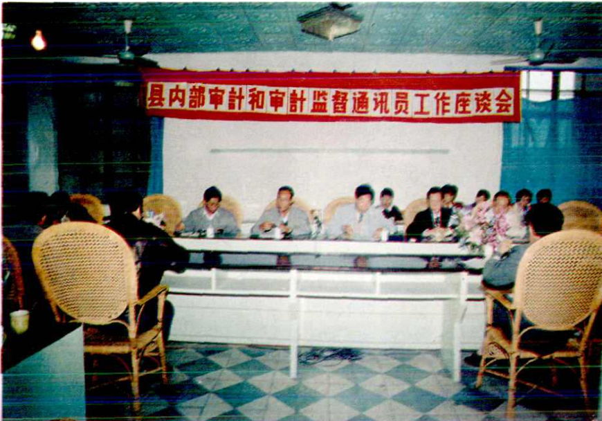
连江县审计局召开内审和审计监督通讯员会议