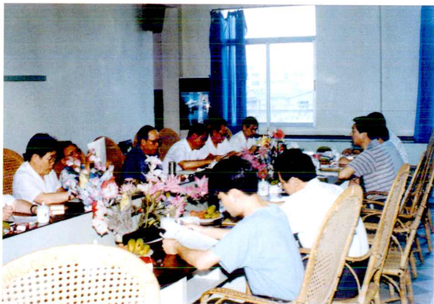
福州市人大领导来我县视察审计工作