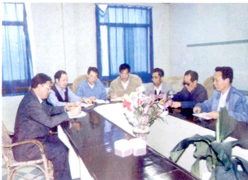
连江县审计局召开局务会议研究修改《审计志》