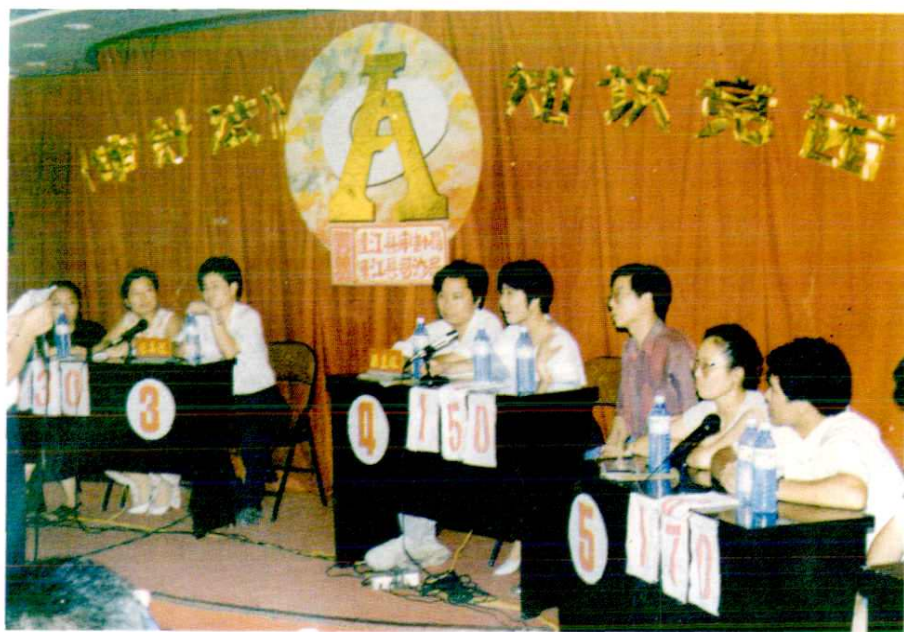
连江县审计局开展《审计法》知识竞赛活动场面