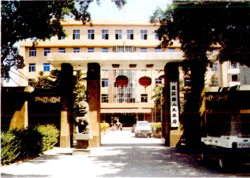
连江县审计局办公地址在县政府四层楼