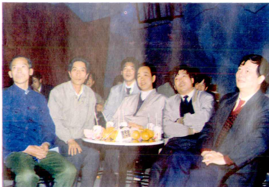
福州市审计局在连江县召开市基建审计工作会议，市审计局局长商光秀（右一）、县委书记叶家松（中）、县长林学忠（右二）、市局副局长黄鸿铭（左一）及县审计局局长邱吉雄、副局长林英灯在座（左二、三）