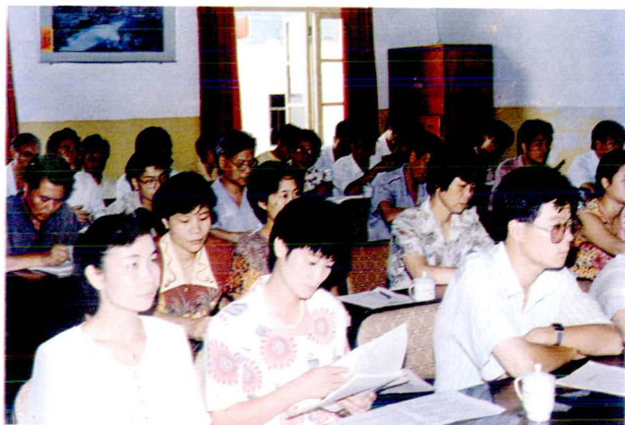
一九九五年七月县直有关财会负责人参加《审计法》测试