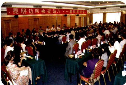
2010年8月3日，昆明边防检查站八一警民座谈会