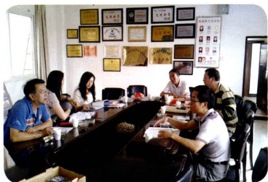
民政福利企业年检