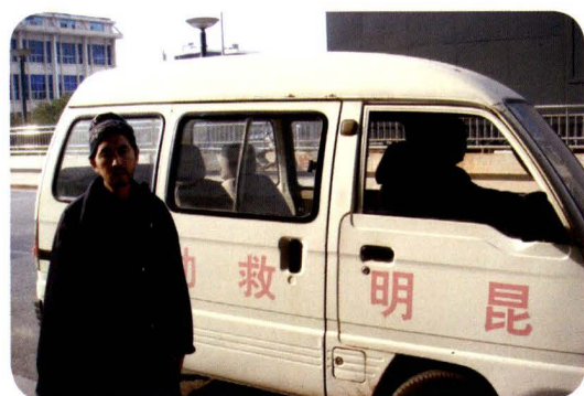
救助流浪乞讨人员