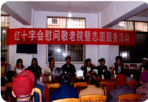
红十字会慰问敬老院暨志愿服务活动