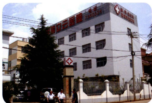
走访民办非企业单位