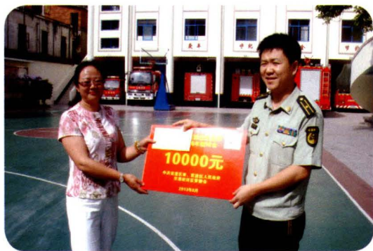
2013年8月，区民政局慰问驻区部队