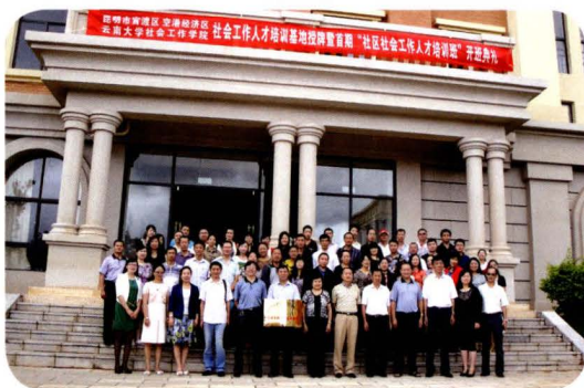
社工培训基地授牌