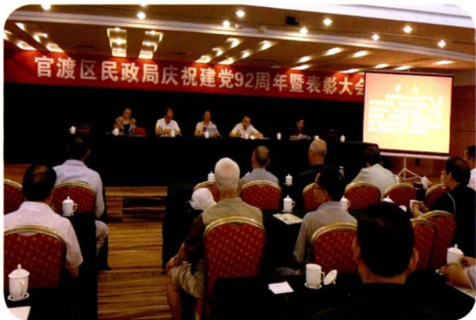
区民政局庆祝建党92周年暨表彰大会