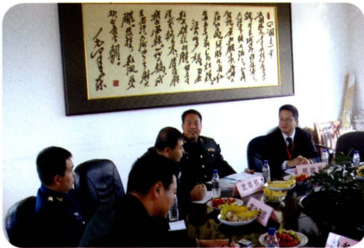
2007年12月，区人武部、区民政局走访驻区部队