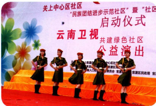
驻区部队参与关上中心社区建设