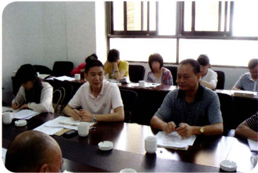
2012年6月8日，社会救助工作会议