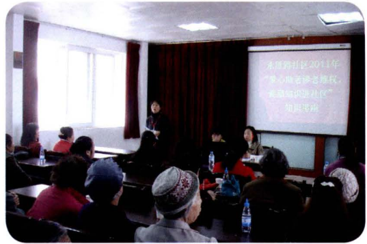
太和街道永胜路社区老年知识讲座