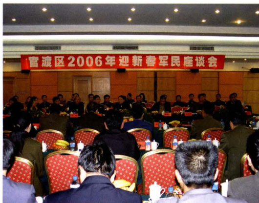
2006年迎新春军民座谈会