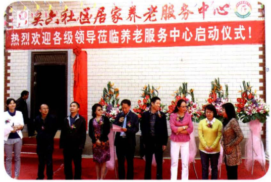
矣六社区居家养老服务中心启动仪式