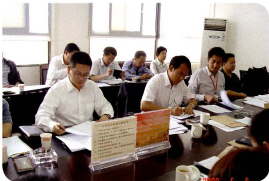
2009年5月6日，流浪乞讨人员救助工作会议