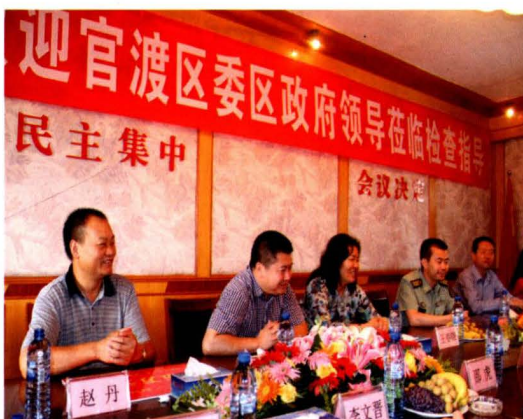
2012年7月26日，官渡区“八一”拥军慰问团慰问驻区部队