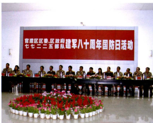
建军八十周年国防日活动