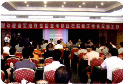
2009年9月6日，省考核组考核官渡区双拥工作