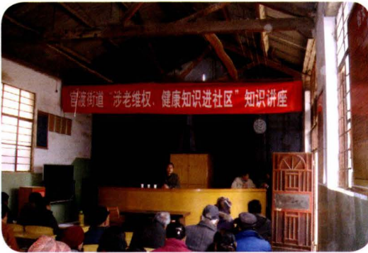
官渡街道“涉老维权、健康知识进社区”