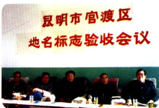
市地名主管部门到本区验收地名标志