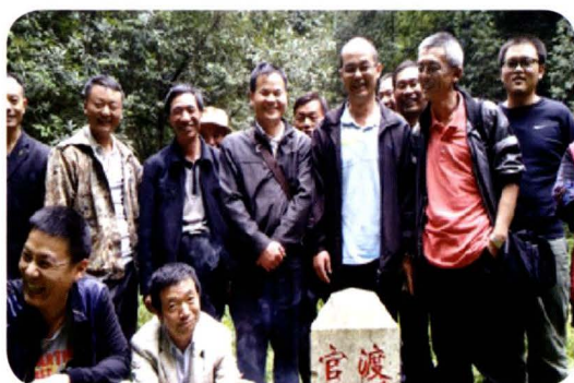
开展官-盘线界线联检工作