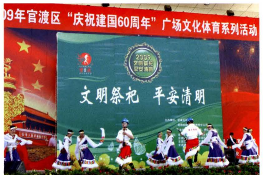
“文明祭祀、平安清明”宣传活动