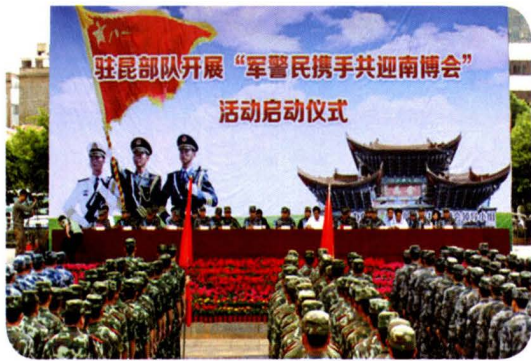
2013年5月30日，军警民携手共迎南博会启动仪式