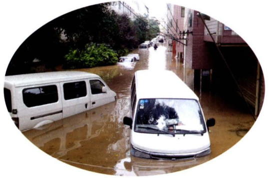
2013年7月19日昆明暴雨，陈家营水灾救援现场