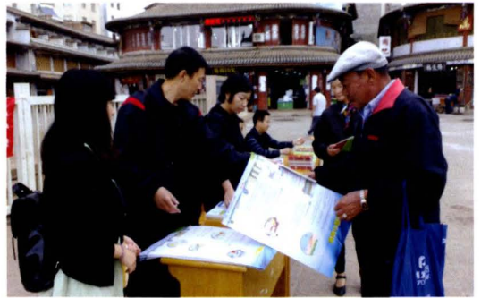
开展防灾减灾宣传