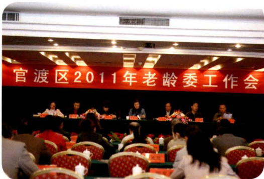
2011年2月28日，官渡区老龄委工作会议