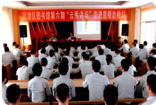
2013年5月30日，官渡区图书馆“云秀讲坛”走进军营