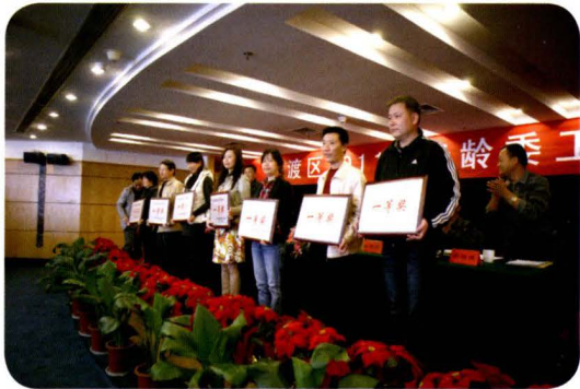
表彰老龄工作先进集体和个人