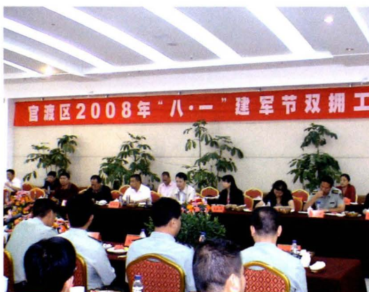
2008年“八一”建军节双拥座谈会