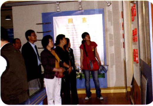
媒体采访福保村老龄工作