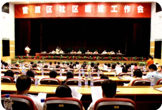
2007年8月，官渡区社区建设工作会