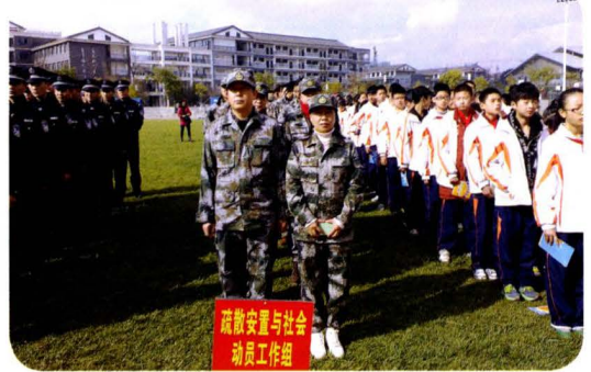
组织自然灾害救助应急演练