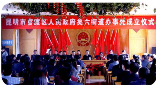
2007年12月，矣六街道办事处成立