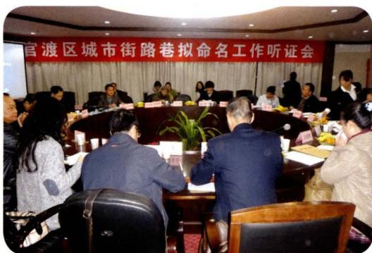
城市街路巷拟命名工作听证会