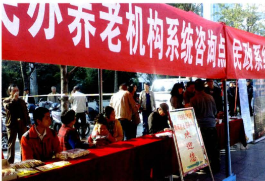
开展养老服务咨询