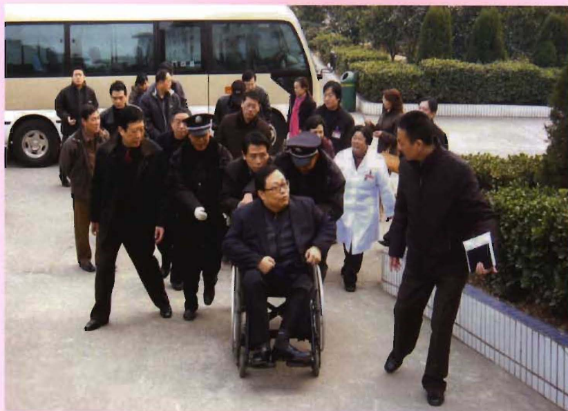
2005年12月，中残联常务副理事长吕世明（右二）来院检查指导工作