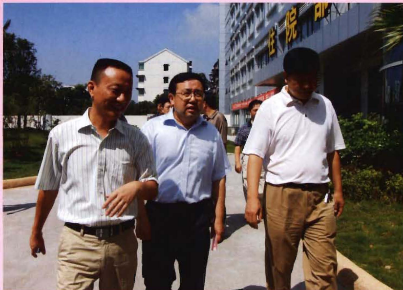
2009年7月，市政府副市长王国斌（中）来院检查指导工作