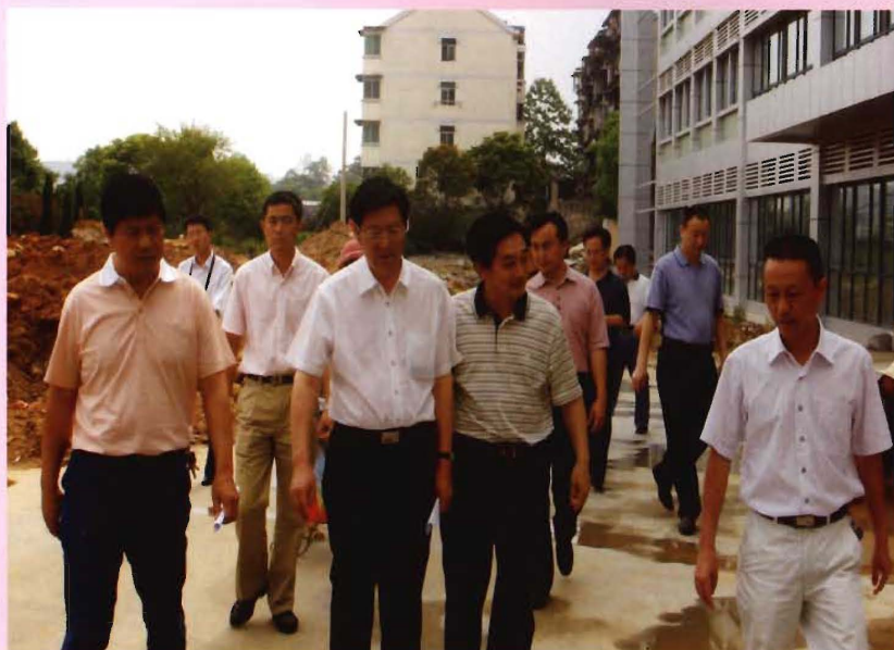
2008年5月，省民政厅厅长谢松保（前左二）来院检查指导工作