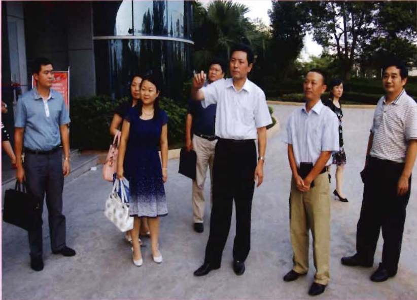
2011年8月,省民政厅副厅长万幼清(右三)来院检查指导工作