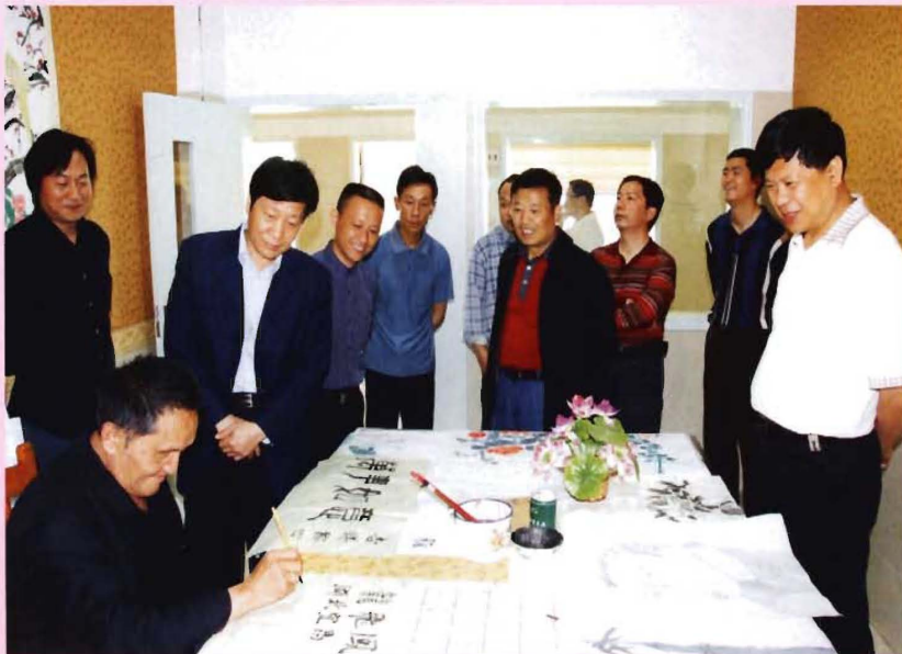
2009年5月,省民政厅副厅长陈吉学(左三)来院检查指导工作