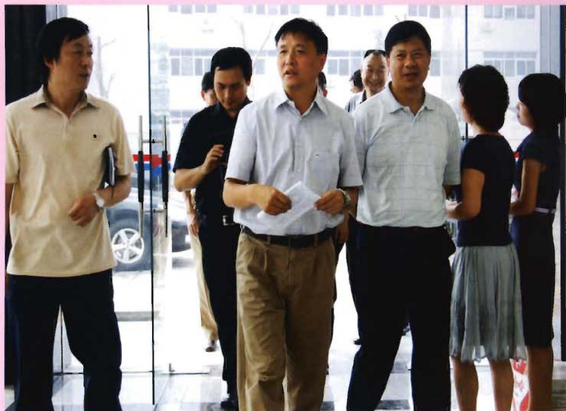
2008年5月,市委副书记李亚隆(前中)来院检查指导工作