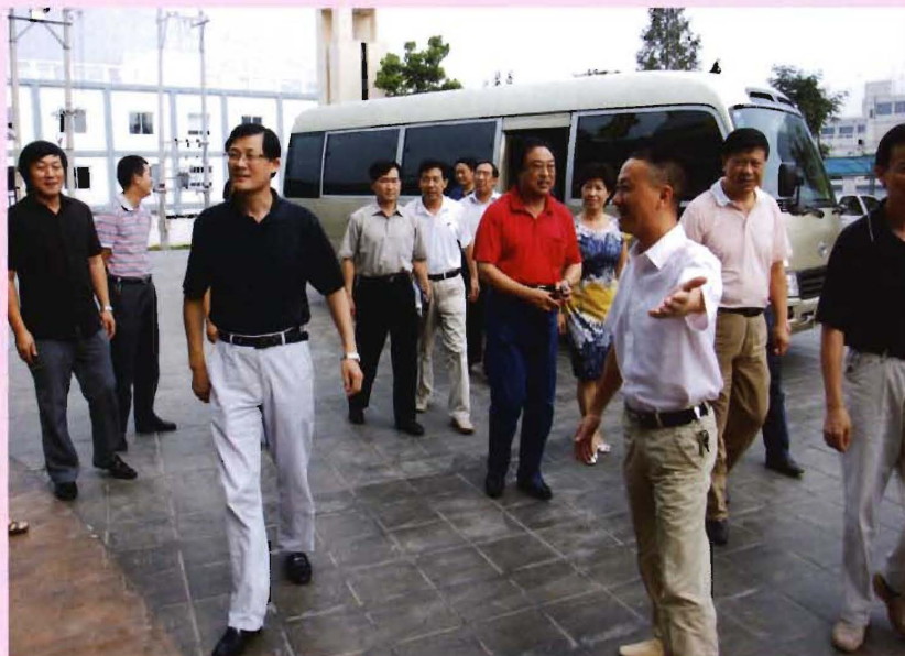
2009年8月,市人大副主任艾苍松(前左一)来院检查指导工作