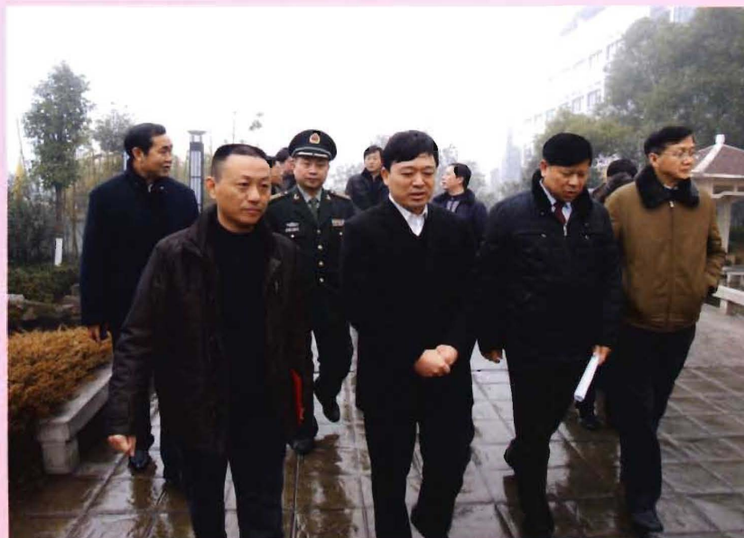
2010年2月,中共宜昌市委书记郭有明(前排左二)、市政协主席李泉(前排右一)、军分区政委闵捷(后排左二)来医院慰问住院患者