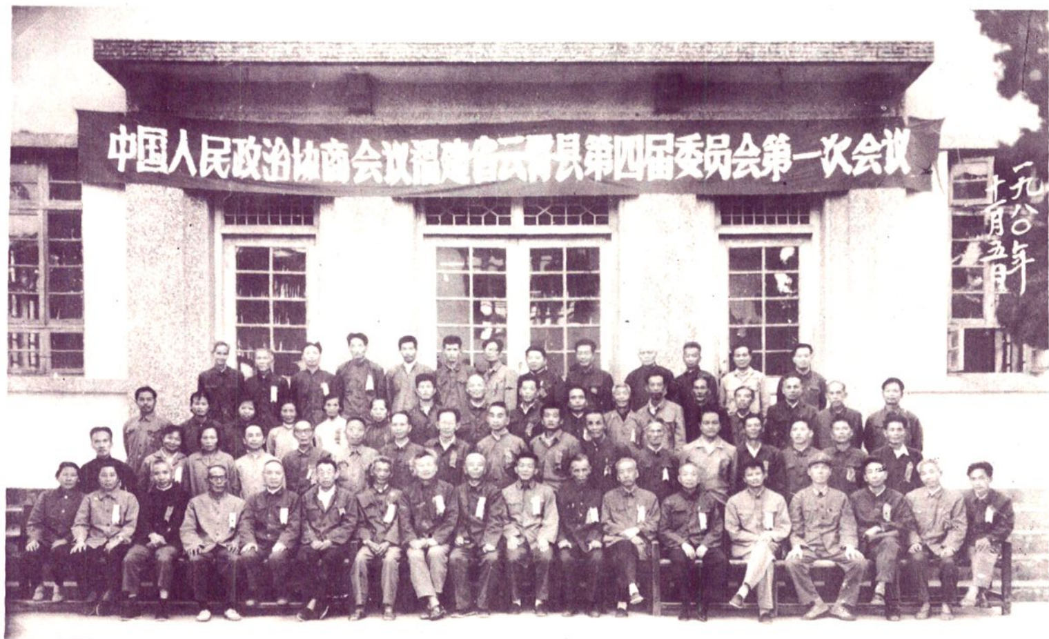
1980年10月28日,中国人民政治协商会议福建省云霄县第四届委员会第一次全体会议在县革命委员会会议厅隆重开幕。图为与会者合影。