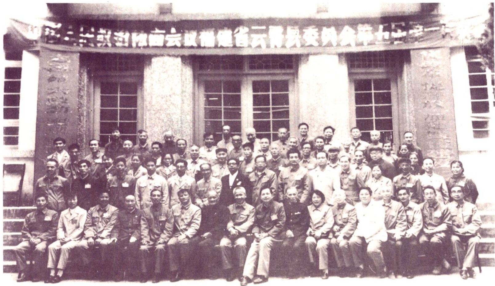
1984年12月13日,中国人民政治协商会议福建省云霄县第五届委员会第一次全体会议在县人民政府会议厅开幕。图为与会者合影。