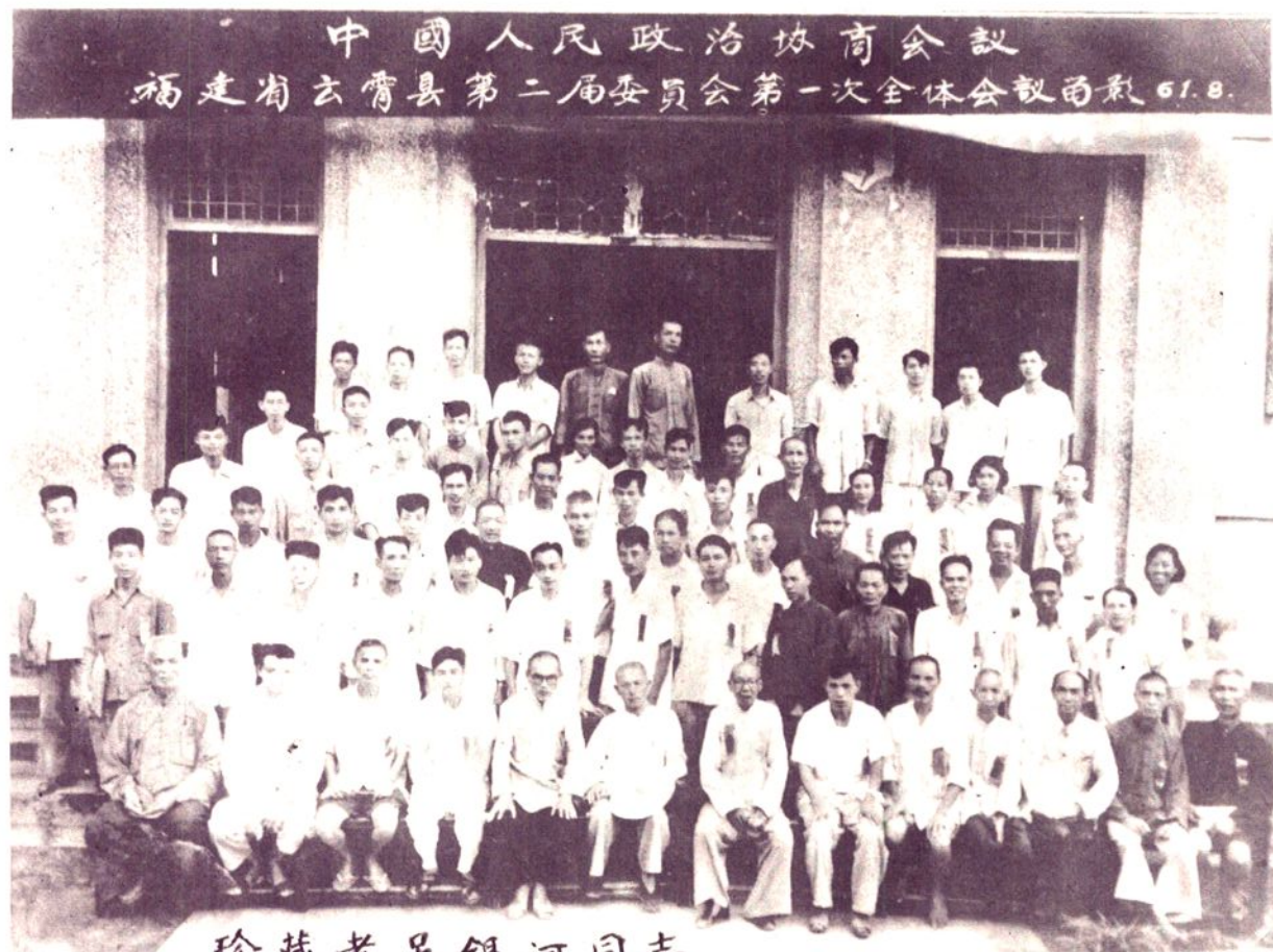
1961年9月2日,中国人民政治协商会议福建省云霄县第二届委员会第一次全体会议在县人民委员会会议厅隆重开幕。图为与会者合影。