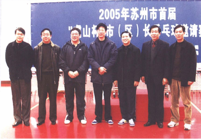
2005年1月1日，苏州市委常委、宣传部部长徐国强（中）在常熟地税局乒乓球馆参加苏州市首届虞山杯市（区）长乒乓球邀请赛后，与常熟地税局领导合影