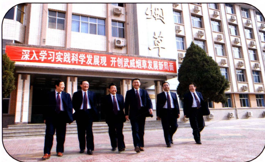
武威市烟草专卖局(公司) 领导班子(2008年)