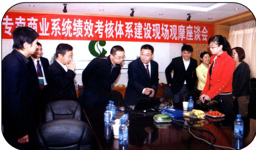
甘肃省烟草专卖商业系统 绩效考核现场会在武威召开