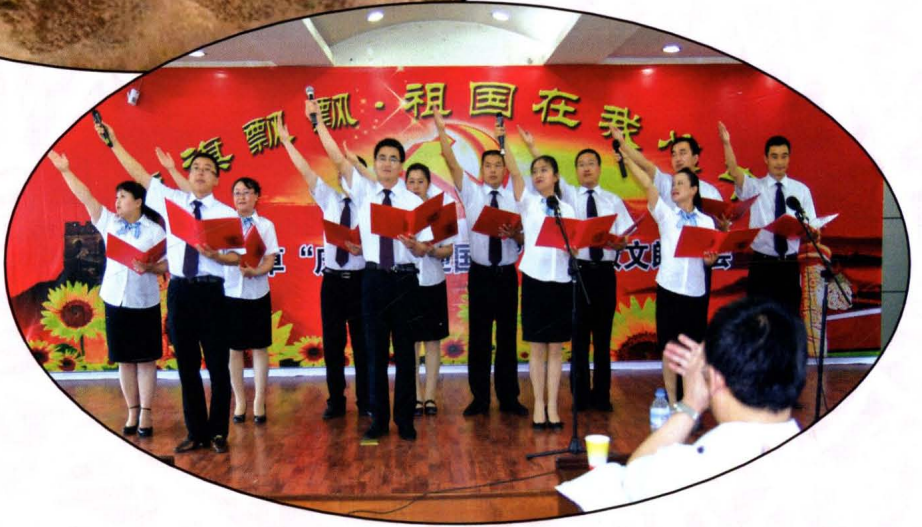
武威市烟草专卖局 (公司)“庆七一”诗歌朗诵 会