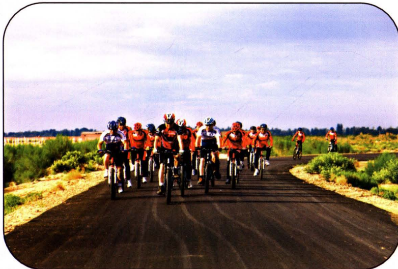
武威烟草“驰者无疆”自行车骑行俱乐部