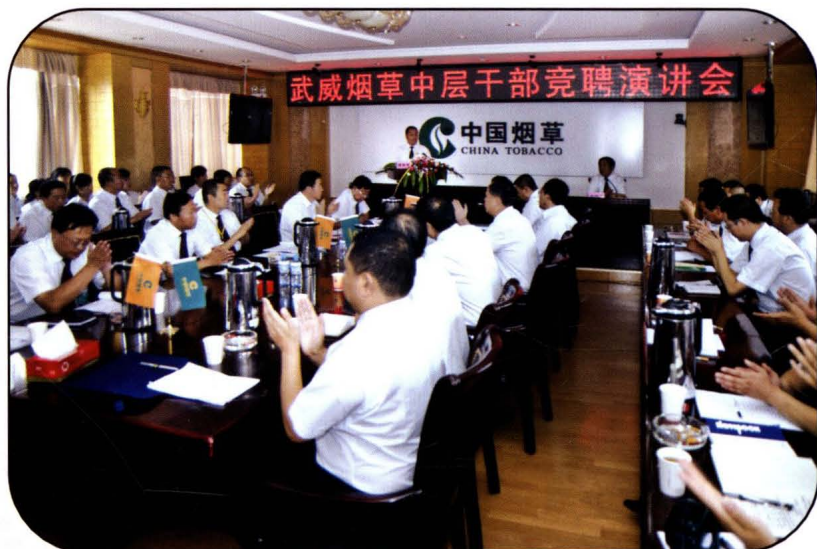
武威烟草中层干部竞聘 演讲会