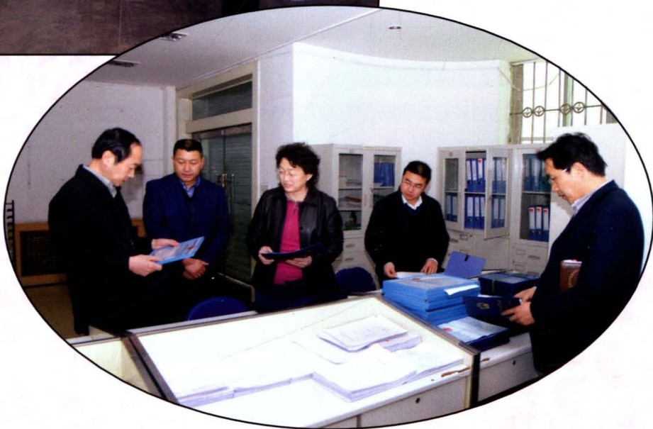
甘肃省烟草专卖局(公司)领导检查指导武威烟草网建工作