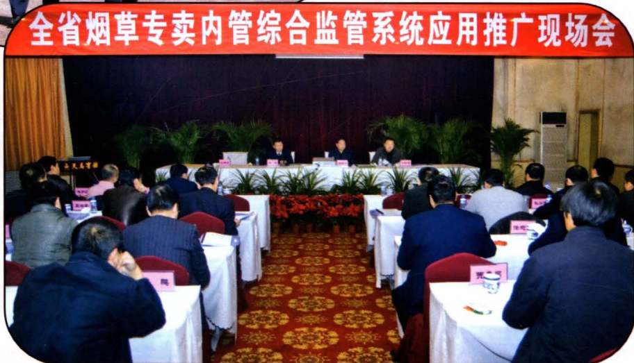
甘肃省烟草专卖内管综合监管系统应用推广现场会在武威召开