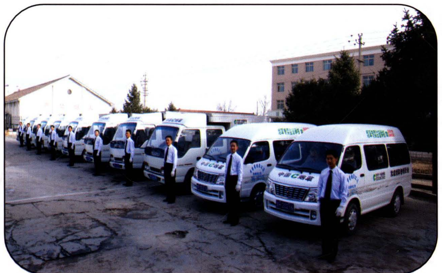
武威市烟草专卖局(公司) 物流配送队伍