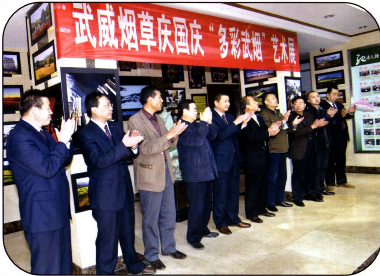
武威烟草庆国庆“多彩武烟”艺术展