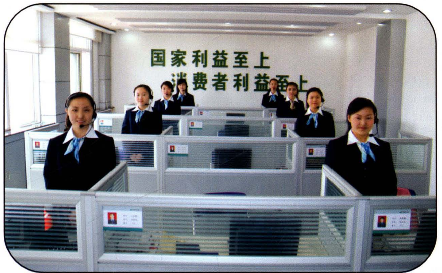
武威市烟草专卖局(公司) 电访员