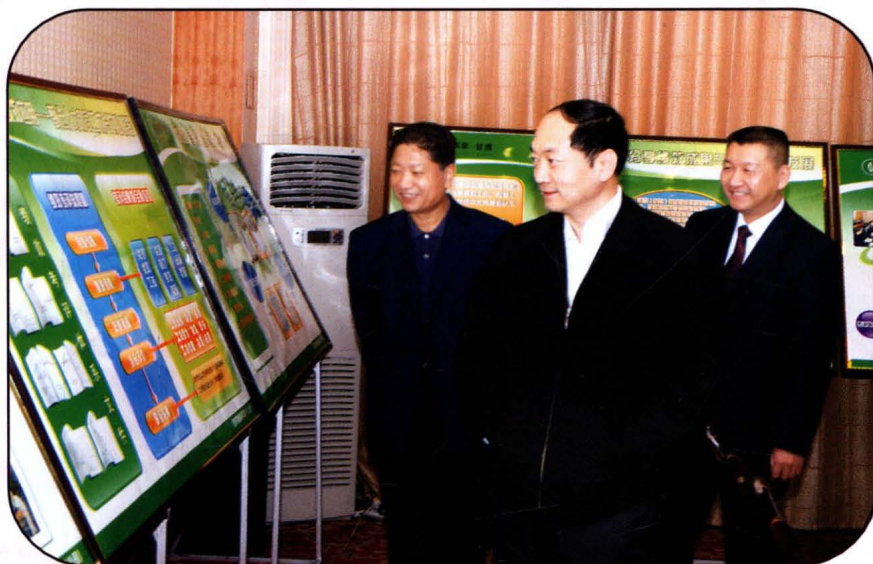
甘肃省烟草专卖局(公司)领导参观武威烟草绩效考核建设成果