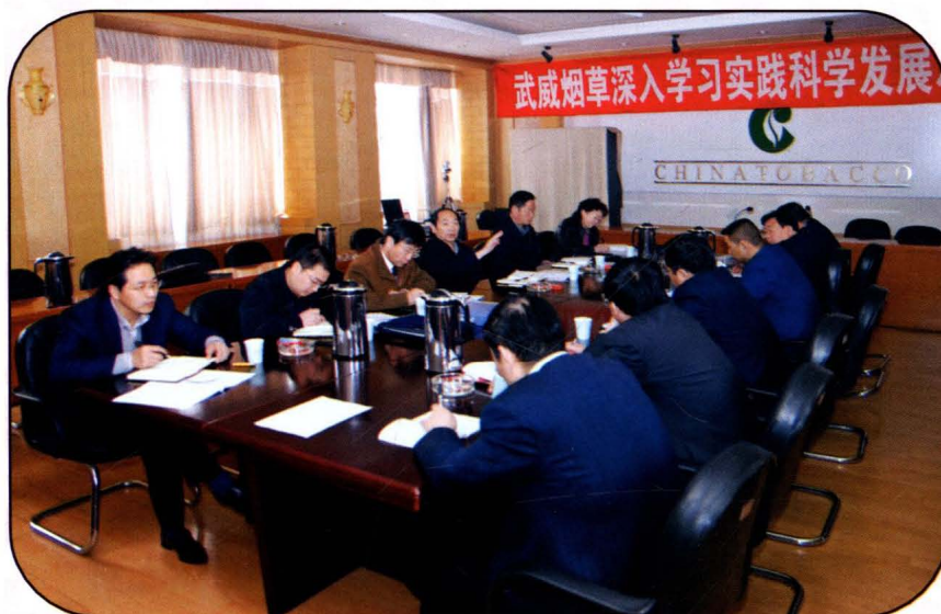
武威烟草深入学习实践科学 发展观