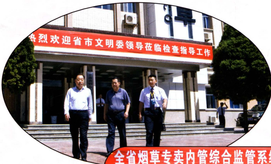
甘肃省文明委领导检查指导武威烟草精神文明创建工作