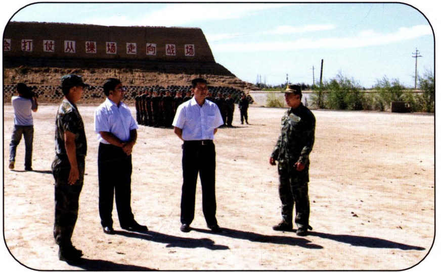
武威市烟草专卖局(公司) 领导检查专卖管理队伍军训情况