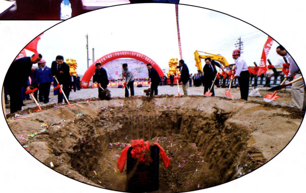
武威市烟草专卖局(公司)物流配送中心改扩建项目 工程奠基仪式