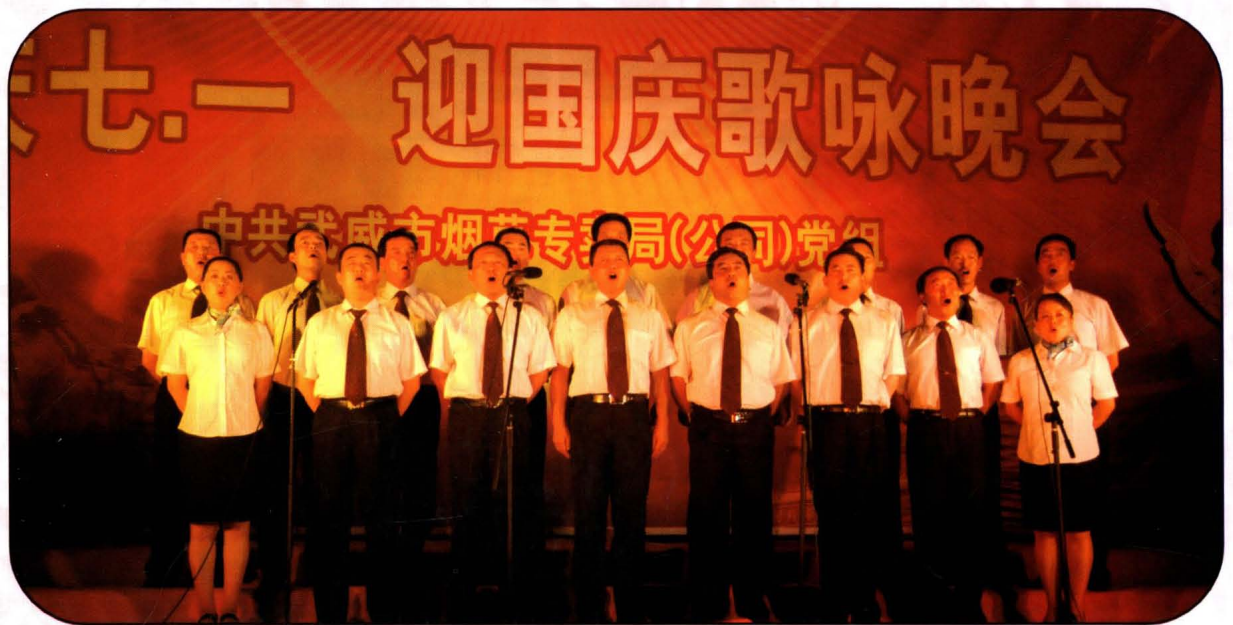
武威市烟草专卖局(公司)“庆七一·迎国庆”歌咏晚会