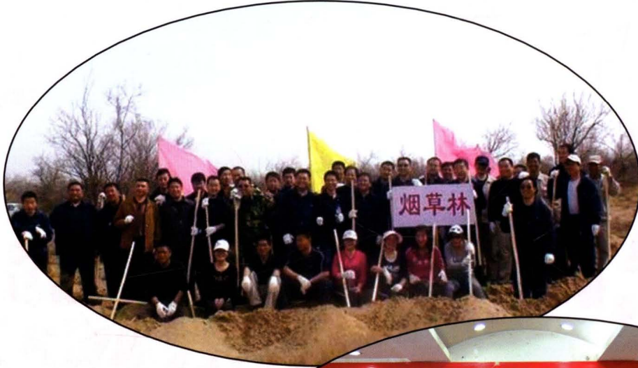
武威市烟草专卖局 (公司)积极参与义务植 树活动