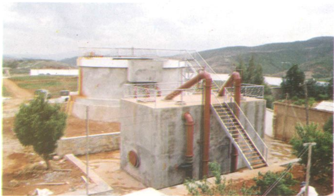
祥云县市政基础设施——自来水处理厂、 日处理自来水 8000 吨