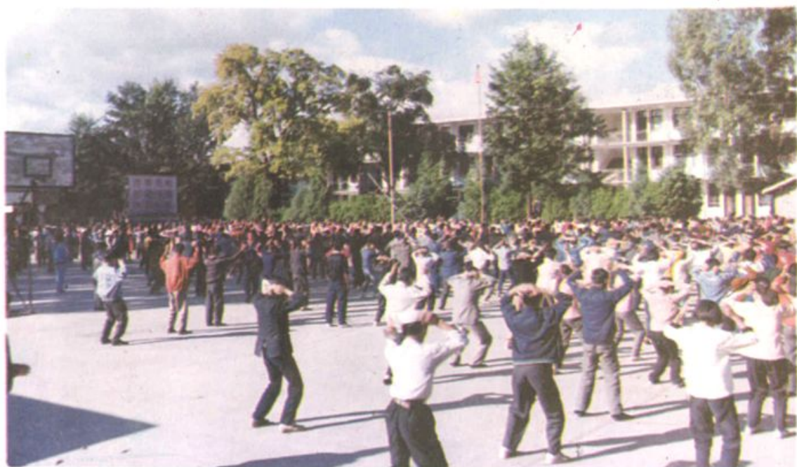
祥云县已基本达到扫除文盲县标准,教育事业已基本适应现代化建设的需要——图为祥城镇初级中学校园