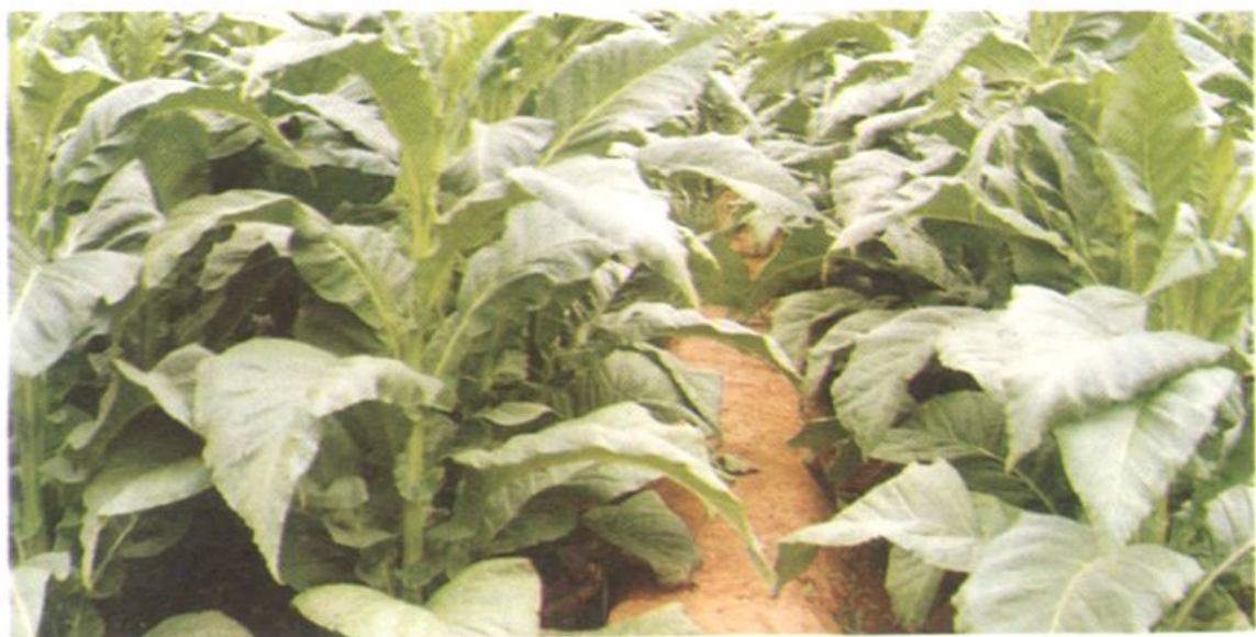
祥云县主要经济作物——烤烟