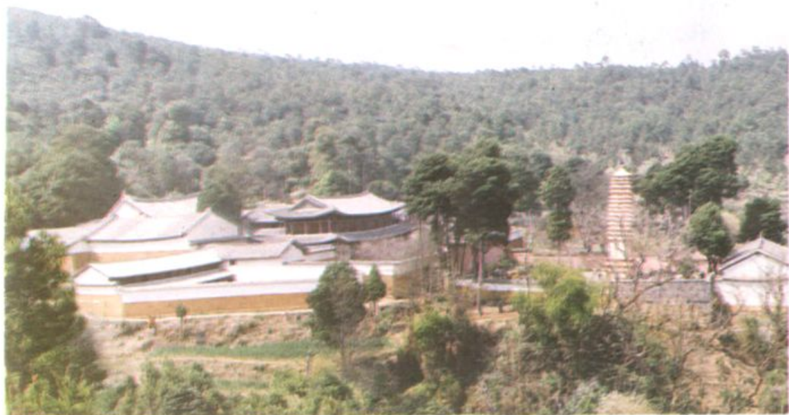
祥云县主要风景旅游区——水目寺