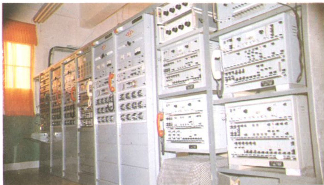
祥云县邮电事业发展迅速,从解放初的“摇把子”发展到九十年代具有世界先进水平的程控电话——图为程控电话机房。