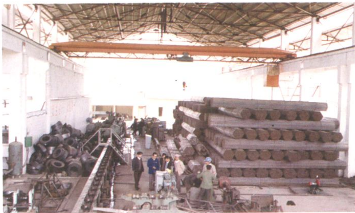
祥云县乡镇企业发展迅速——图为禾甸 高频焊管厂