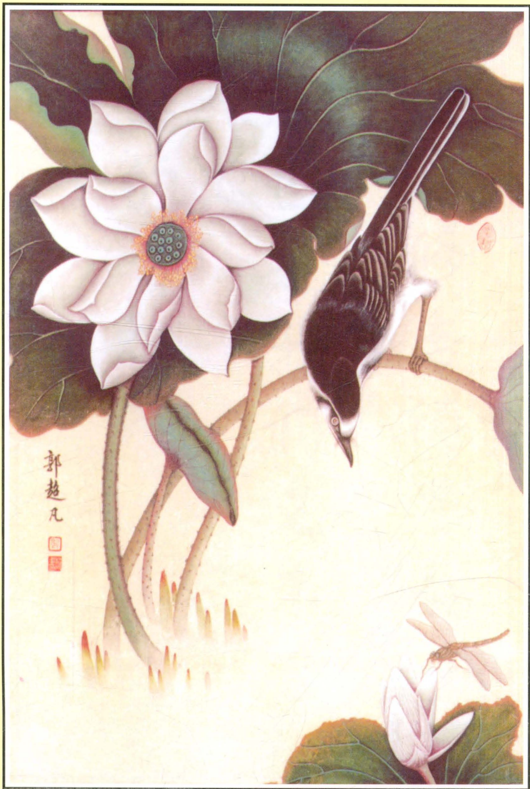
荏阳市政协副主席郭超凡