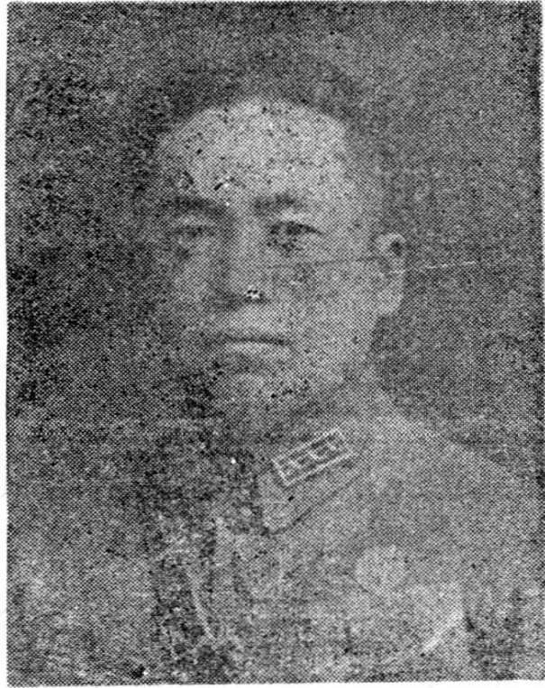
高 鹏 像