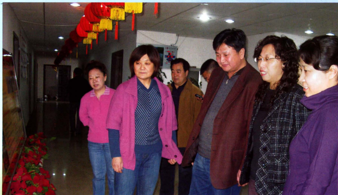
▲ 市深入学习实践科学发展观指导检查组检查科协工作（2009年4月8日）