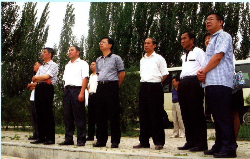
▲ 以省广电局副局长刘英魁（右四）为组长，由省政府办公厅、省社科联、省妇联、省科协等单位领导组成的全民素质工作督查组莅临我市检查。市科协主席赵春义（右三）陪同（2010年6月8日—9日）