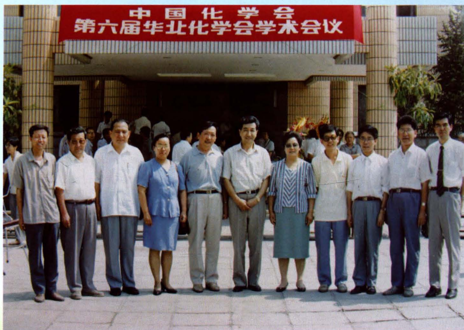
▲ 中国化学会第六届华北化学会学术会议于1994年8月2日——7日在大同机车厂隆重召开。副省长纪馨芳（正中）、省科协普及部部长彭惠林（左四）、市科协党组书记倪桂林（右五）主席关原成（右四）出席会议