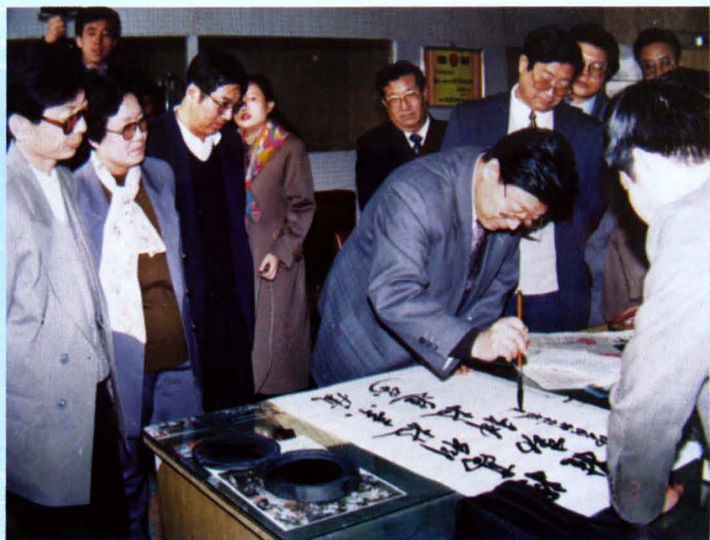
▶ 市委书记纪友伟为《大同科技报》题词（1995年3月）