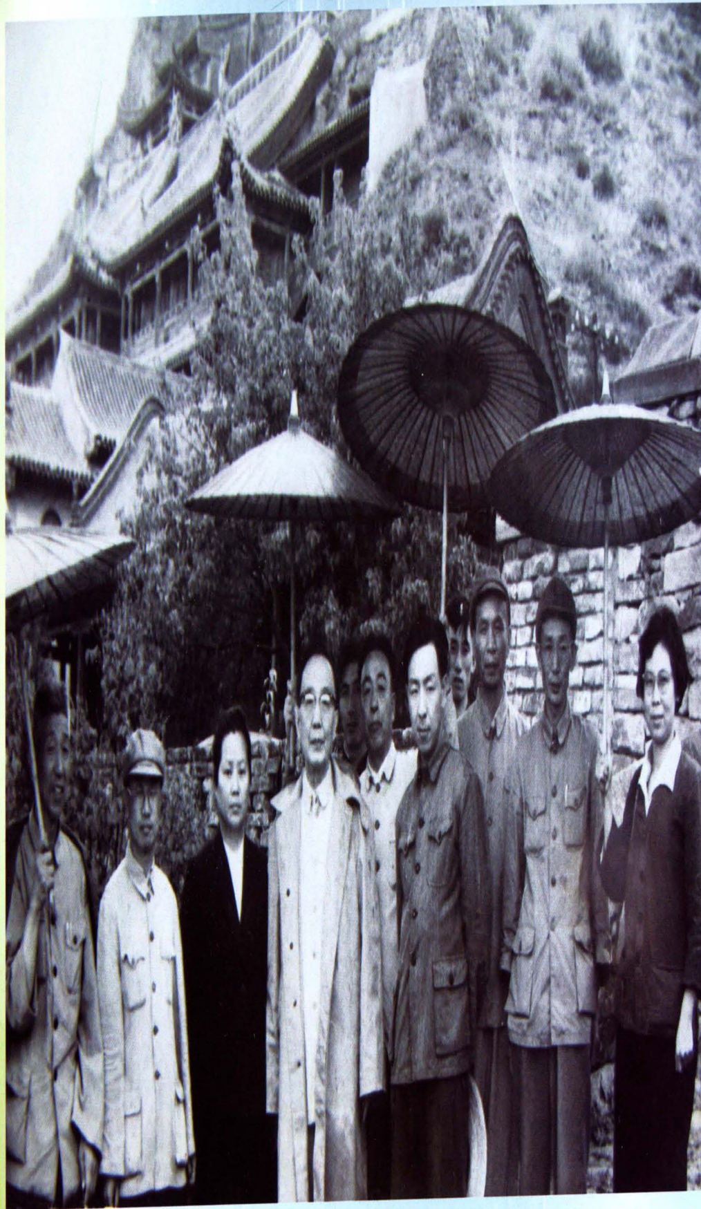
◀ 中国科学技术大学首任校长、现代著名学者、文学家、社会活动家郭沫若（左四）携夫人于立群来同视察科协工作，图为在云冈石窟留影。副市长肖秉敏（右三），市委秘书长曲正存（左二），市科学技术委员会主任陈清（右二）（1964年7月）