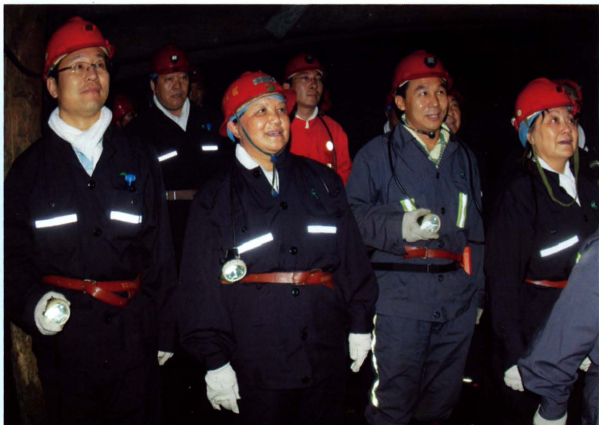
▲ 中国科协常务副主席、党组书记、书记处第一书记邓楠（前左二） 考察同煤集团“井下探秘游”科普教育基地（2007年6月）