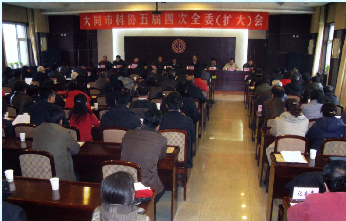
▲ 在市科协五届四次全委（扩大）会议上，赵春义当选为市科协主席。市委副书记柴树彬出席并作重要讲话（2010年1月28日）