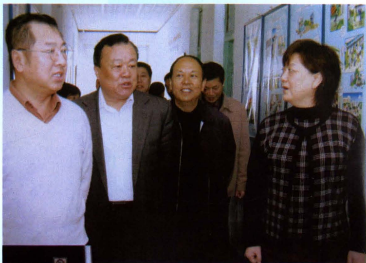
◀ 中共大同市委书记郭良孝（左二）在市科协视察指导工作（2006年3月24日）