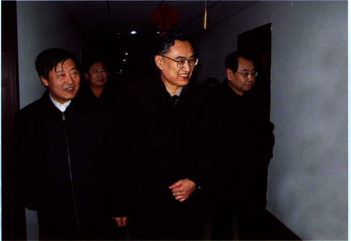
▲ 中国科协副主席、书记处书记齐让（中）来同视察科普惠农兴村工作。市委副书记高印（右）、副市长冀明德（左）陪同（2009年1月7日）