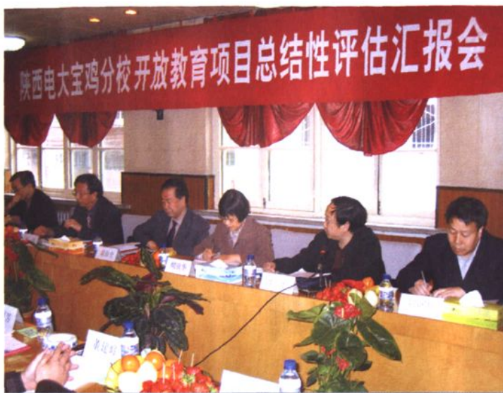
宝鸡电大「人才培养模式改革与开放教育试点」项目总结性评估汇报会

左二起省教育厅副厅长郝瑜，陕西电大校长、书记冀鼎全，陕西电大副书记、副校长周庆华，省教育厅高教处长曾平