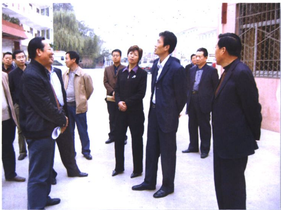
宝鸡市市长戴征社、副市长刘桂芳在市教育局局长苏天善陪同下来校视察