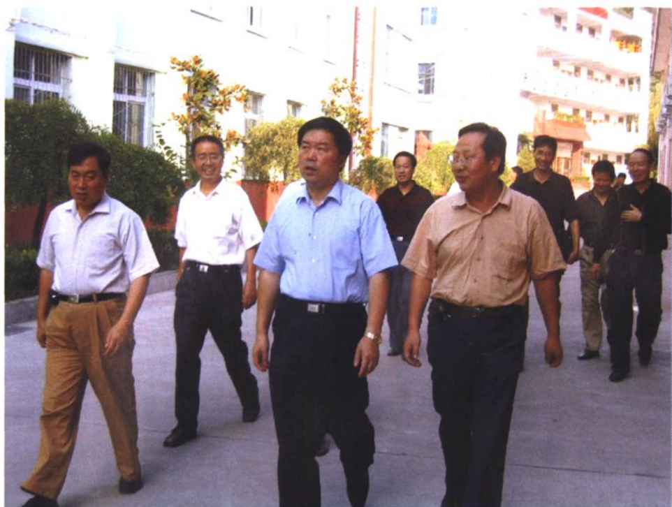
时任中共宝鸡市委书记姚引良（前排中）来校视察