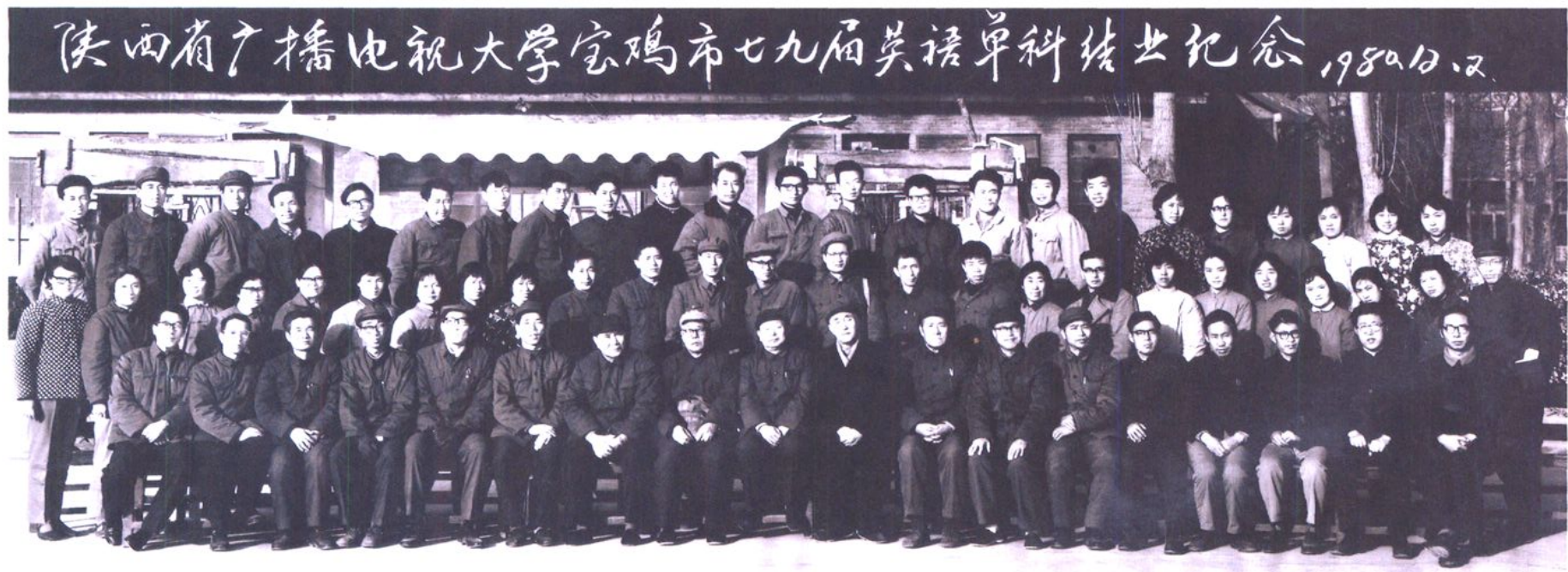
宝鸡电大首届英语单科生结业合影