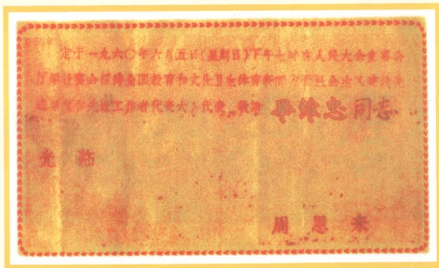
1960年参加全国文教群英会周恩来总理请柬