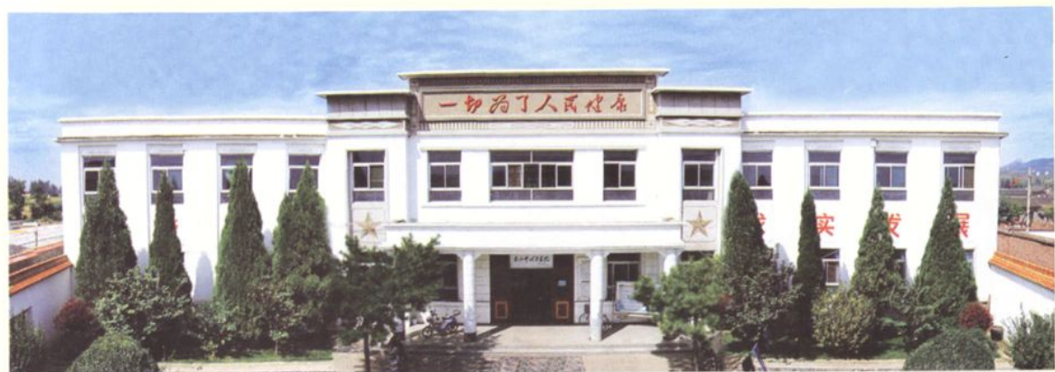
米山中心卫生院门诊大楼