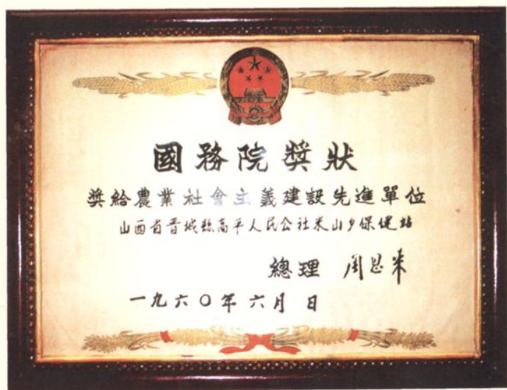
1960年米山保健站获得国务院奖状