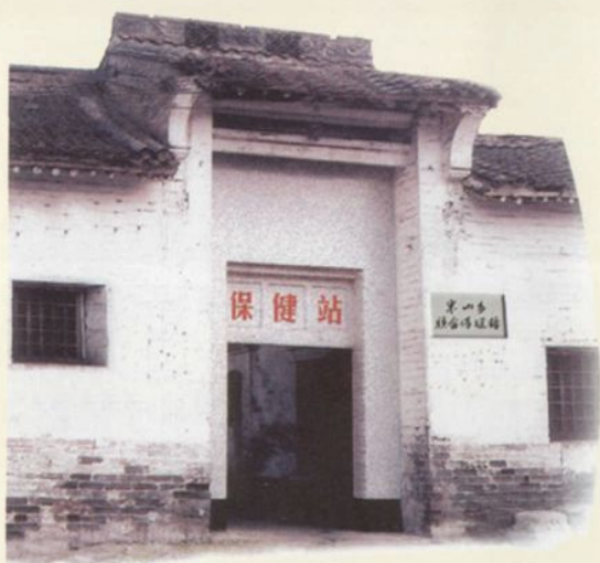
1957年米山乡联合保健站迁至狮子口旧址