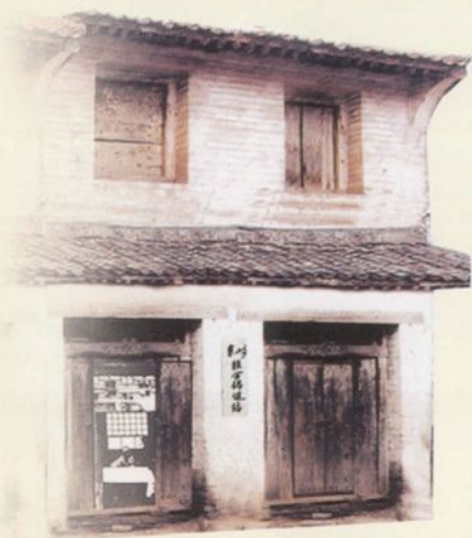
1955年创建米山乡联合保健站正街原址