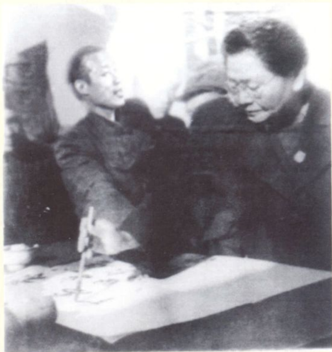
1959年国家卫生部部长李德全视察米山卫生院并题词