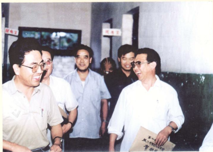
1992年省初级卫生保健验收工作组在米山中心卫生院检查工作