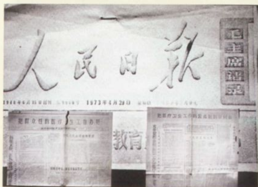
1973年《人民日报》发表了米山公社卫生院关于合作医疗经验的社论