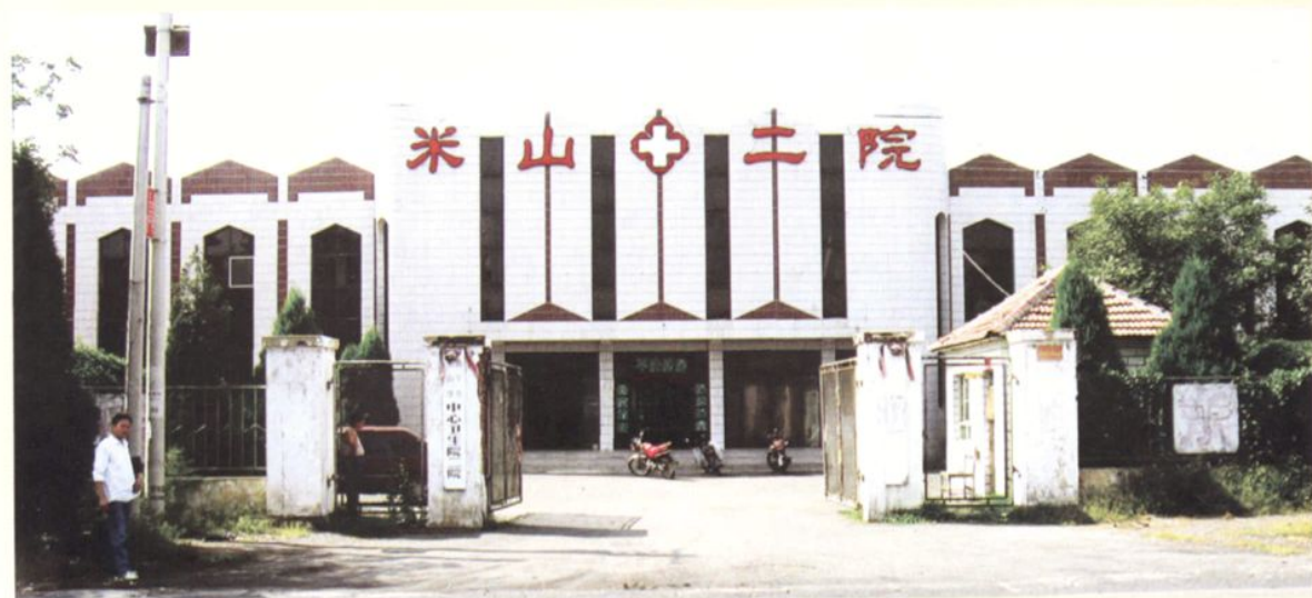
米山中心卫生院二院门诊大楼