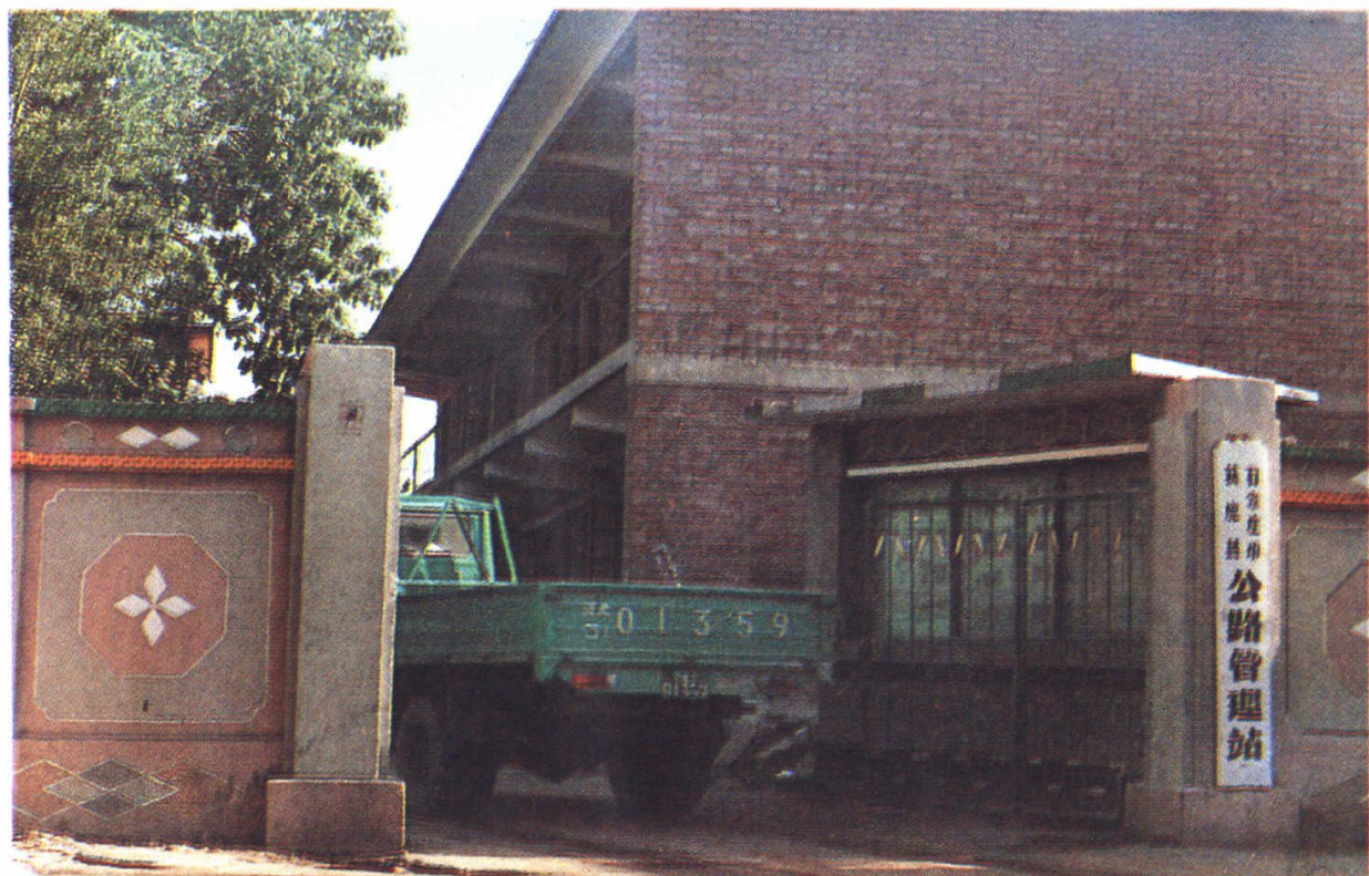
▲获鹿县公路管理站