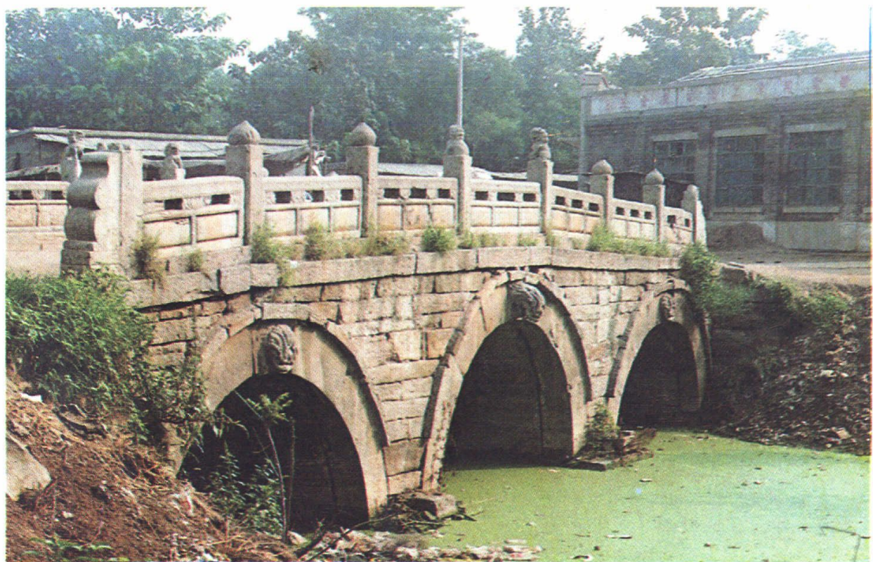
▲高迁村明代古桥—膏梁桥