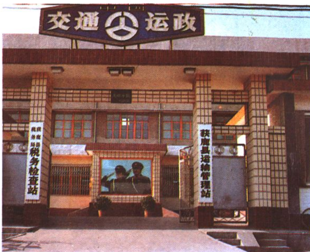
▲获鹿县运输管理站