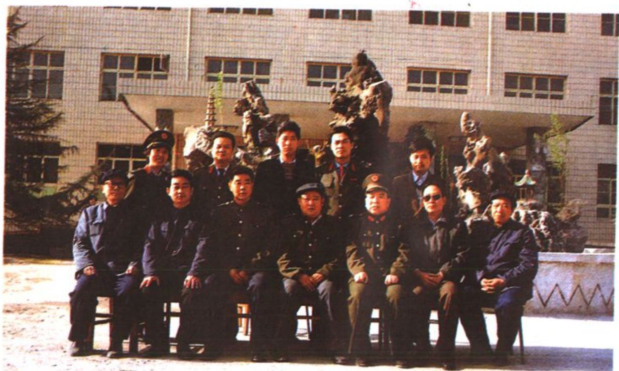
▲县交通局领导与修志工作人员合影