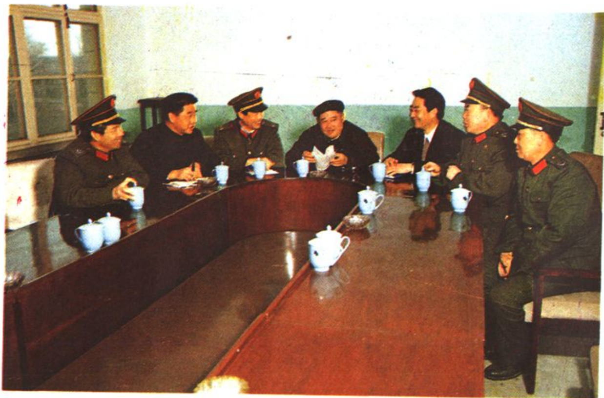
▲县交通局党委开会布置工作