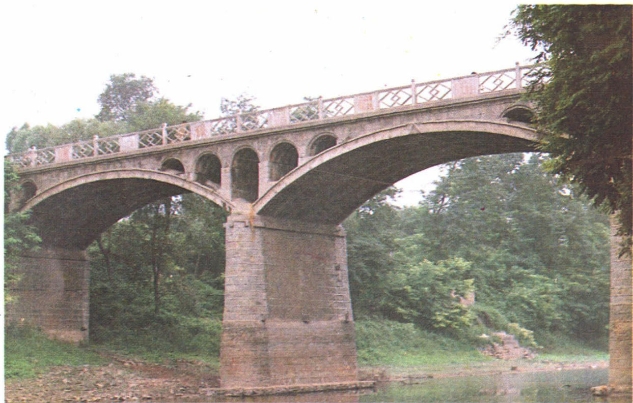
▲“五七路”百尺杆大桥