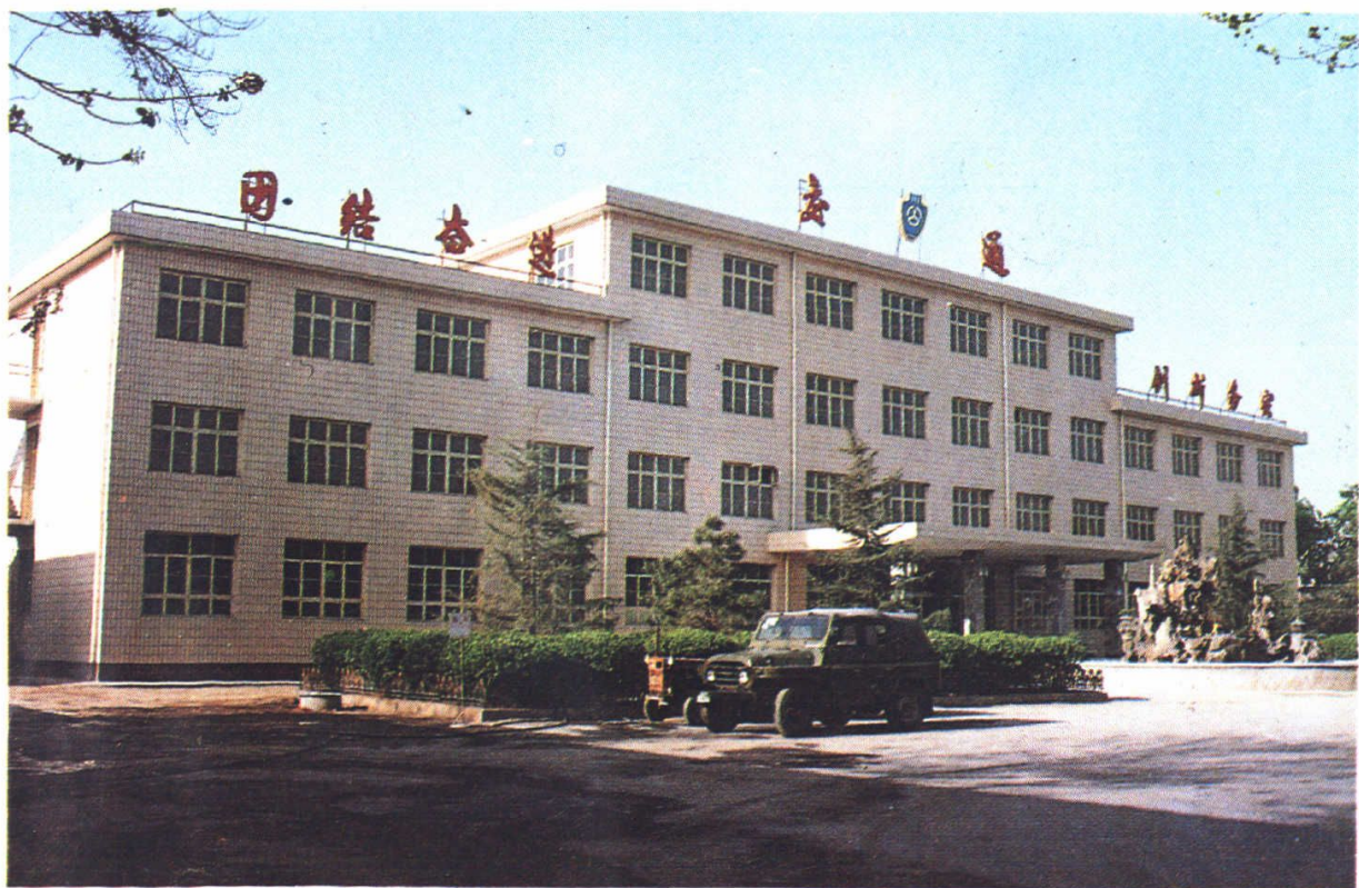
▲获鹿县交通局办公大楼