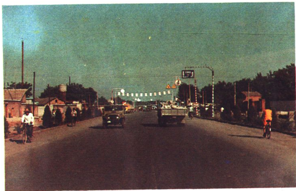
▲石太公路获鹿拓宽段