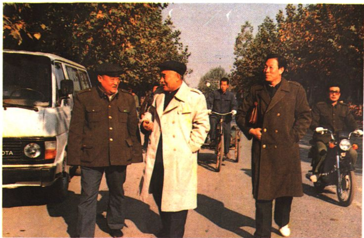
▲石家庄市副市长孙永生（中）中共获鹿县委书记刘俊亭（右一）视察我县公路建设