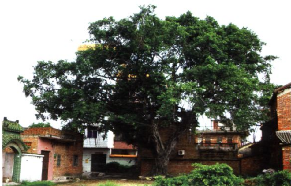
图为长在上陵旧村的百岁古榕