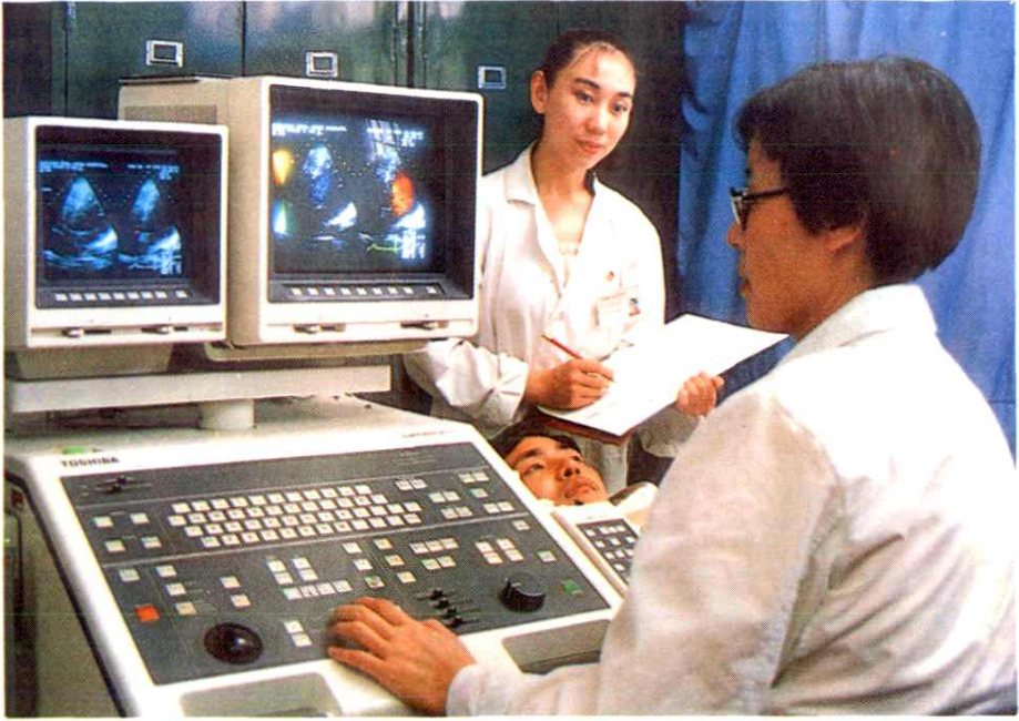
彩色多谱勒超声诊断仪