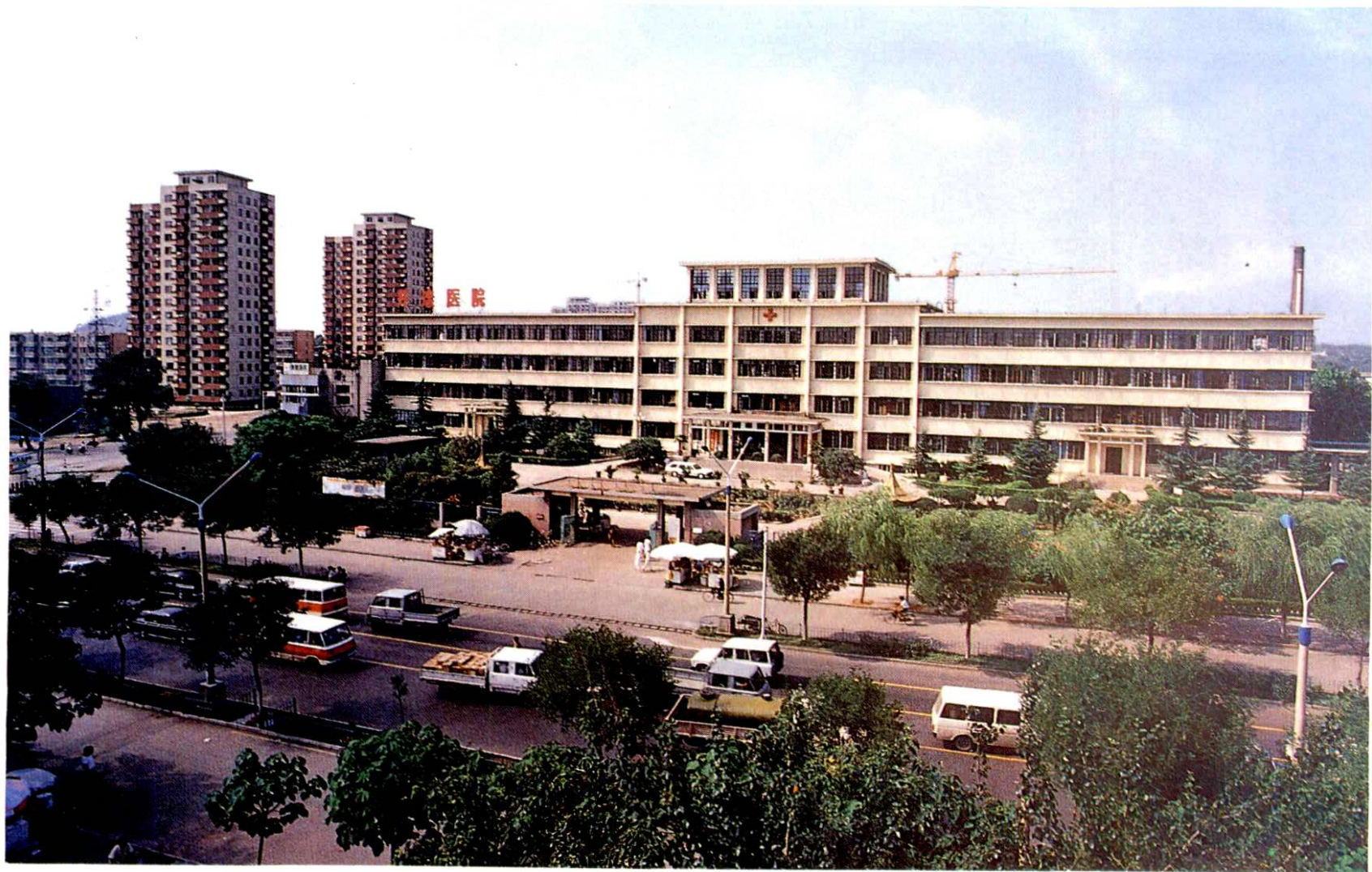
已有百年历史的开滦矿务局医院