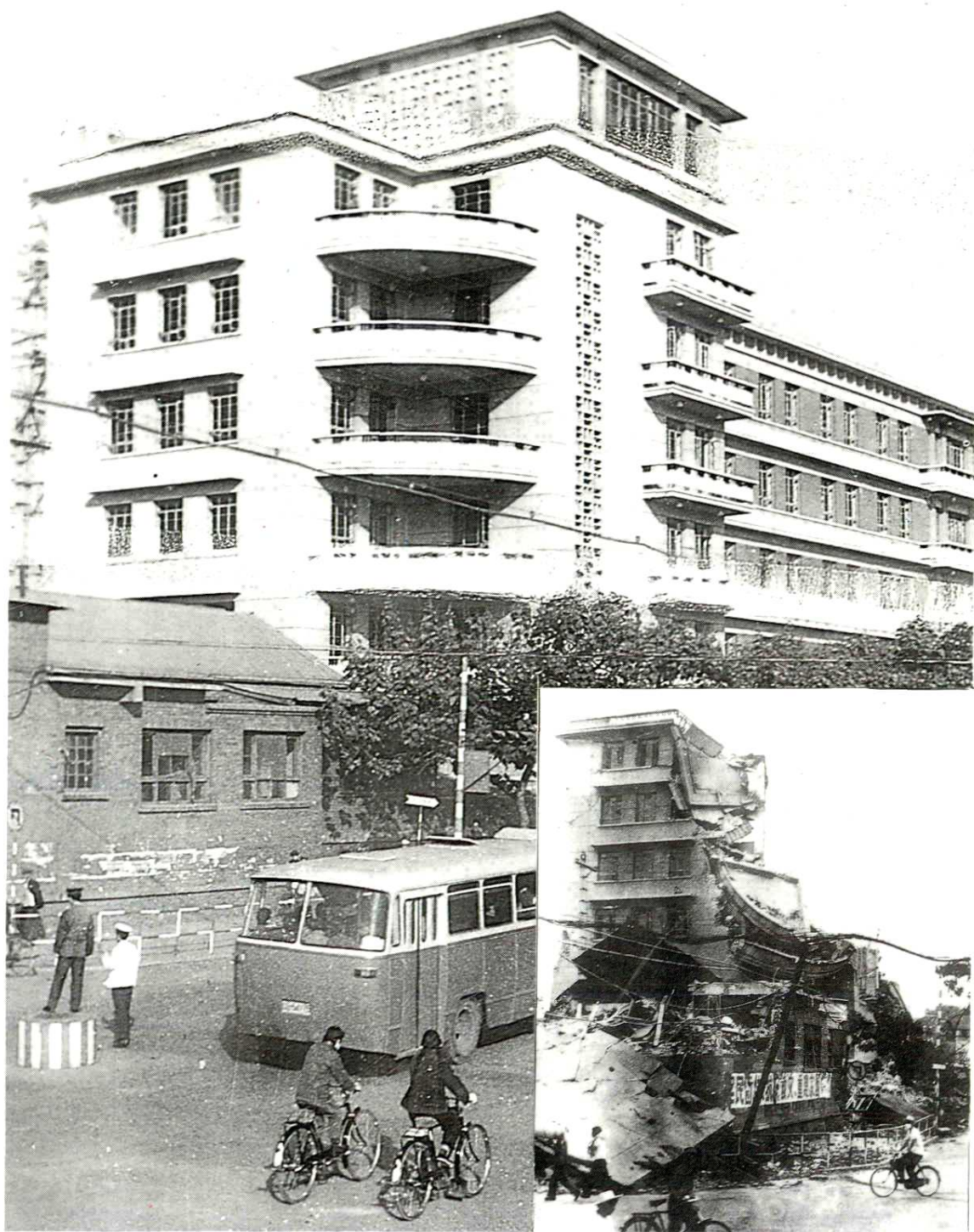
地震前开滦医院外景